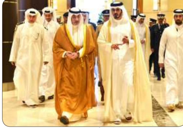
■ جانب من لقاء النائب الأول مع وزير الداخلية القطري