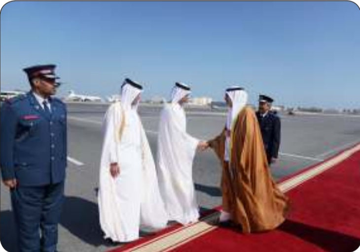
■ اليوسف مصافحا كبار المسؤولين