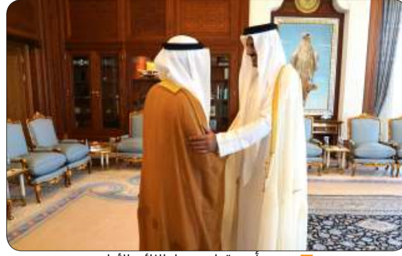
■ سمو أمير قطر مرحبا بالنائب الأول

الدوحة - "كونا": استقبل أمير دولة قطر الشقيقة الشيخ تميم بن حمد آل ثاني أمس الإثنين النائب الأول لرئيس مجلس الوزراء ووزير الدفاع الشيخ فهد اليوسف والوفد المرافق له بمناسبة زيارته للدوحة للمشاركة في افتتاح الدورة الـ 15 لمعرض ومؤتمر "مليبول قطر 2024".