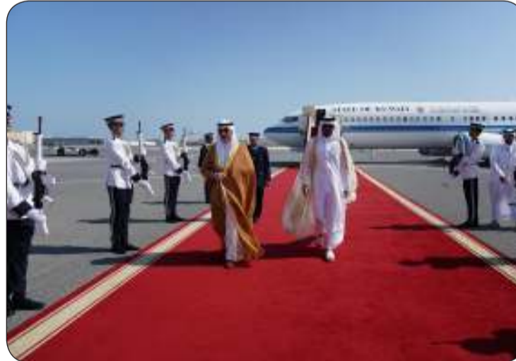
■ استقبال حافل للشيخ فهد اليوسف