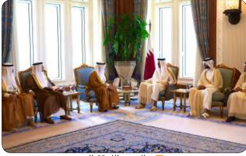
■ جانب من الاستقبال

وقال رئيس لجنة "مليبول قطر 2024" اللواء ناصر آل ثاني خلال مؤتمر صحفي أمس الأحد إن هذه النسخة تتميز بحضور أكبر عدد من الوفود الرسمية يصل لأكثر من 350 وفدا رسميا يضم كبار الشخصيات ما يدل على مكانة المعرض وأهميته على الصعيد الدولي.