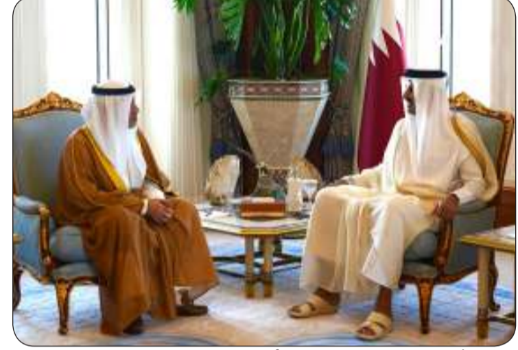
■ الشيخ فهد اليوسف نقل لأمير قطر تحيات القيادة السياسية