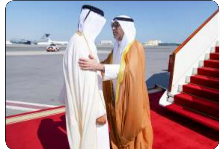
■ النائب الأول لدى وصوله إلى الدوحة وفي استقباله وزير الداخلية القطري

ترأس وفد الكويت في اجتماعات وزراء «عدل التعاون»