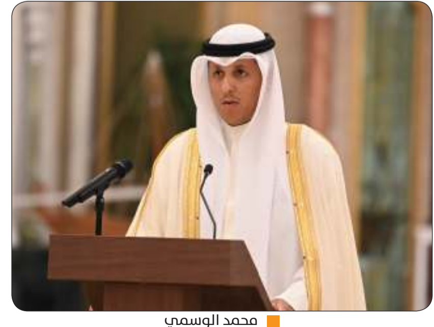
■ محمد الوسمي

برئاسة وزير العدل ووزير الأوقاف والشؤون الإسلامية د. محمد الوسمي، شاركت وزارة العدل في الاجتماع الرابع والثلاثين لوزراء العدل في دول مجلس التعاون لدول الخليج العربية المنعقد في دولة قطر الشقيقة.