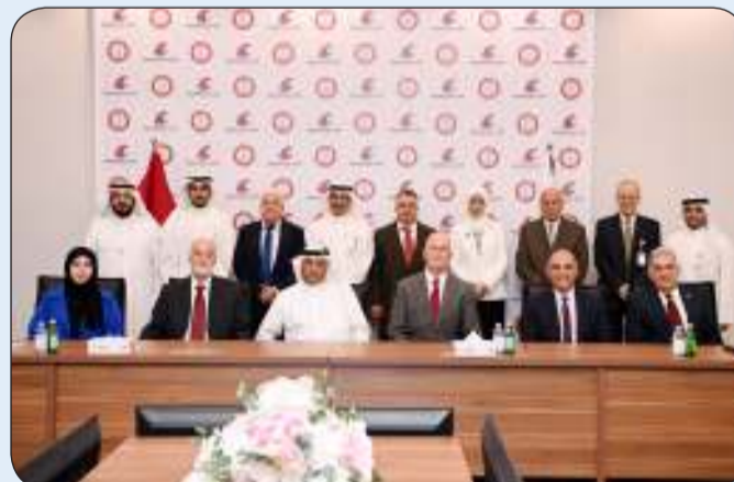
لقطة جماعية عقب التوقيع