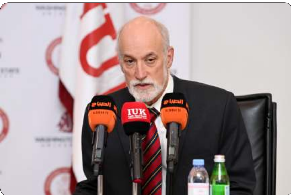
نائب رئيس جامعة ولاية واشنطن متحدثاً خلال حفل التكريم

إنشائه الجامعة الدولية للعلوم والتكنولوجيا في الكويت جرى خلال فترة «كورونا» وفي وقت كان مصير التعليم فيه مجهولاً