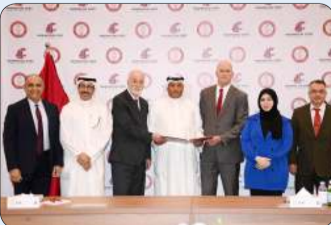
رئيسا الجامعة الدولية وجامعة ولاية واشنطن يرفغان وثيقة اتفاقية التعاون العلمي بينهما