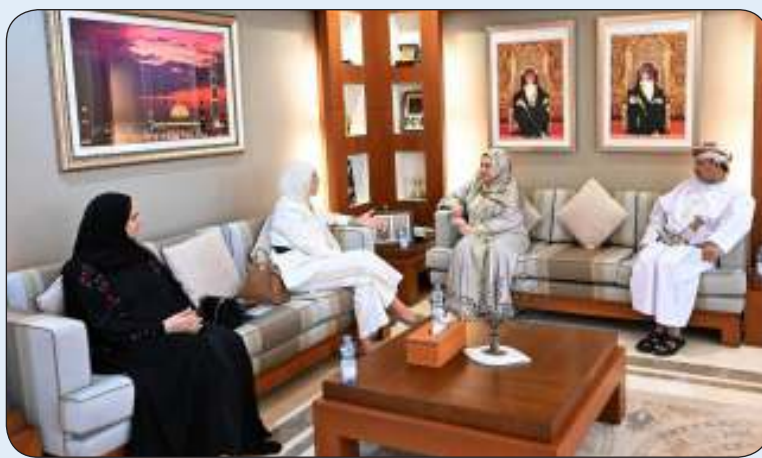
جانب من زيارة الوفد الكويتي إلى سلطنة عمان

بتوجيهات مباشرة من وزير التربية وزارتا «التعليم العالي» الكويتية والعمانية بحثا تعزيز التعاون في مجال البحث العلمي