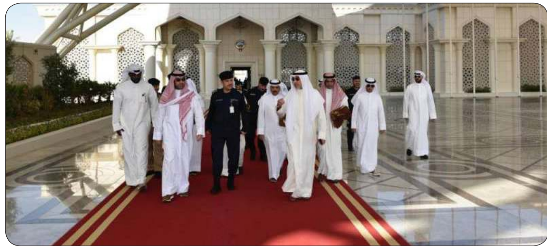
اليوسف خلال مغادرته إلى العراق للمشاركة في المؤتمر

وذكرت وزارة الداخلية العراقية في بيان، أن وزير الداخلية العراقي عبد الأمير الشمري كان على رأس مستقبلي الشيخ فهد