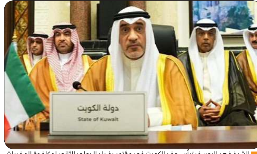
الشيخ فهد اليوسف ترأس وفد الكويت في مؤتمر بغداد الدولي الثاني لمكافحة المخدرات

ندعو لإنشاء قنوات اتصال لتبادل المعلومات بشكل فعال ومؤثر ومراجعة التشريعات القانونية التي تواجه هذه القضايا لنواصل بذل الجهود لمحاربة عمليات تهريب وترويج السموم وتحقيق التكامل الأمني وتبادل المعلومات إقليميا ودوليا السوداني : العراق لديه استعداد كامل وانفتاح تام على كل تعاون أو جهد مع الدول الشقيقة والصديقة في هذا المجال التخادم بين الإرهاب وعصابات المخدرات يسعى لخلق مناطق معزولة خارج سيطرة القانون لهر الأسس المستقرة للمجتمعات هذه المواد الخطرة استخدمت في تجنيد الإرهابيين بهدف نشر الصراع وتوسعة ساحات العنف لإنتاج التطرف والمزيد من اللاجئين