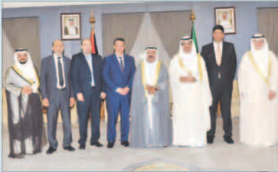
الشيخ ناصر الصباح مستقبلاً الخرينج والحويلة ونائب رئيس مجلس النواب المغربي

استقبل وزير شؤون الديوان الأميري الشيخ ناصر صباح الأحمد الصباح نائب رئيس مجلس الأمة مبارك الخرينج والعضو الدكتور محمد هايف الحويلة يرافقه نائب رئيس مجلس النواب بالملكة المغربية عبداللطيف بروجو وعضو مجلس النواب ورئيس مجموعة الصداقة البرلمانية المغربية الكويتية محمد العربي تبادل الأحاديث الودية.