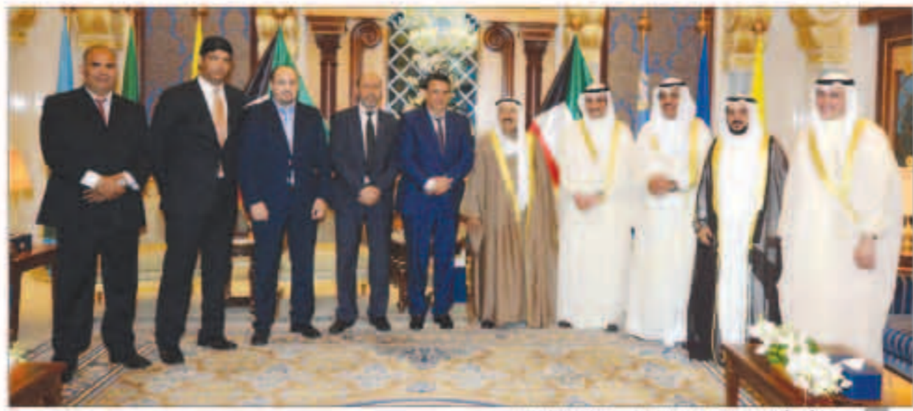
سمو الأمير أثناء استقباله الغانم ونائب رئيس مجلس النواب المغربي

استقبل سمو أمير البلاد الشيخ صباح الأحمد بقصر بيان ظهر أمس رئيس مجلس الأمة مرزوق علي الغانم ورئيس مجلس الشورى الإسلامي في الجمهورية الإسلامية الإيرانية الدكتور علي لا ريحاني والوفد المرافق وذلك بمناسبة زيارته الرسمية للبلاد. كما استقبل سموه نائب رئيس مجلس النواب بالملكة المغربية الشقيقة عبداللطيف وهي وذلك بمناسبة زيارته الرسمية للبلاد. وحضر المقابلة نائب وزير شؤون الديوان الأميري الشيخ علي الجراح ونائب رئيس مجلس الأمة مبارك بنينة الخريج. واستقبل سمو أمير البلاد الشيخ صباح الأحمد سمو الشيخ ناصر