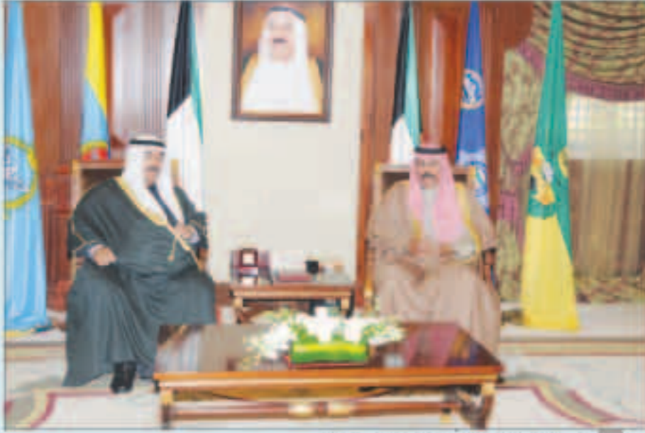
سمو ولي العهد مستقبلاً سمو الشيخ ناصر المحمد

استقبل سمو ولي العهد الشيخ نواف الأحمد بقصر بيان ظهر أمس سمو الشيخ ناصر المحمد.