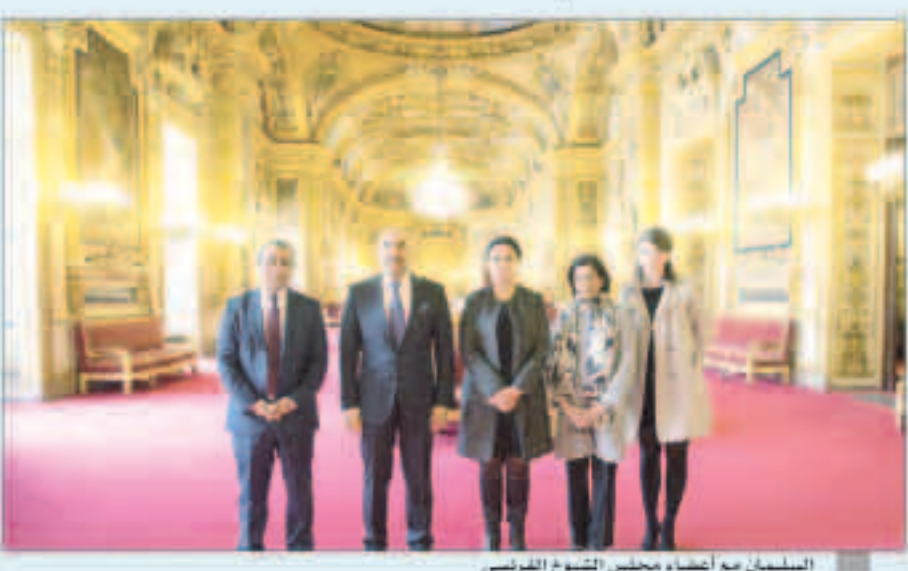
السليمان مع أعضاء مجلس الشيوخ الفرنسي

باريس - كونا: بحث سفير دولة الكويت لدى فرنسا سامي السليمان مع أعضاء من مجلس الشيوخ الفرنسي ورئيسة مجموعة الصداقة الفرنسية - الكويتية ليلي عابشي أس العلاقات الثنائية بين البلدين وسبل توثيقها في شتى المجالات لاسيما البرلمانية. وقال السفير السليمان في بيان عقب غداء عمل في مجلس الشيوخ مع عابشي التي تقلد أيضا منصب نائبة رئيس لجنة الشؤون الخارجية والدفاع والقوات المسلحة أن اللقاء يأتي في إطار الاهتمام الكويتي بتعزيز العلاقات مع جميع مكونات المجتمع الفرنسي. وأوضح أنه بحث مع أعضاء مجلس الشيوخ الفرنسي إمكانية زيارة دولة الكويت واللقاء