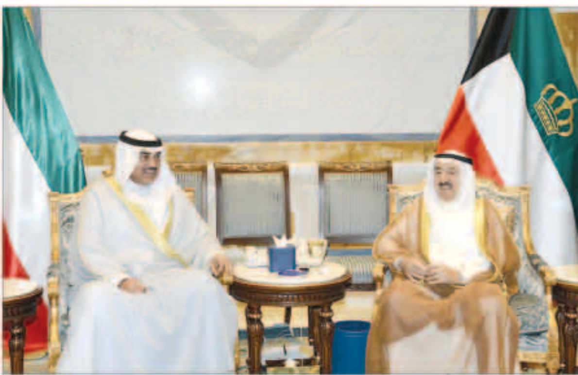
سمو أمير البلاد مستقبلا الشيخ صباح الخالد

استقبل سمو أمير البلاد الشيخ صباح الأحمد بقصر بيان صباح أمس النائب الأول لرئيس مجلس الوزراء ووزير الخارجية الشيخ صباح الخالد. وبعث سمو أمير البلاد الشيخ صباح الأحمد ببرقية تعزية إلى فخامة الرئيس رافائيل كوريا ديلغادو رئيس جمهورية الإكوادور الصديقة عبر فيها سموه عن خالص تعازيه وصادق مواساته بضحايا الزلزال الذي ضرب إقليم أزييميرالديس والمصابين راجيا سموه للضحايا الرحمة وأسفر عن سقوط العديد من الضحايا والمسافرين راجيا سموه للشفاء وبيان يتمكن المسؤولون في البلد الصديق من تجاوز آثار هذه الكارثة الطبيعية. وبعث سمو ولي العهد الشيخ نواف الأحمد ببرقية تعزية إلى فخامة الرئيس رافائيل كوريا ديلغادو رئيس جمهورية الإكوادور الصديقة ضمنها سموه خالص تعازيه وصادق مواساته بضحايا الزلزال الذي ضرب إقليم أزييميرالديس راجيا سموه للضحايا الرحمة وللمصابين سرعة الشفاء. كما بعث سمو الشيخ جابر المبارك رئيس مجلس الوزراء ببرقية تعزية مماثلة.