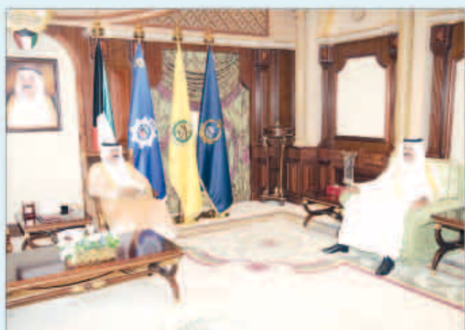
سمو ولي العهد مستقبلا الشيخ أحمد التوفيق

استقبل سمو ولي العهد الشيخ نواف الأحمد بقصر بيان صباح أمس محافظ حولي الشيخ الفريق أول منقاع أحمد التوفيق.