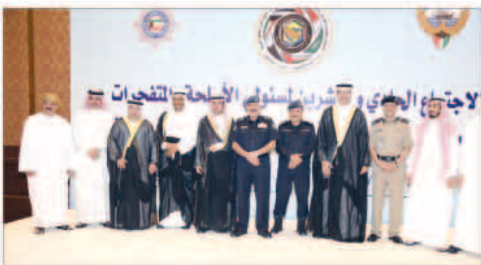
مسؤولو الأسلحة بدول مجلس التعاون

الخاصة بالأسلحة النارية المفقودة التي سبق ترخيصها، وأعاد بيان الاجتماع سيبحث أيضا ملف الأسلحة المهربة والمعدلة ومناقشة طرق وأساليب التخلص من الألعاب النارية والإنفاق على مواصفات ثبات نقل المتفجرات ومستودعات المتفجرات. وتطرق الدوسري في كلمته إلى مناقشة وتعميم المواد التجارية التي تدخل في صناعة المتفجرات المنزلية والمتفجرات التي وصلت إليه دول المجلس بالتعاون في هذا المجال والخطط النوعية والجوانب المتعلقة بمخاطر الأسلحة والمتفجرات وشروط المعاملين بهذا المجال في الشركات المدنية بالدول الأعضاء. من جانبه أعرب ممثل الأمانة العامة لمجلس التعاون الخليجي عن شكره وتقديره لجهود الكويت التي ساهمت في إعداد لائحة المتفجرات، واستضافتها لاجتماع مسؤولي الأسلحة والمتفجرات بدول مجلس التعاون لدول الخليج العربية والوفود المشاركة