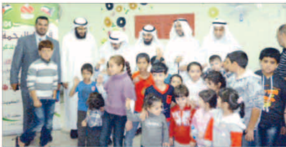
أعضاء جمعية الرحمة في لحظة مع أطفال سوريا