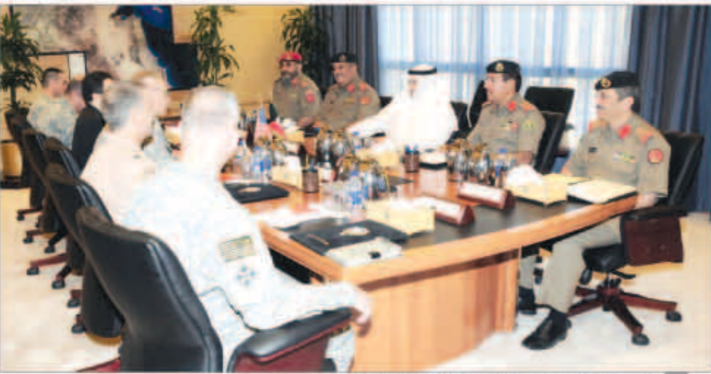
الشيخ خالد الجراح استقبلاً قائد القوة البرية الأمريكية الوسطى

بالجوانب العسكرية. وأشاد الجراح بمحكمة العلاقات الثنائية بين البلدين الصديقين وحرص الطرفين على تعزيزها وتطويرها. حضر الاجتماع معاون رئيس الأركان العامة لهيئة الاستخبارات والأمن اللواء الركن عبدالرحمن الهذلول، وأمر القوة البرية اللواء الركن خالد الفودري وعدد من قيادات الجيش.