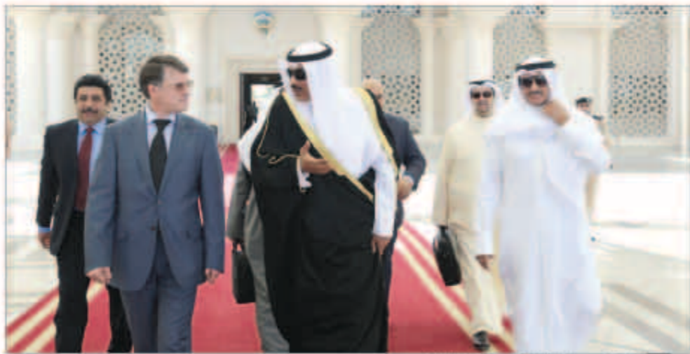
الشيخ صباح الخالد أثناء مغادرته البلاد

غادر نائب رئيس مجلس الوزراء وزير الخارجية الشيخ صباح الخالد بعد ظهر أمس، متوجهاً إلى العاصمة الروسية موسكو في زيارة رسمية تستغرق يومين يجري خلالها مباحثات رسمية مع وزير خارجية روسيا الاتحادية سيرغي لافروف. وكان في وداعه معاليه مدير إدارة المراسم السفير ضاري عجران العجران وسفير روسيا الاقتصادية لدى دولة الكويت ألكسي سولوماتين. ويرافق الشيخ صباح الخالد في زيارته مدير إدارة أوروبا السفير وليد علي الخيزري والسفير في الديوان العام ناصر حجي المزين وعدد من مسؤولي وزارة الخارجية.