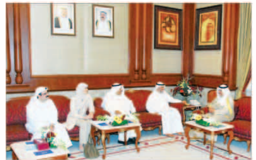
سمو الشيخ جابر المبارك مستقبلاً رئيس وأعضاء جمعية الشفافية