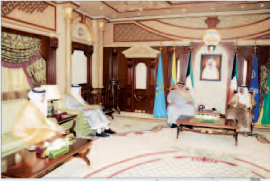
سموه مستقبلاً الخالد والحمود والتعبدي

استقبل سمو ولي العهد الشيخ نواف الأحمد بقصر بيان صباح أمس رئيس مجلس الأمة علي الراشد. واستقبل سموه سمو الشيخ جابر المبارك رئيس مجلس الوزراء وزير الداخلية الشيخ أحمد الحمود. كما استقبل سمو ولي العهد نائب رئيس مجلس الوزراء وزير الدفاع الشيخ أحمد الخالد. كما استقبل سمو ولي العهد وزير الإعلام وزير.