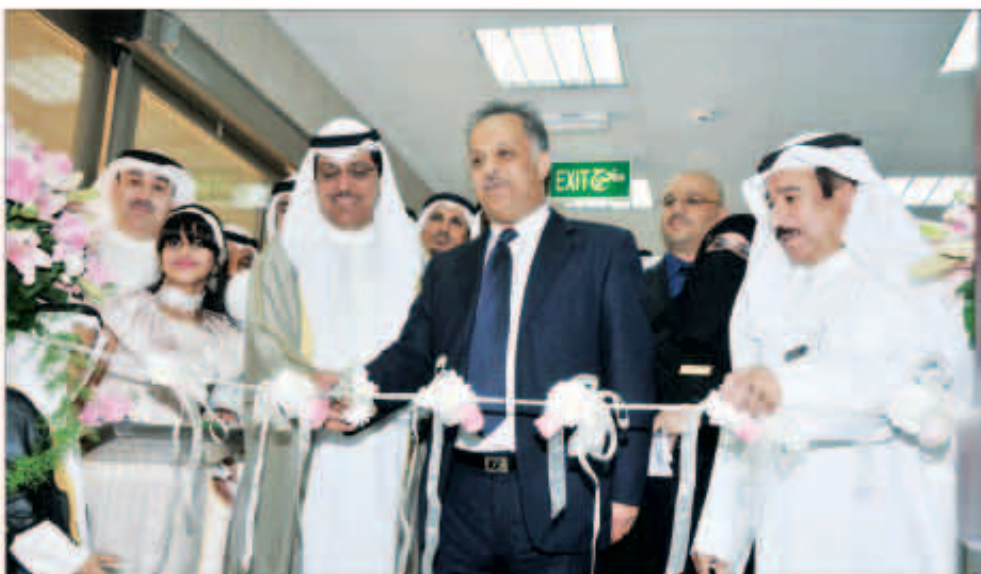
الوزير الهيضي ونائب رئيس مجلس الأمة خلال افتتاح مركز الرابية الصحي

افتتح مركز الرابية الصحي لخدمة سكان المنطقة