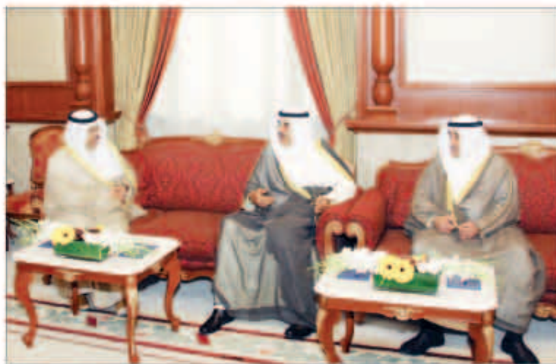
سموه مستقبلاً الخالد والبدر

وقف هدر الطاقات ومكافحة الفساد وتوجيه الموظف والمسؤول نحو الطرق الصحيحة للعمل