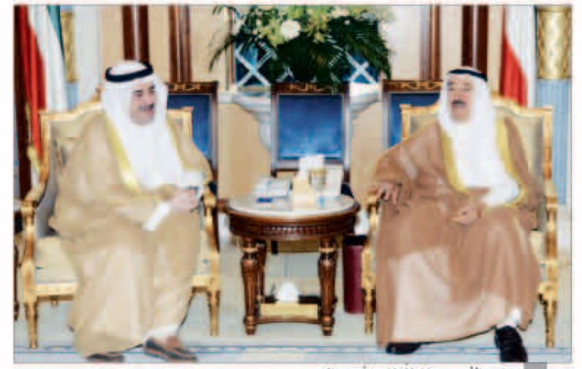
سمو الأمير مستقبلاً الشيخ أحمد الحمود

استقبل سمو أمير البلاد الشيخ صباح الأحمد بقصر صباح أمس ولي العهد الشيخ نواف الأحمد. كما استقبل سمو ولي العهد الشيخ جابر المبارك رئيس مجلس الوزراء، كما استقبل سموه النائب الأول لرئيس مجلس الوزراء وزير الداخلية الشيخ أحمد الحمود.