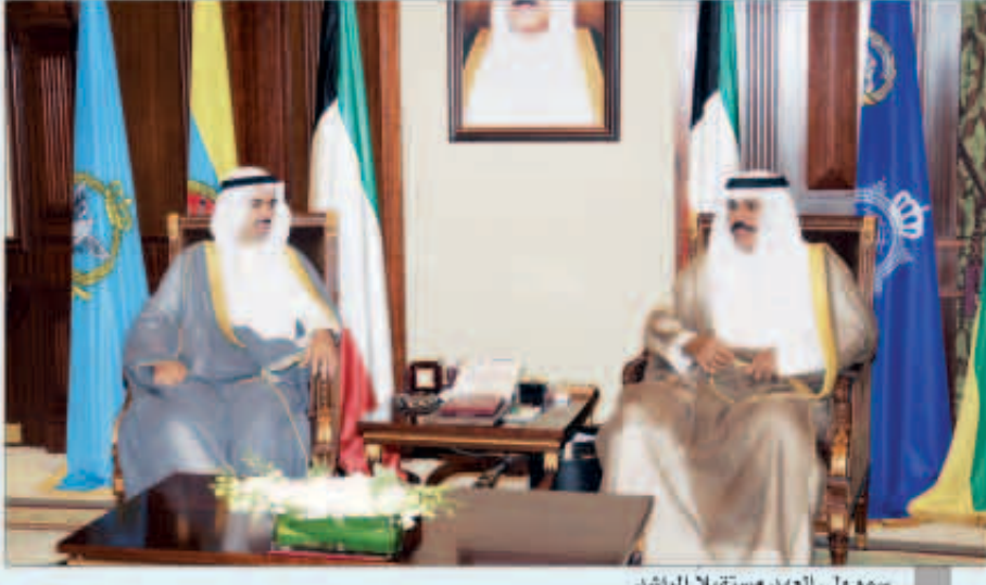
سمو ولي العهد مستقبلاً الراشد

استقبل سمو ولي العهد الشيخ نواف الأحمد بقصر بيان صباح أمس رئيس مجلس الأمة علي الراشد. واستقبل سموه سمو الشيخ جابر المبارك رئيس مجلس الوزراء. كما استقبل سمو ولي العهد الشيخ نواف الأحمد أمير نائب رئيس مجلس الوزراء وزير الخارجية الشيخ صباح الخالد حيث قدم لسموه عبدالوهاب البدر وذلك بمناسبة تعيينه مديراً عاماً للصندوق الكويتي للتنمية الاقتصادية العربية بدرجة وزير.