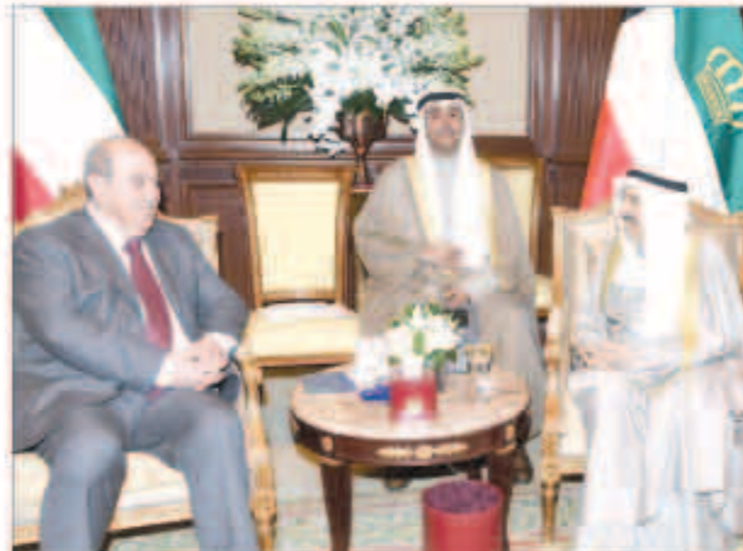
سمو مستقبلاً ايااد علاوي

استقبل سمو أمير البلاد الشيخ صباح الأحمد بقرص بيان صباح أمس سمو ولي العهد الشيخ نواف الأحمد. كما استقبل سمو ولي العهد الشيخ نواف الأحمد رئيس مجلس الوزراء ورئيس مجلس الأمة مرزوق الغانم. واستقبل سمو ولي العهد الشيخ جابر المبارك رئيس مجلس الوزراء ورئيس مجلس الأمة مرزوق الغانم. واستقبل سمو ولي العهد الشيخ أحمد النواف.