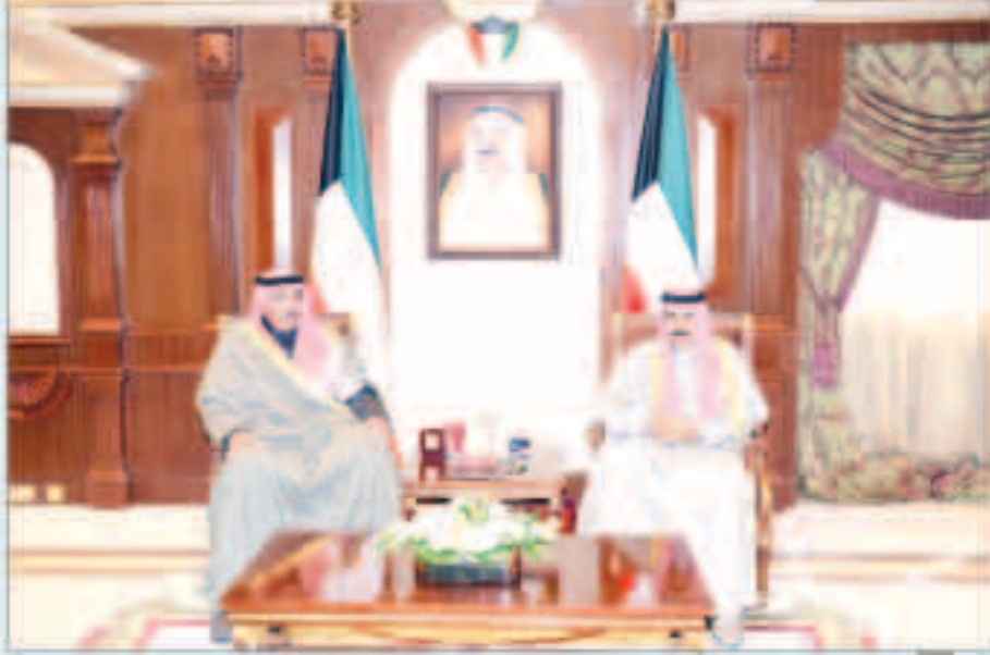
سمو ولي العهد مستقبلاً الشيخ صباح الخالد

استقبل سمو ولي العهد الشيخ نواف الأحمد بقرص بيان صباح أمس رئيس مجلس الأمة مرزوق الغانم. كما استقبل سمو ولي العهد الشيخ جابر المبارك رئيس مجلس الوزراء. واستقبل سمو ولي العهد الشيخ جابر المبارك رئيس مجلس الوزراء. كما استقبل سمو ولي العهد الشيخ أحمد النواف.