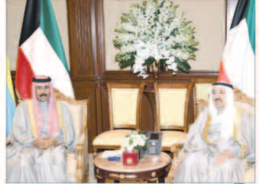
سمو أمير البلاد مستقبلاً سمو ولي العهد

ببرقية تعزية إلى الرئيسة ساهلي زويد رئيسة جمهورية إثيوبيا الفيدرالية الديمقراطية ولدت غيورغيس. ويعد سمو ولي العهد الشيخ نواف الأحمد وسمو الشيخ جابر المبارك رئيس مجلس الوزراء ببرقيتي تعزية مماثلتين.