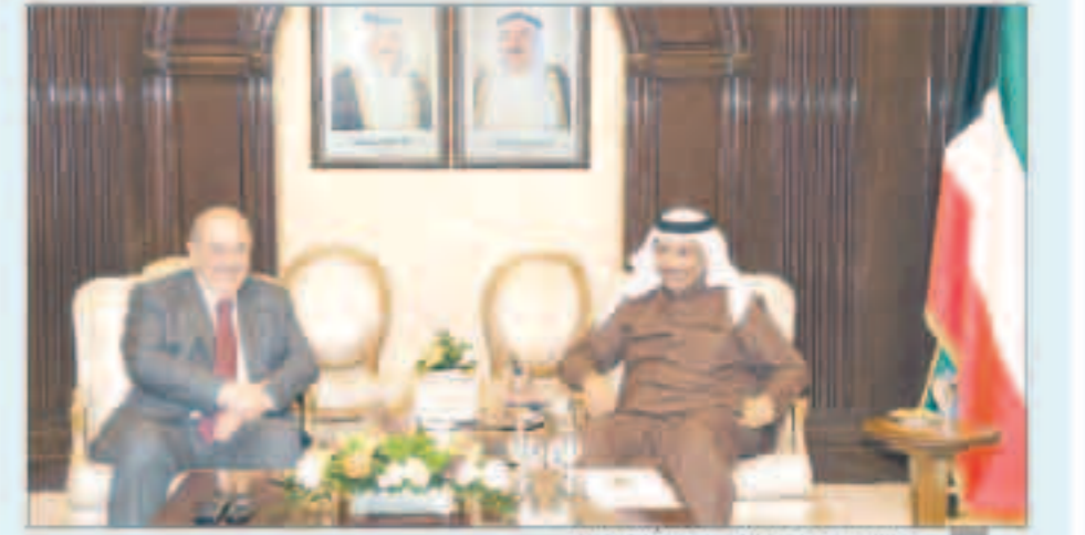
سمو الشيخ جابر المبارك مستقبلاً ايااد علاوي

استقبل سمو الشيخ جابر المبارك رئيس مجلس الوزراء في قصر بيان أمس رئيس ائتلاف الوطنية بجمهورية العراق الشقيق الدكتور ايااد علاوي والخائب حسن العلوي وذلك بمناسبة زيارتهما للبلاد.