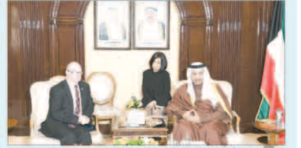
سمو مستقبلاً بيرت

استقبل سمو الشيخ جابر المبارك رئيس مجلس الوزراء في قصر بيان أمس رئيس ائتلاف الوطنية بجمهورية العراق الشقيق الدكتور ايااد علاوي والخائب حسن العلوي وذلك بمناسبة زيارتهما للبلاد.