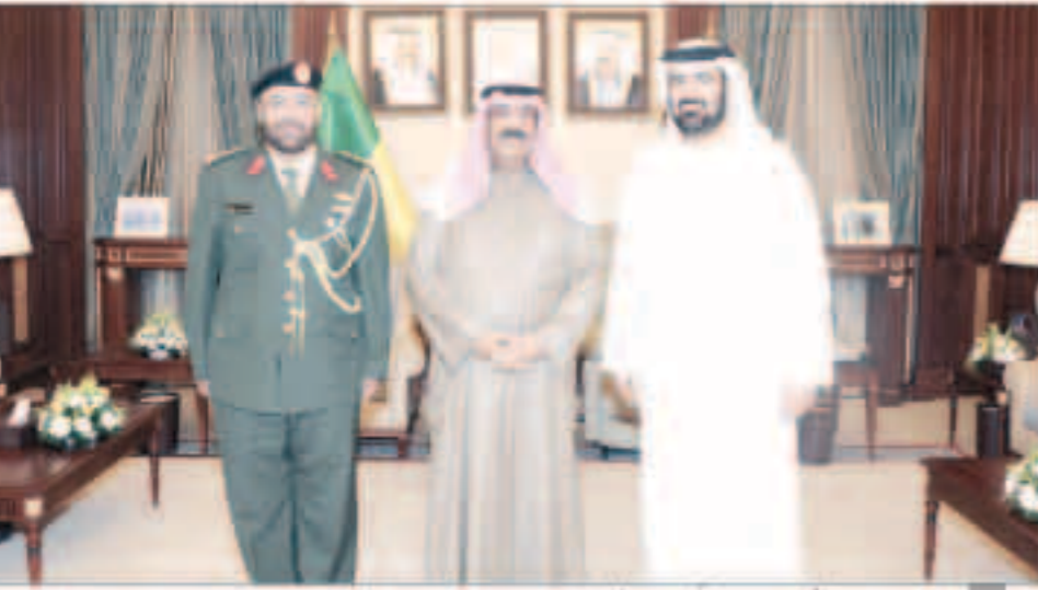
الشيخ مشعل الأحمد مستقبلاً السفير الإماراتي