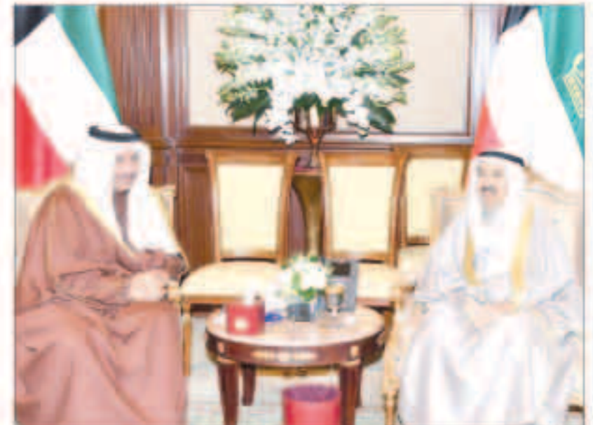
صاحب السمو مستقبلاً سمو رئيس مجلس الوزراء