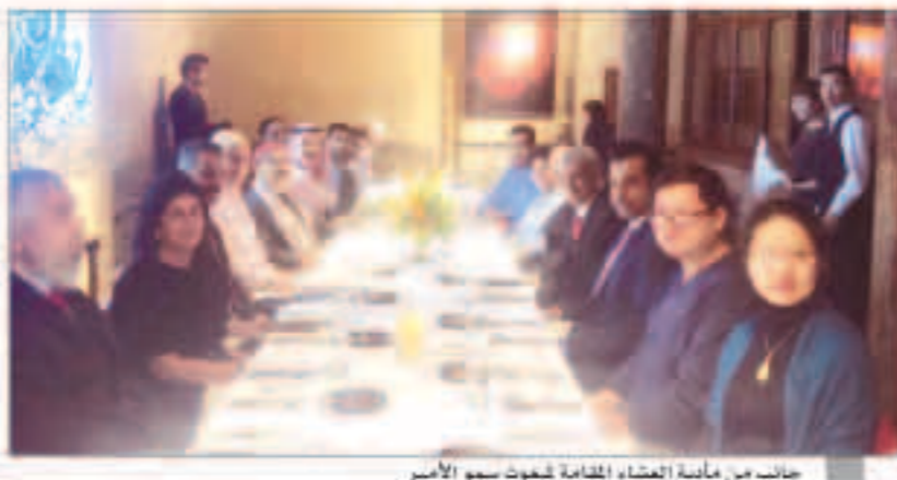
جانب من مأدبة العشاء الخاصة بمبعوث سمو الأمير

التي العاصمة الصينية بكين في زيارة رسمية حيث قال السفير حيايت في بيان "كونا" أن الشيخ ناصر جعل رسالة خلية من سمو أمير البلاد إلى الرئيس الصيني شي جين بينغ تتعلق بتعميق التعاون الثنائي وتعزيز الشراكة الإستراتيجية بين الكويت والصين. وكان الشيخ ناصر الصباح وصل أمس الأول