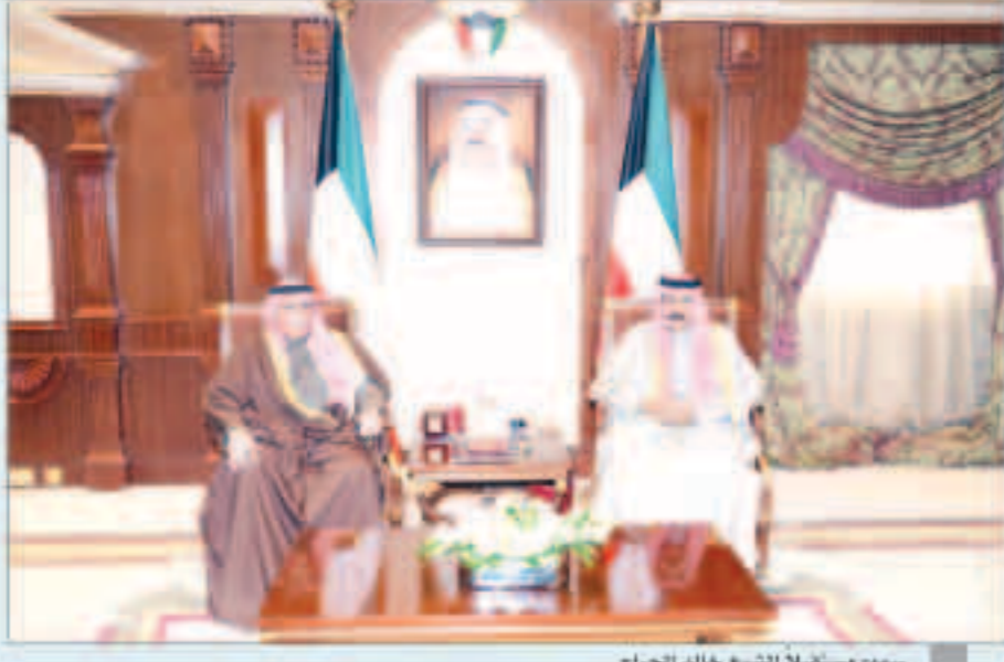
سمو مستقبلاً الشيخ خالد الجراح

استقبل سمو ولي العهد الشيخ نواف الأحمد بقرص بيان صباح أمس رئيس مجلس الأمة مرزوق الغانم. كما استقبل سمو ولي العهد الشيخ جابر المبارك رئيس مجلس الوزراء. واستقبل سمو ولي العهد الشيخ جابر المبارك رئيس مجلس الوزراء. كما استقبل سمو ولي العهد الشيخ أحمد النواف.