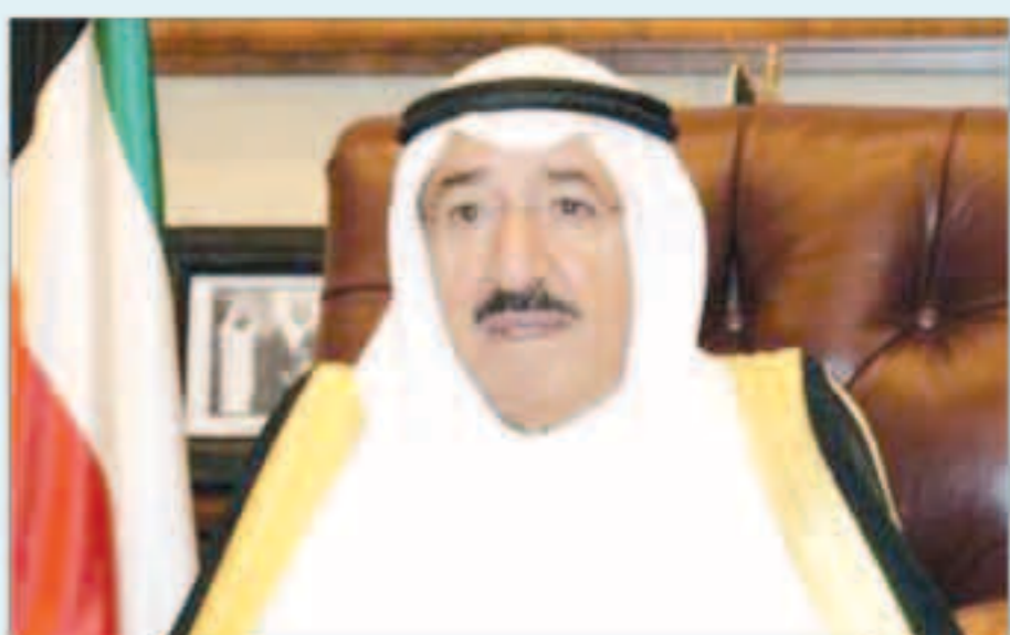
سمو أمير البلاد

بعث سمو أمير البلاد الشيخ صباح الأحمد ببرقية تعزية إلى الرئيس محمد عبدالله محمد فرساجو رئيس جمهورية الصومال الفدرالية الشقيقة عبر فيها سموه عن خالص تعازيه وصداق مواساته بضحايا الهجوم الانتحاري الذي استهدف مكتباً حكومياً في العاصمة مقديشو وأسفر عن سقوط عدد من الضحايا والمصابين الانتحاري الذي استهدف مكتباً حكومياً في العاصمة مقديشو وأسفر عن سقوط عدد من الضحايا والمصابين وانتحاري الذي استهدف مكتباً حكومياً في العاصمة مقديشو وأسفر عن سقوط عدد من الضحايا والمصابين