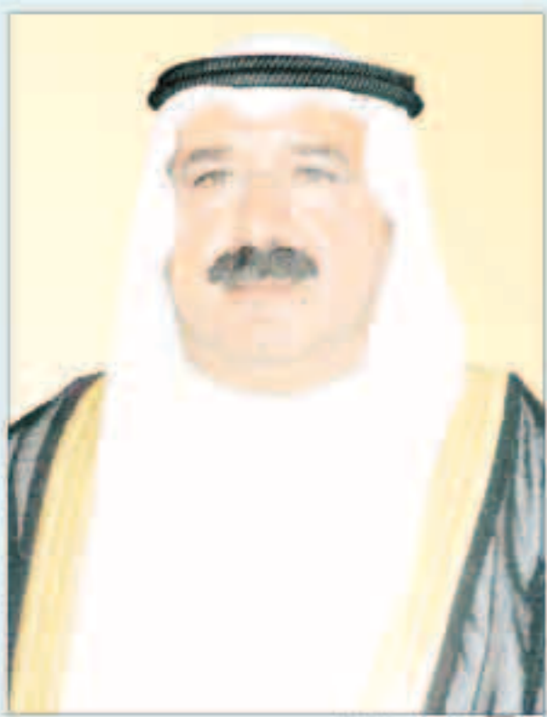
الشيخ ناصر الصباح

ظل القيادة الحكيمة لسمو أمير البلاد القائد الأعلى للقوات المسلحة وسمو ولي عهد الأمين وسمو رئيس مجلس الوزراء.