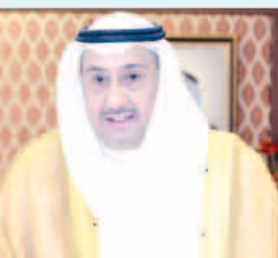
الشيخ فيصل الحمود

دعمه الكامل لجميع المبادرات المجتمعية الوطنية التي تهدف إلى التوعية الصحية وتعزيز أفضل للمواطنين، مبدياً