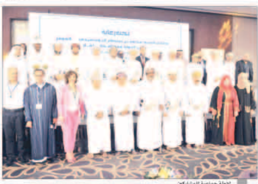
لجنة جماعة للمشاركين

شاركت جمعية الصحفيين الكويتية في «ملتقى الإعلام العربي» الذي تنظمته جمعية الصحفيين العمانية بالتعاون مع لجنة التدريب والاتحاد العام للصحفيين العرب في محافظة ظفار بمدينة صلالة بسلطنة عمان. وافتتح الملتقى السيد محمد بن سلطان البوسعيدي وزير الدولة ومحافظة ظفار وبحضور الشيخ خالد بن عمر المرهون وزير الخدمة المدنية وسعادة علي بن خلفان الجابري وكيل وزارة الإعلام وعدد من المسؤولين والإعلاميين العرب المشاركين. وبدأ الافتتاح في عرض صور وثائقية لإعصار «مكوتو» الذي أصاب مدينة صلالة خلال الفترة الماضية ومدى التحديات التي واجهتها السلطات العمانية الشقيقة وكيف تعاملت مع هذا النوع من الكوارث للوصول إلى أدنى نسبة أضرار من هذه الكارثة. وانتقل راعي الملتقى والحضور لمقاعة الافتتاح وتم إلقاء الكلمات ممثلة في