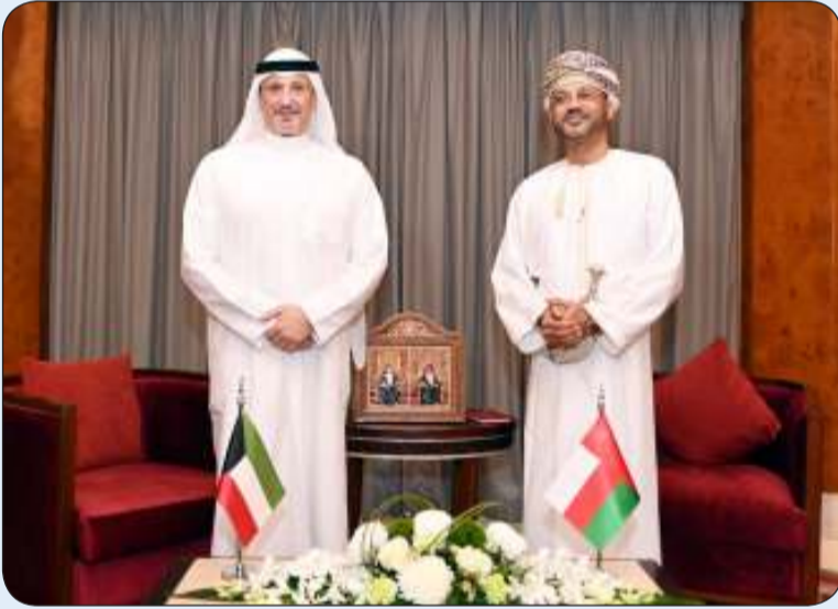
وزير الخارجية ملتقيا نظيره العماني

التقى وزير الخارجية الشيخ سالم الصباح ووزير خارجية سلطنة عمان الشقيقة بدر بن حمد البوسعيدي وذلك على هامش أعمال الاجتماع الوزاري المشترك بين دول مجلس التعاون لدول الخليج العربية والاتحاد الأوروبي في دورته الـ 27. حيث تم خلال اللقاء استعراض المواضيع والقضايا المطروحة في الاجتماع الوزاري الخليجي