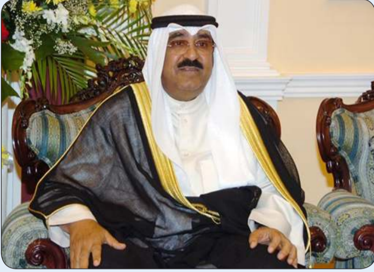
سمو ولي العهد

استقبل سمو ولي العهد الشيخ مشعل الأحمد بقصر بيان صباح أمس سمو الشيخ ناصر المحمد.