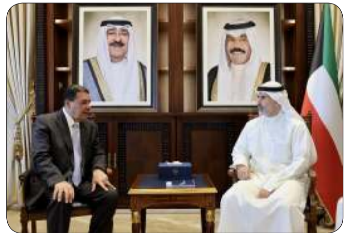
مستقبلا السفير المكسيكي بمناسبة انتهاء فترة عمله