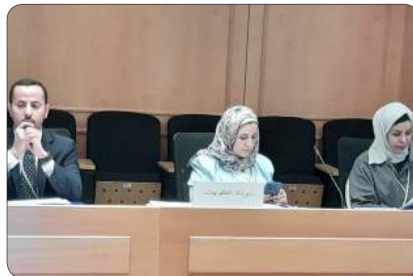
الوفد الكويتي المشارك في الدورة الـ 11 للجنة المرأة

وذكرت أن دولة الكويت اهتمت بوضع خطط وبرامج لتمكين المرأة وضمان حصولها على جميع حقوقها المدنية والسياسية والاقتصادية بما من