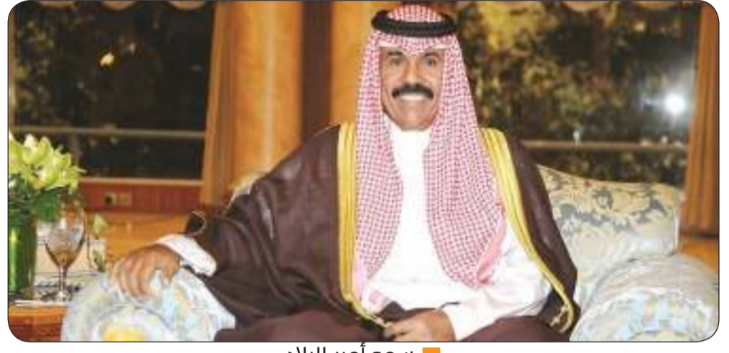
سمو أمير البلاد

بعث سمو أمير البلاد الشيخ نواف الأحمد ببرقية تهنئة إلى الرئيس راتو ويليامي كاتونيفير رئيس جمهورية فيجي الصديقة عبر فيها سموه عن خالص تهنئه بمناسبة العيد الوطني لبلاده. متمنيا سموه له موفور الصحة والعافية ولجمهورية فيجي وشعبها الصديق كل التقدم والازدهار. وبعث سمو ولي العهد الشيخ مشعل الأحمد، وسمو الشيخ أحمد النواف رئيس مجلس الوزراء ببرقيتي تهنئة مماثلتين.