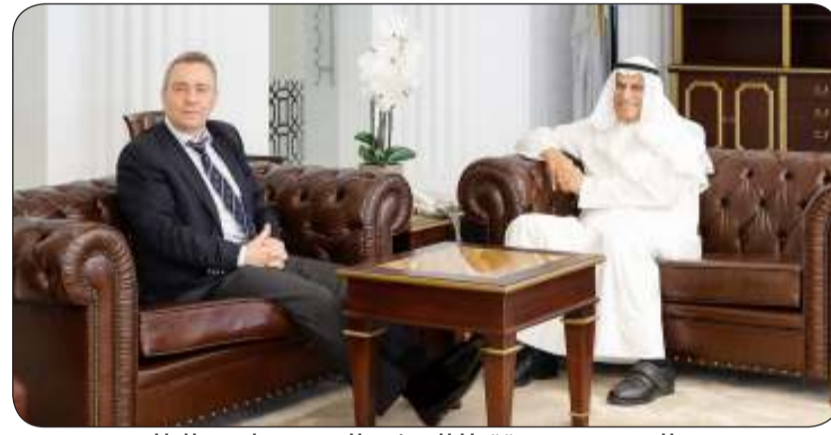
السعدون مستقبلا السفير الروسي لدى البلاد

استقبل رئيس مجلس الأمة أحمد السعدون في مكتبه أمس الثلاثاء سفير جمهورية روسيا الاتحادية لدى دولة الكويت فلاديمير جيلتوف.