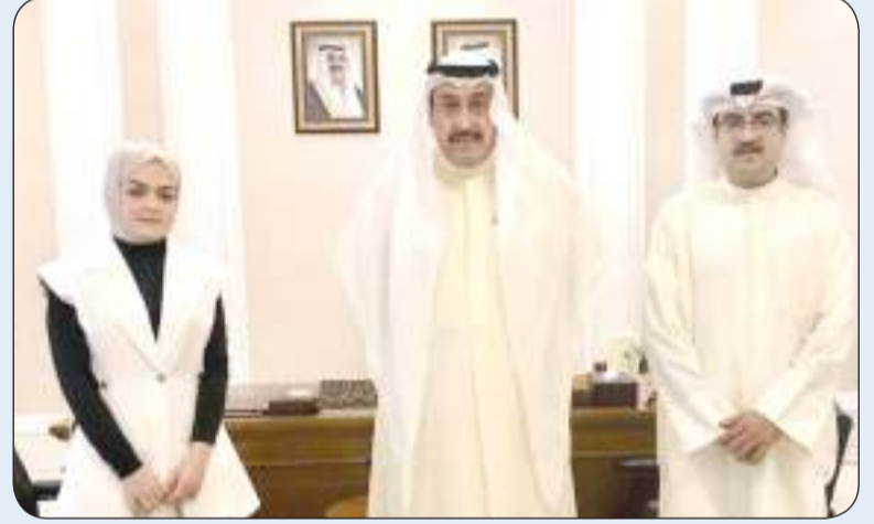
الحمود مستقبلا الدكتورة دانه الديولي

أكد المستشار في الديوان الأميري الشيخ فيصل الحمود أن الكويت مليئة بالشباب الطموح المفعم بالطاقة المتجددة في شتى مجالات العمل والكوادر الطبية المتميزة والمبدعين والمخترعين، مشيراً إلى ضرورة الاهتمام بهم ودعمهم بجمع فئاتهم العمرية حيث أنهم ثروة اجتماعية وعلمية وفكرية وثقافية.