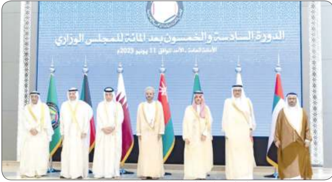
لقطة جماعية لوزراء خارجية دول مجلس التعاون

ترأس وزير الخارجية الشيخ سالم الصباح أمس الأحد وفد دولة الكويت المشارك في اجتماع الدورة السادسة والخمسين بعد المائة للمجلس الوزاري لمجلس التعاون لدول الخليج العربية، في مقر الأمانة العامة لمجلس التعاون بالرياض.