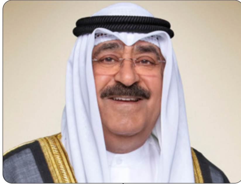
سمو أمير البلاد

الإنجاز المشرف يبين قدرة النظام الصحي على مواكبة أحدث ما يتوصل إليه المجال الطبي