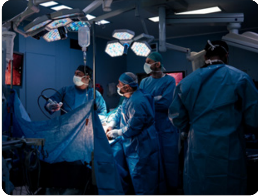
الفريق الطبي داخل مركز صباح الاحمد للكلى أثناء الجراحة

يؤكد التزام المنظومة الصحية بتسخير التكنولوجيا المتقدمة لخدمة الإنسان الكويتي