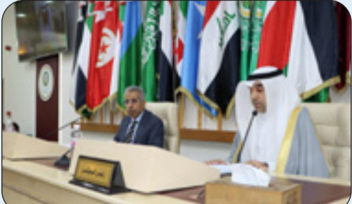
رئيس المؤتمر العقيد عثمان المنصوري ممثل دولة الكويت

تونس - «كونا»: تترأس دولة الكويت المؤتمر العربي الـ 16 لرؤساء أجهزة الإعلام الأمني الذي نظّمته الأمانة العامة لمجلس وزراء الداخلية العرب بتونس بمشاركة رؤساء أجهزة الإعلام الأمني في الدول العربية وإتحاد إذاعات الدول العربية وجامعة نايف العربية للعلوم الأمنية بهدف بحث سبل تعزيز دور الإعلام الأمني في الوعي بالجرم الإلكتروني في العصر الرقمي. وأكد رئيس المؤتمر العقيد عثمان المنصوري ممثل دولة الكويت في كلمة الافتتاح على أهمية العمل العربي المشترك في تعزيز التوعية الأمنية والوقاية من الجريمة مشدداً على أن «التحولات المتسارعة التي يشهدها المشهد الرقمي تفرض علينا تطوير أدوات الإعلام الأمني بما يواكب التحديات الراهنة».