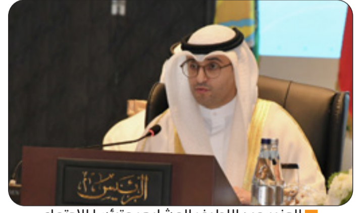
الوزير عبد اللطيف المشاري مترئسا الاجتماع

المباني بدول مجلس التعاون ودليل إجراءات سحب وحجز المركبات المتهمة والتالفة والأليات المعطلة بدول مجلس التعاون ودليل اشتراطات منشآت مكافحة آفات الصحة العامة بدول مجلس التعاون بالإضافة إلى انطلاق أعمال الدورة السادسة لجائزة مجلس التعاون في مجال العمل البلدي لعامي «2025 - 2026».