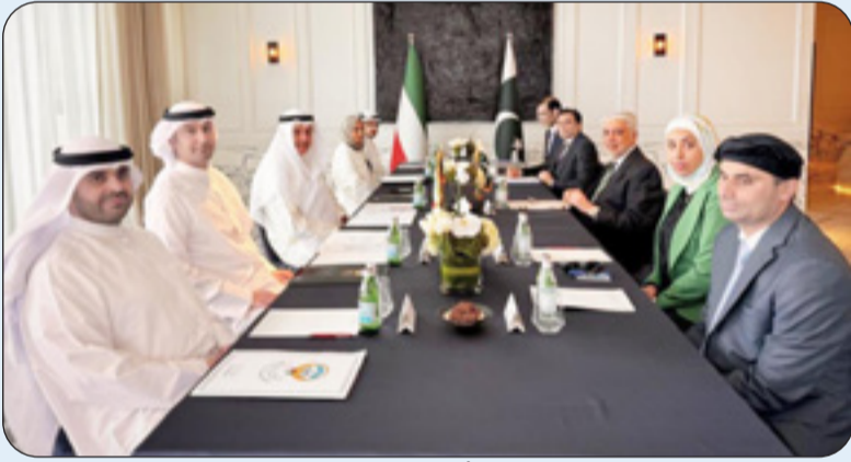
جانب من جولة المشاورات بين الكويت وباكستان

عقدت وزارة الخارجية الكويتية الجولة الرابعة من المشاورات السياسية مع وزارة الخارجية الباكستانية في ديوان عام الوزارة برئاسة مساعد وزير الخارجية لشؤون آسيا السفير سميح حياث ومساعد وزير الخارجية الباكستاني لشؤون الشرق الأوسط السفير شهريار أكبر خان. وأكّد السفير حياث في تصريح لـ «كونا» حرص دولة الكويت على تعزيز آلية المشاورات السياسية المنتظمة بين البلدين مشيداً بعمق العلاقات الثنائية بين الكويت وجمهورية باكستان الإسلامية وما تشهده من تطور مستمر في مختلف المجالات. وأعرب عن تقديره لما تميزت به المشاورات من أجواء إيجابية ومناقشات بناءة وتبادل صريح للآراء حول أبرز القضايا الإقليمية والدولية إلى جانب استعراض القواسم المشتركة في مواقف البلدين تجاه عدد من التحديات الراهنة. ومن جانبه عبر أكبر خان في تصريح مماثل لـ «كونا» عن شكره وتقديره لحفاوة الاستقبال وكرم الضيافة التي حظي بها والوفد المرافق له مؤكداً رغبة