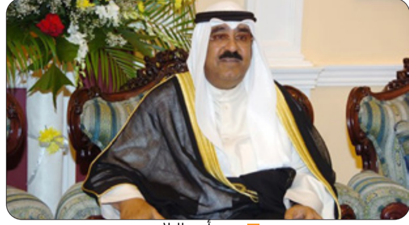
سمو أمير البلاد

الشيخ صباح الخالد، وسمو الشيخ أحمد عبدالله رئيس مجلس الوزراء برفقتي تهنئة مماثلتين. كما بعث صاحب السمو برفقة تهنئة إلى الرئيس سانتياغو بينيا رئيس جمهورية الباراغواي الصديقة عبر فيها سموه عن خالص تهانيه بمناسبة ذكرى الاستقلال لبلاده، متمنياً سموه له موفور الصحة والعافية ولجمهورية الباراغواي وشعبها الصديق كل التقدم والازدهار.