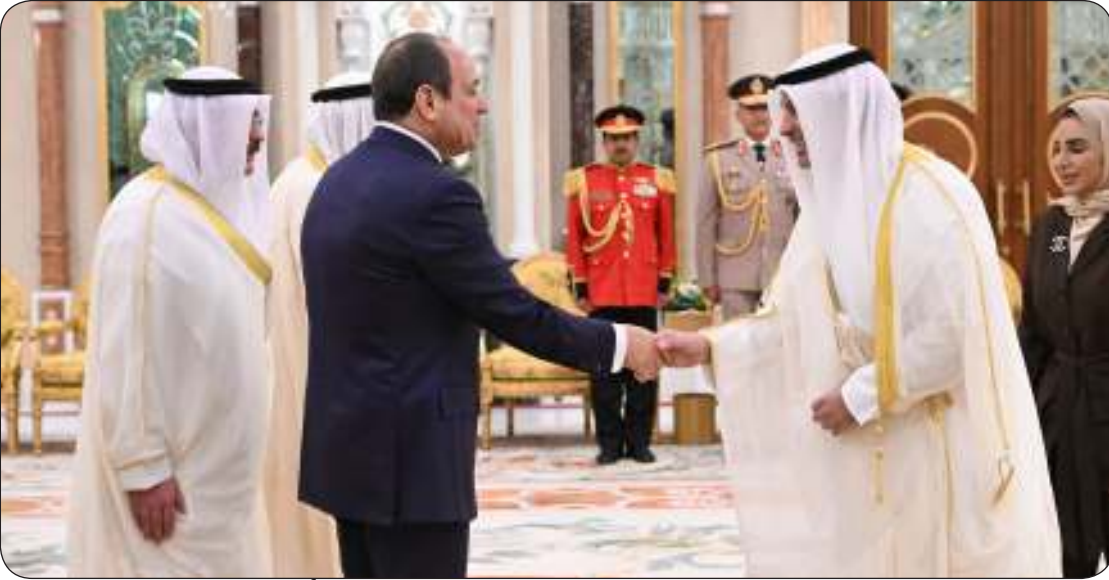
■ الوزراء يصفحون الرئيس المصري خلال المأدبة

سمو الأمير وضيئه بحثا أهم القضايا ذات الاهتمام المشترك وآخر المستجدات الإقليمية والدولية