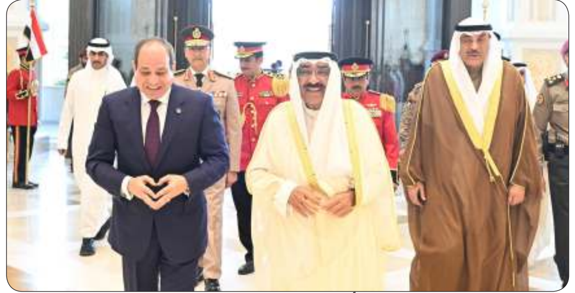
■ سمو أمير البلاد مرحبا بالرئيس المصري

الفلسطيني الشقيق وبذل الجهد والسعي لإعادة إعمار قطاع غزة.