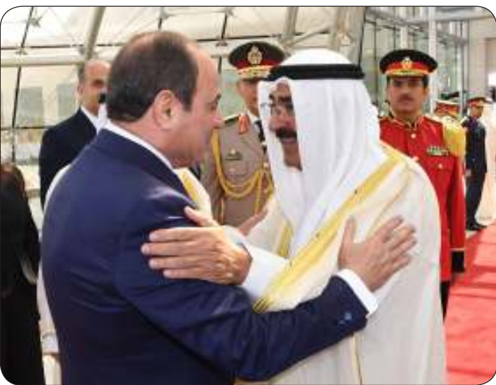
■ سمو أمير البلاد يودع الرئيس السيسي في المطار