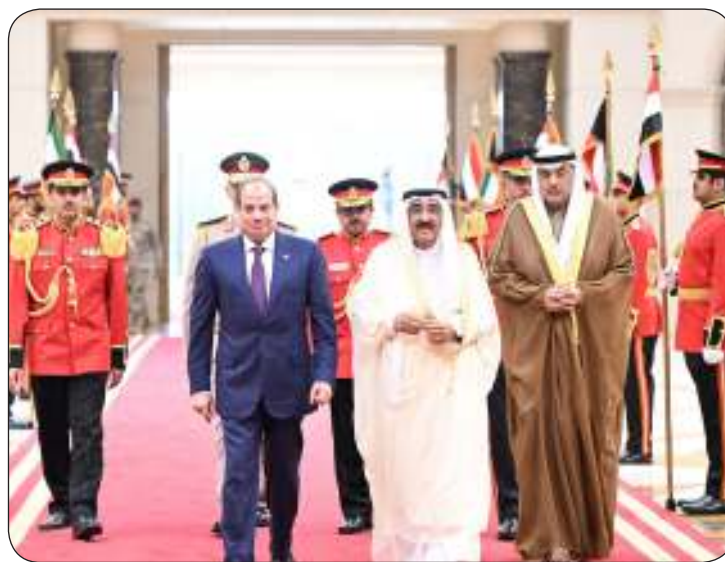
■ الأمير يرافق الرئيس السيسي إلى القاعة الأميرية في المطار في نهاية الزيارة