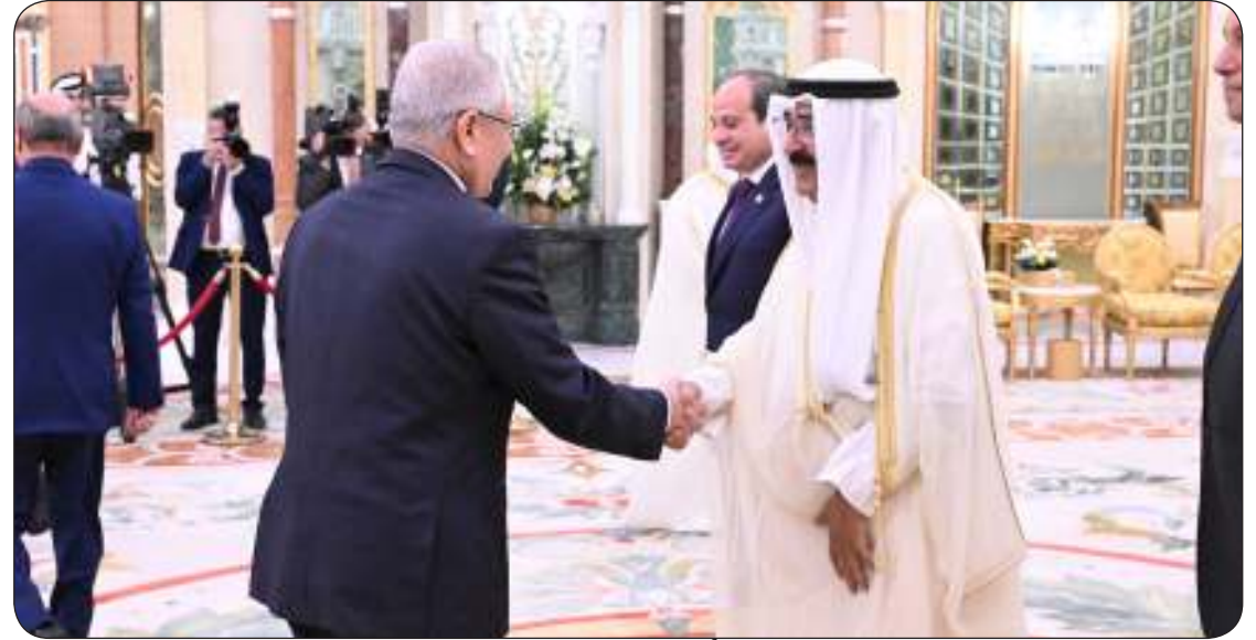
■ سمو الأمير يقيم مأدبة غداء على شرف الرئيس المصري