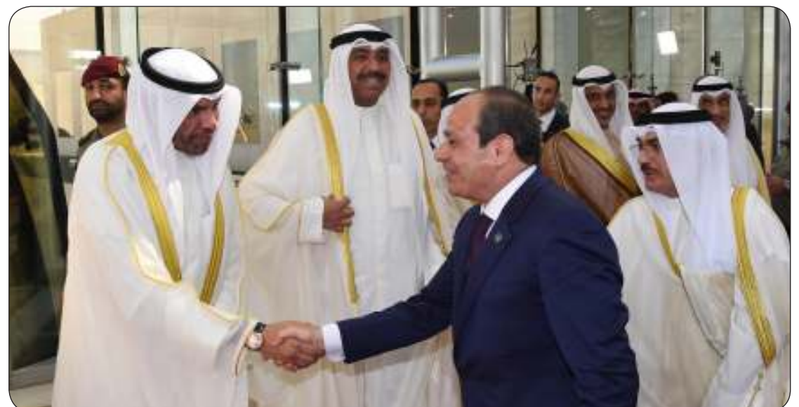
■ كبار المسؤولين بالدولة في وداع الرئيس المصري