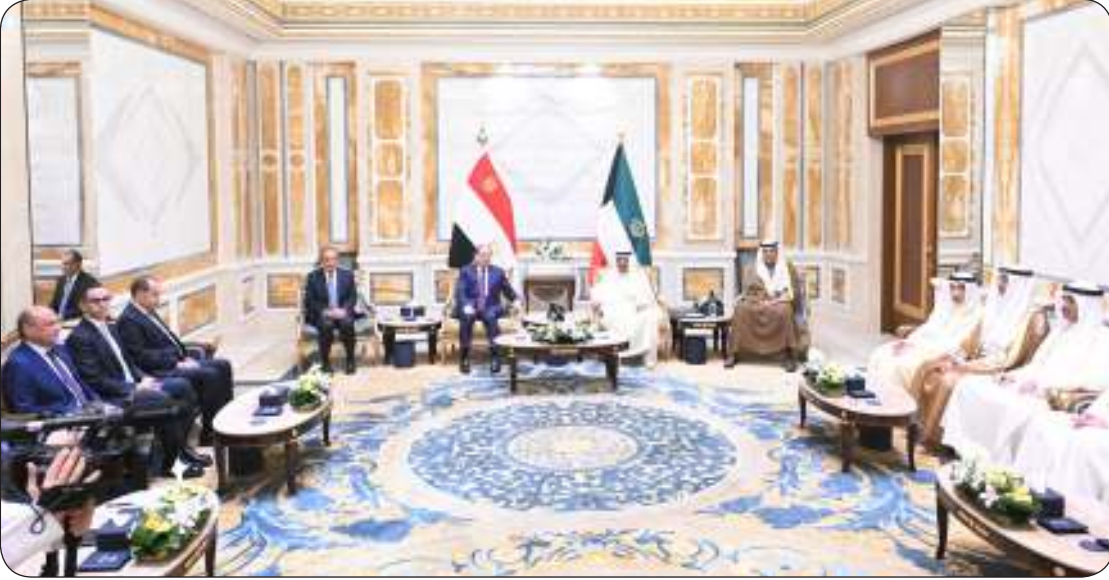
■ جانب من جلسة المباحثات بين الزعيمين

الزعيمان تناولا توطيد العلاقات الأخوية بين البلدين والشعبين الشقيقين وسبل تعزيزها في المجالات كافة