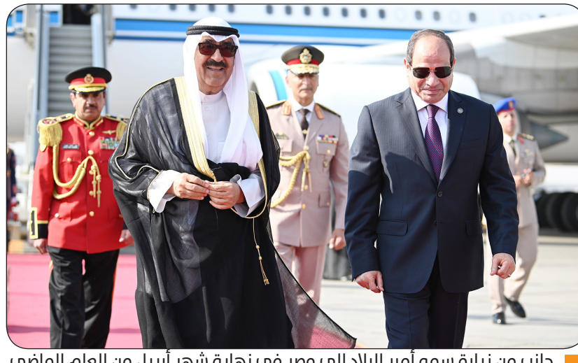
جانب من زيارة سمو أمير البلاد إلى مصر في نهاية شهر أبريل من العام الماضي