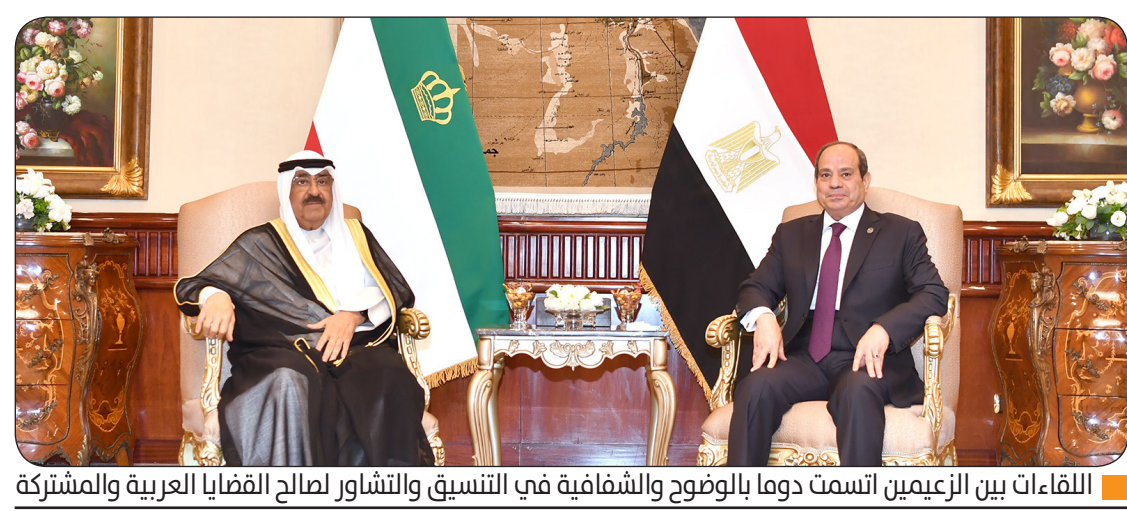
اللقاءات بين الزعيمين اتسمت دوما بالوضوح والشفافية في التنسيق والتشاور لصالح القضايا العربية والمشتركة

ووقعت مصر والكويت 105 اتفاقيات تعاون ومذكرة تفاهم في المجالات السياسية والاقتصادية