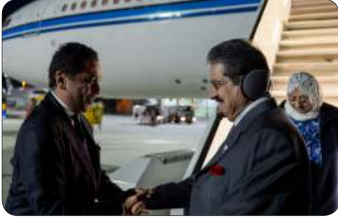
البعثة الدبلوماسية ترحب بسموه