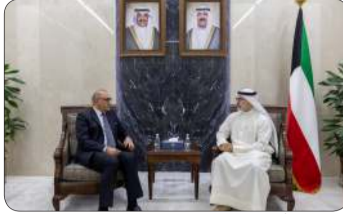
نائب وزير الخارجية مستقبلا السفير العراقي

وزير الخارجية السفير الشيخ جراح الجابر وذلك خلال استقباله سفير جمهورية العراق لدى دولة الكويت المنهل الصافي.