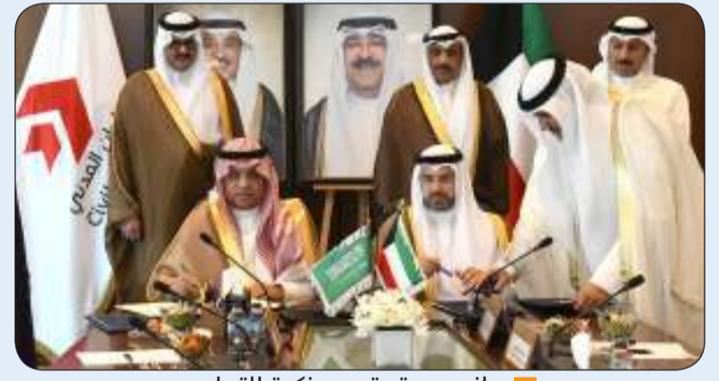
جانب من توقيع مذكرة التعاون

وقعت الإدارة العامة للطيران المدني أمس الأربعاء مذكرة تعاون مع الهيئة العامة للطيران المدني في المملكة العربية السعودية لتعزيز التعاون الفني وتبادل الخبرات في مجال الطيران.