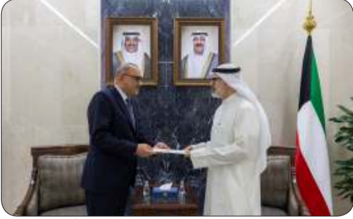
ويتسلم منه الرسالة الموجهة لمصاحب السمو من الرئيس العراقي