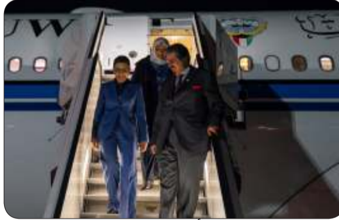
ممثل الأمير يصل ألمانيا للمشاركة في الاحتفال