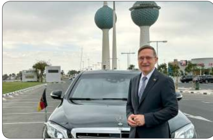
السفير الألماني إلى جانب سيارته المرسيدس أمام أبراج الكويت

خمسون عاماً من الثقة، والاستقرار، والنجاح المشترك. وأضاف: تُرحب مدينة شتوتغارت، عاصمة مرسيدس في جمهورية ألمانيا الاتحادية، بسمو رئيس مجلس الوزراء الشيخ أحمد عبد الله والوفد الرفيع المرافق له، بمناسبة الاحتفال بهذه الشراكة الاقتصادية المتميزة. وتابع: ساستمر في قيادة سيارة كويتية-ألمانية، رمزاً لهذا التعاون المثمن.