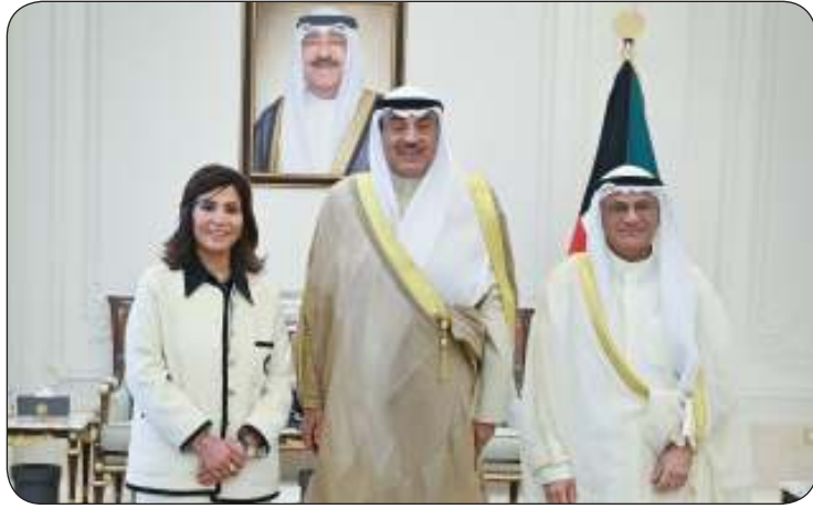
سمو ولي العهد مستقبلا الجلال والميليم