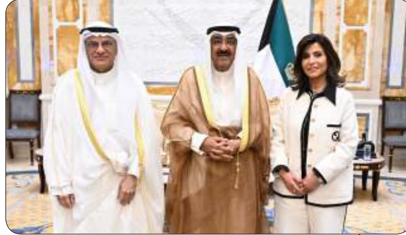
سمو أمير البلاد مستقبلا وزير التعليم العالي والمديرة الجديدة لجامعة الكويت

استقبل سمو أمير البلاد الشيخ مشعل الأحمد بقصر بيان ظهر أمس وزير التعليم العالي والبحث العلمي الدكتور نادر الجلال حيث قدم لسموه مديرة جامعة الكويت الدكتورة دينا مساعد الملم وذلك بمناسبة تعيينها بمنصبها الجديد. كما استقبل سمو ولي العهد الشيخ صباح خالد بقصر بيان ظهر أمس وزير التعليم العالي والبحث العلمي الدكتور نادر الجلال حيث قدم لسموه مديرة جامعة الكويت الدكتورة دينا مساعد الملم وذلك بمناسبة تعيينها بمنصبها الجديد.