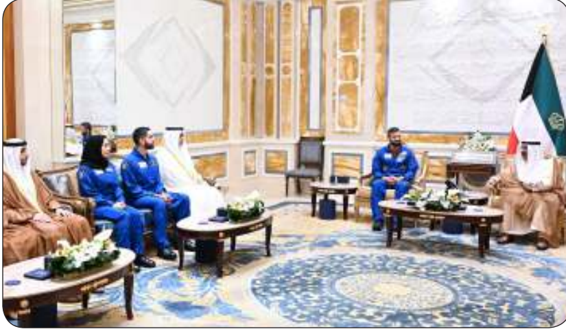
صاحب السمو مستقبلا وزير الشباب الإماراتي ورائدي الفضاء المطروشي والملا

الدولة لشؤون الشباب عبدالرحمن المطيري وكبار المسؤولين بالدولة. كما استقبل سمو ولي العهد وزير الدولة لشؤون الشباب بدولة الإمارات العربية المتحدة الشقيقة الدكتور سلطان بن سيف النيسادي ورائدي الفضاء نورة عيسى المطروشي ومحمد عبدالرحيم الملا وذلك بمناسبة زيارتهم للبلاد. حضر المقابلة وزير الإعلام والثقافة ووزير الدولة لشؤون الشباب عبدالرحمن المطيري ومدير مكتب سمو ولي العهد الفريق متقاعد جمال محمد الذياب.