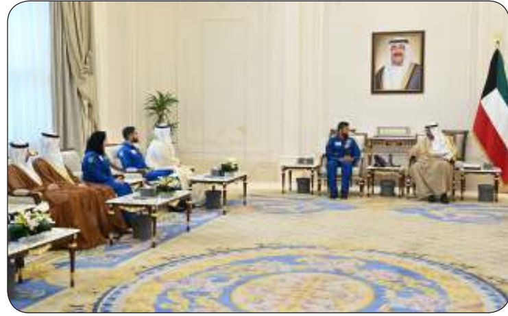
وسموه مستقبلا وزير الشباب الإماراتي ورائدي الفضاء المطروشي والملا