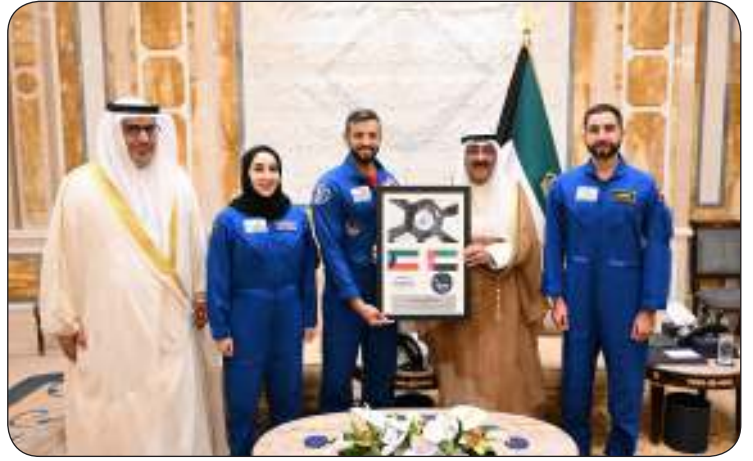
ويتلقى منهم هدية تذكارية

أعرب عن تشرفه بتمثيل صاحب السمو في الاحتفال بمرور 50 عاما على الشراكة مع "مرسيدس" الخميس المقبل