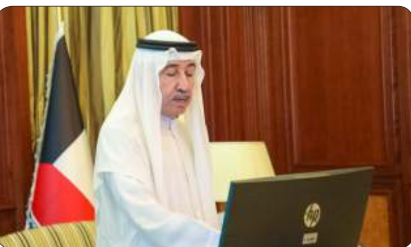
الشيخ مبارك الحمود ي دشّن الخطة الإستراتيجية للحرس الوطني

رجال الحرس الوطني من القيام بواجبهم في منظومة الدفاع والأمن وتقديم الدعم والإسناد لكافة جهات الدولة وفق رؤية احترافية وجاهزية عالية. وأعرب عن خالص الشكر لفريق إعداد الخطة الاستراتيجية للحرس الوطني على جهودهم في إخراج هذه الخطة إلى النور داعيا قادة وضباط الحرس الوطني إلى التقيد بها والالتزام بأهدافها خاصة المتعلقة بالتطور التكنولوجي وتبني التكنولوجيا الحديثة