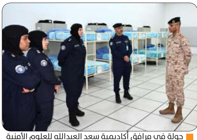
جولة في مرافق أكاديمية سعد العبدالله للعلوم الأمنية