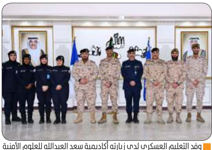
وفد التعليم العسكري لدى زيارته أكاديمية سعد العبدالله للعلوم الأمنية

قالت رئاسة الأركان العامة للجيش الكويتي أمس الأربعاء إن وفدا من هيئة التعليم العسكري التابع لها قام بزيارة إلى أكاديمية "سعد العبدالله" للعلوم الأمنية بوزارة الداخلية لبحث سبل تعزيز التعاون في مجال انخراط المرأة في السلك العسكري. جاء ذلك في بيان صحفي صادر عن رئاسة "الأركان" عقب زيارة رئيس هيئة التعليم العسكري العميد ركن جاسم العمانى والوفد المرافق له إلى إدارة معهد الشرطة