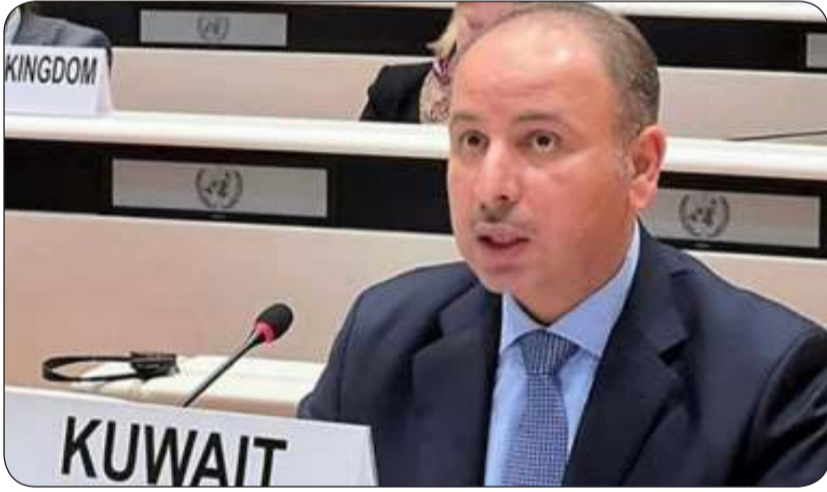
السفير ناصر الهين

السامية لحقوق الإنسان وبسبب الأهمية للجهود اللازمة في إطار ولايتها بهذا المجال. وقال إن المساعدة التقنية وبناء القدرات في مجال حقوق الإنسان يمكنهما أن يضطلعوا بدور أساسي في دعم جهود بناء السلام ومنع النزاعات لاسيما من خلال تهيئة الظروف المؤاتية لنجاح جهود الحوار والوساطة عند اقتضاء الحاجة في هذا المجال. وأعرب عن استعداد دول مجلس التعاون الخليجي لمواصلة التعاون البناء مع جميع الشركاء من أجل تعزيز الأثر العملي لبرامج التعاون التقني وتطوير آلياتها بشكل يساهم في تحقيق نتائج ملموسة ومستدامة على الأرض.