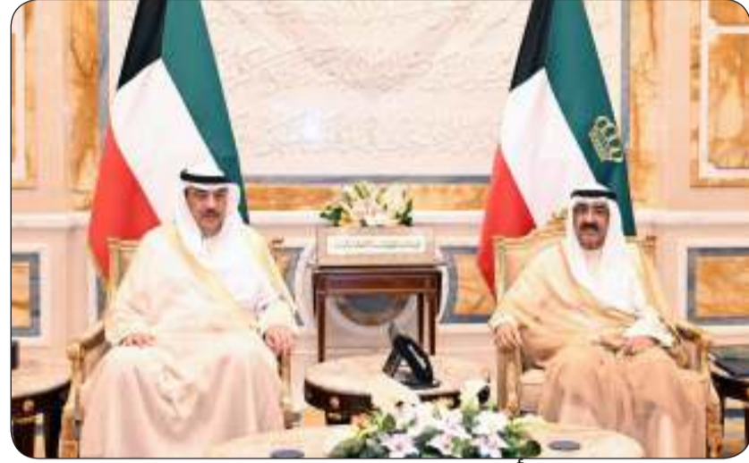
سمو أمير البلاد مستقبلا سمو ولي العهد

استقبل سمو أمير البلاد الشيخ مشعل الأحمد بقرص بيان صباح أمس سمو ولي العهد الشيخ صباح الخالد. كما استقبل سموه رئيس مجلس الوزراء بالإنابة الشيخ فهد اليوسف. من جانب آخر، تلقى صاحب السمو اتصالا هاتفيا صباح أمس من الرئيس الدكتور مسعود بزشكيان رئيس الجمهورية الإسلامية الإيرانية الصديقة عبر خلاله عن خالص تهانيه وأطيب تمنياته بمناسبة عيد الفطر السعيد سائلا المولى عز وجل أن يعيد هذه المناسبة السعيدة على البلدين وعلى الأمة الإسلامية بواقف الخير واليمن والبركات وأن يديم على سموه موفور الصحة والعافية ولدولة