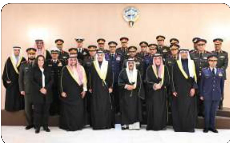
صورة جماعية يتوسطها صاحب السمو وسمو ولي العهد