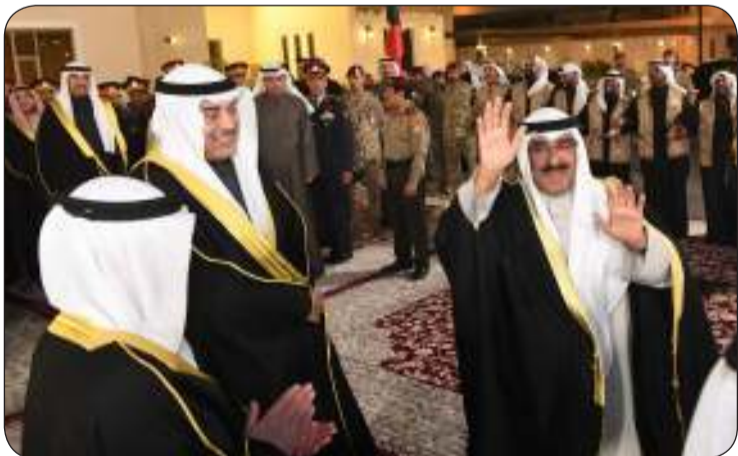
صاحب السمو محيا الحضور

في هذه الليلة المباركة من ليلاني شهر رمضان الفضيل، يسعدنا وأخي سمو ولي العهد الشيخ صباح خالد الحمد الصباح ورئيس مجلس الوزراء بالإنيابة الشيخ فهد يوسف سعود الصباح والإخوة المرافقون أن تلقوا بمنسبي وزارة الدفاع؛ لنهنتهم بهذا الشهر الكريم، داعين العلي القدير أن يتقبل من الجميع الصيام والقيام وصالح الأعمال، وأن يعيده على كوينا الغالية وشعبها الوفي والمقيمين على أرضها الطيبة وأمتينا الإسلامية والعربية باليمن