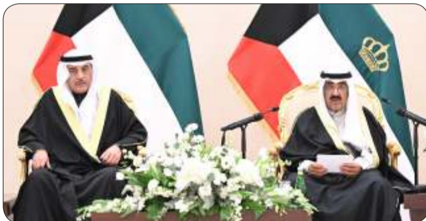
سمو الأمير يلقي كلمته خلال زيارته لوزارة الدفاع

حريصون على تعزيز قدرات قواتنا المسلحة وتمكينها من القيام بواجبها المقدس في حماية الوطن نجدد تعازينا لذوي شهيدنا الواجب اللذين استشهدا أثناء تنفيذ رماية ليلية بالذخيرة الحية نشدد على تطبيق أعلى معايير الأمن والسلامة في التمارين والتدريبات العملية نثمن حرص الوزارة على تعزيز دور العنصر النسائي فيها ودعمه إيماننا منا جميعا بدورها الفعال لا تنمية ولا تطور في غياب الأمن والاستقرار فطمأنينة العيش نعمة كبرى لا يدرك قيمتها إلا من فقدناها تحقيق أقصى درجات اليقظة والاستعداد لقواتنا وتعزيز قدراتها القتالية والتعاون العسكري المشترك حماية الفضاء السيبراني العسكري وسلامة الأنظمة الرقمية وتبادل الخبرات حول أحدث الابتكارات