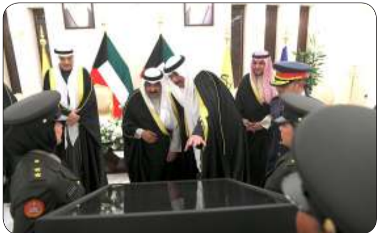
هدية تذكارية لسمو الأمير