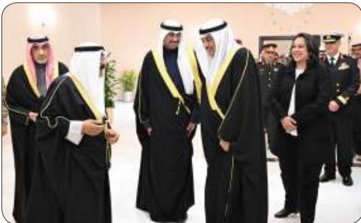
حوار باسم بين صاحب السمو وسمو ولي العهد