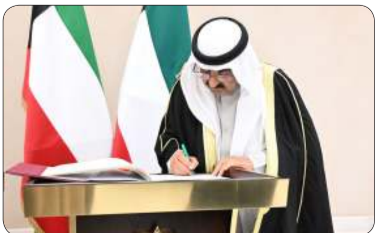
سموه يوقع في سجل الشرف