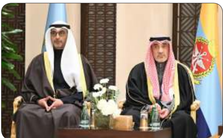
اليوسف والعبدالله خلال الزيارة