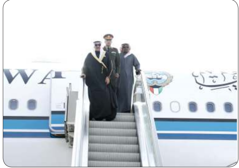
ممثل سمو الأمير لدى وصوله إلى القاهرة