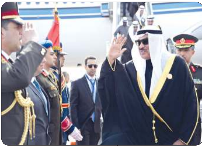
ممثل سمو أمير البلاد محييا مستقبله

حمد بن عيسى: نرفض أي محاولة للتهجير وأشد بالمبادرة المصرية المطروحة أمام القمة ●●●● إننا على ثقة بأن التمسك بمسار السلام الدائم والشامل هو إطار ضامن لينال الشعب الفلسطيني حقوقه