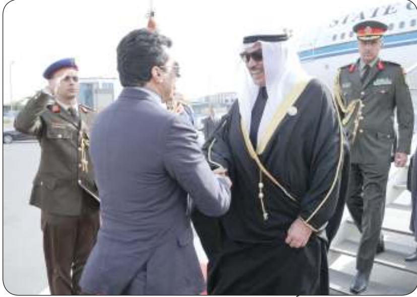
الوزير أشرف صبحي مستقبلا ممثل سمو الأمير