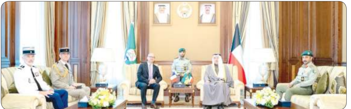
جانب من الاستقبال

استقبل رئيس الحرس الوطني الشيخ مبارك الحمود في ديوانه بالرئاسة العامة للحرس أمس الاثنين سفير الجمهورية الفرنسية الصديقة لدى البلاد أوليفر غوفان حيث قدم السفير التهنئة بحلول شهر رمضان المبارك. وذكر الحرس في بيان صحفي أنه تم خلال اللقاء بحث عدد من الموضوعات ذات الاهتمام المشترك وتقديم رئيس الحرس الوطني بالشكر والتقدير للسفير الفرنسي والوفد المرافق له على الزيارة.