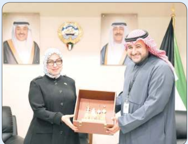
هدية تذكارية للسفيرة التركية

بحث وكيل وزارة الدفاع الشيخ الدكتور عبدالله المشعل مع السفيرة التركية لدى الكويت طوبى نور سونمز العلاقات الثنائية في مجال الدفاع العسكري وسبل تعزيز أواصر التعاون الثنائي بين البلدين الصديقين. وذكرت "الدفاع" في بيان صحفي أمس الاثنين أنه حضر اللقاء الوكيل المساعد للتجهيز