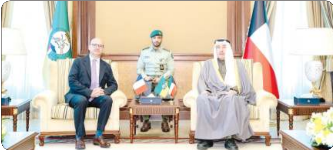
رئيس الحرس الوطني خلال استقباله سفير الجمهورية الفرنسية لدى البلاد

استقبل رئيس الحرس الوطني الشيخ مبارك الحمود في ديوانه بالرئاسة العامة للحرس أمس الاثنين سفير الجمهورية الفرنسية الصديقة لدى البلاد أوليفر غوفان حيث قدم السفير التهنئة بحلول شهر رمضان المبارك. وذكر الحرس في بيان صحفي أنه تم خلال اللقاء بحث عدد من الموضوعات ذات الاهتمام المشترك وتقديم رئيس الحرس الوطني بالشكر والتقدير للسفير الفرنسي والوفد المرافق له على الزيارة.