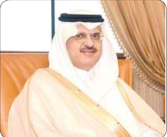
سفير السعودية لدى البلاد

2025 من الساعة 8:30 إلى 11 مساء في مقر السفارة بالمنطقة الدبلوماسية بالديعة.