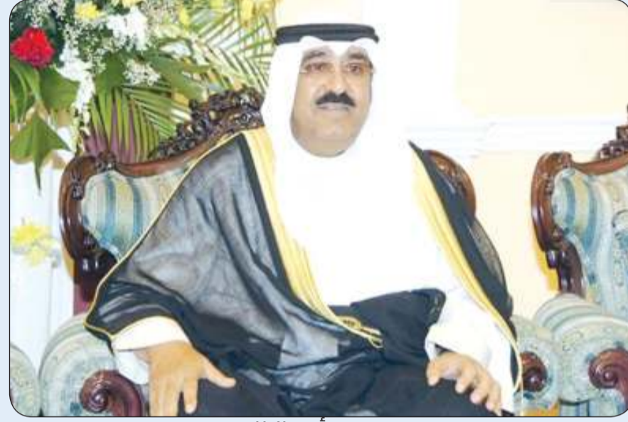
سمو أمير البلاد

استقبل سمو أمير البلاد الشيخ مشعل الأحمد بقصر بيان صباح أمس سمو ولي العهد الشيخ صباح الخالد. كما استقبل سموه بقصر بيان صباح أمس رئيس مجلس الوزراء بالإنابة وزير الداخلية الشيخ فهد اليوسف.