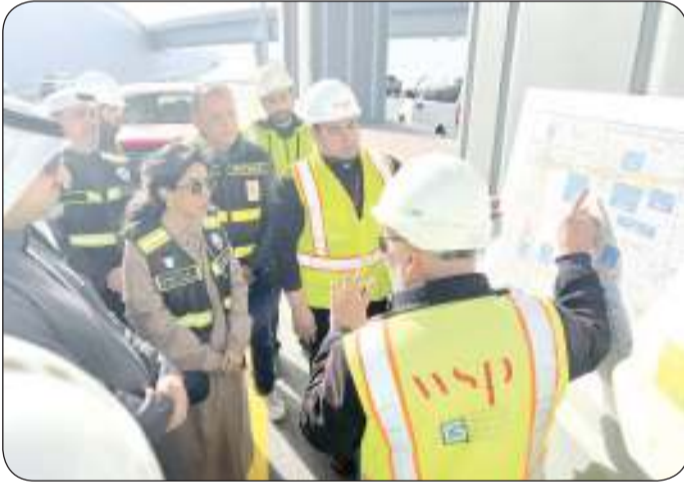
..وتستمع إلى شرح عن النفق المفتوح