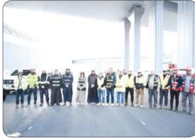
المشعان خلال تفقدها مشروع تطوير الدائري الخامس

وزارة الأشغال تبذل كافة الجهود لتعزيز البنية التحتية وذلك بناء على توجيهات سمو الشيخ أحمد عبدالله الأحمد الصباح رئيس مجلس الوزراء. كما أكدت الوزير المشعان ان الزيارات الميدانية والتقنية للمشاركة هي خطوة مهمة لضمان سلامة تلك المشاريع الحيوية والبنية التحتية في البلاد.