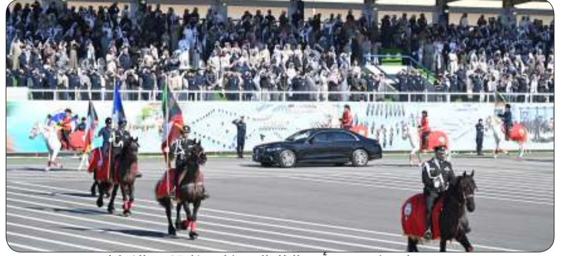
وصول موكب سمو أمير البلاد إلى مكان حفل تخريج الضباط

الطويل في السير بخطى ثابتة نحو تطوير مناهجها التعليمية والتدريبية واضعة نصب عينها تحقيق أرقى مستويات التميز والكفاءة وسعيًا نحو تطبيق نظم الجودة والاعتماد الأكاديمي. وفي إطار التكامل العلمي والبحثي والتدريبي قامت الأكاديمية بتعزيز أطر التعاون مع مؤسسات أكاديمية وأمنية محلية وخارجية من خلال توقيع اتفاقيات تعاون مشترك وعقد شراكات استراتيجية تهدف إلى تبادل الخبرات وتنمية المهارات ورفع كفاءة الكوادر الأمنية.