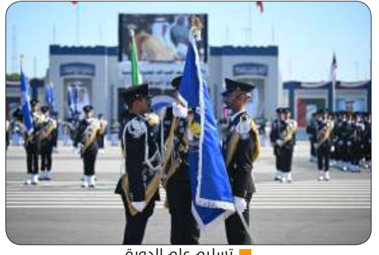
تسليم علم الدورة