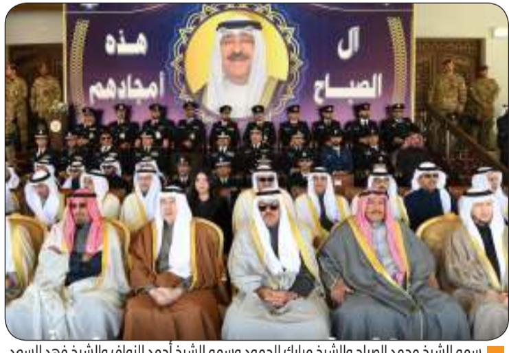
سمو الشيخ محمد الصباح والشيخ مبارك الحمود وسمو الشيخ أحمد النواف والشيخ فهد السعد