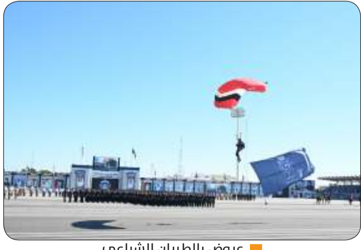
عروض بالطيران الشراعي