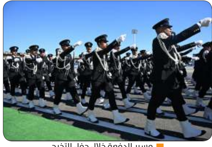
مسير الدفعة خلال حفل التخرج