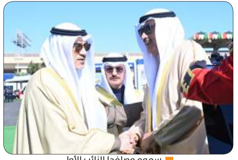
سموه مصافحا النائب الأول