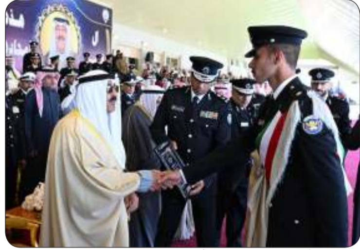
قائد طابور العرض يتشرف بالسلام على صاحب السمو