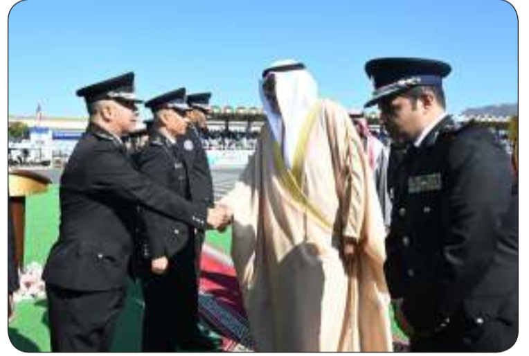
قيادات وزارة الداخلية يصفحون سمو ولي العهد