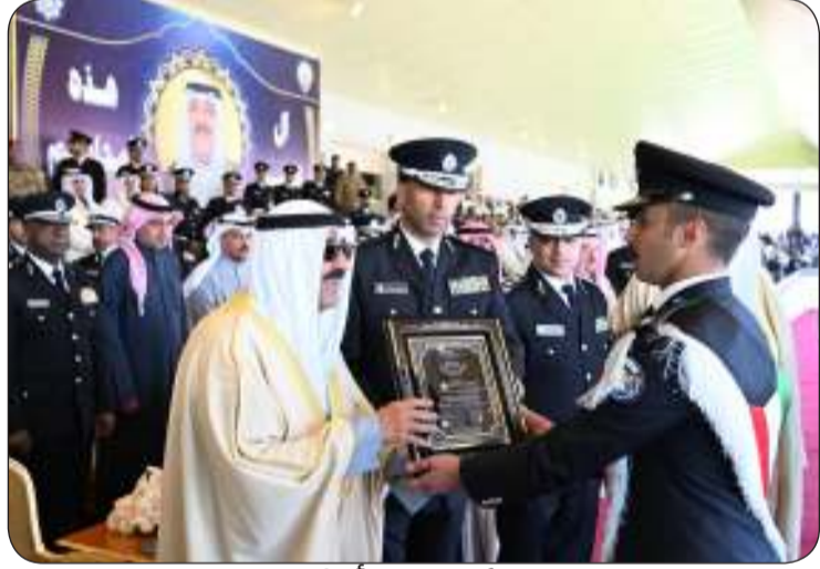
سمو الأمير يكرم أوائل الدفعة

اليوم هو نتاج رحلة طويلة من العمل الجاد ولمثابرة امتدت لأربع سنوات دراسية الخريجون تلقوا العلوم الأمنية التي تؤهلهم ليكونوا درع الوطن وصمام أمنه واستقراره أكاديمية سعد العبدالله حققت أرقى مستويات التميز والكفاءة والجودة