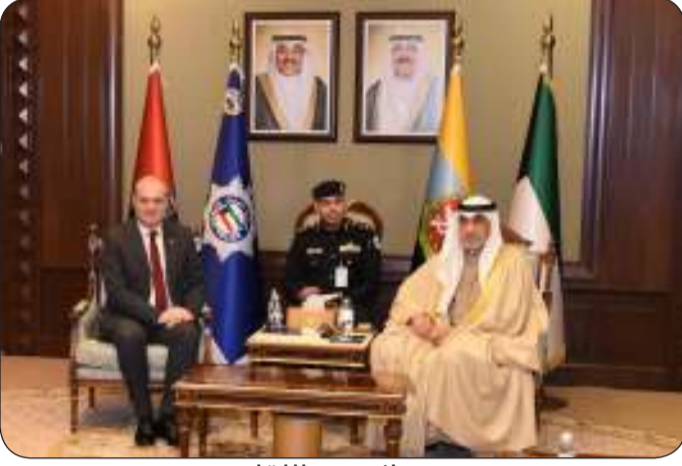
■ جانب من اللقاء