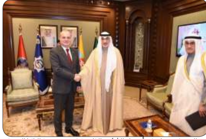
■ اليوسف مرجيا بوزير أوروبا والشؤون الخارجية في جمهورية البانيا الصديقه

وأعرب عن شكره لرئيس مجلس الوزراء بالإناة ووزير الداخلية على حسن الاستقبال وكرم الضيافة. وحضر اللقاء مساعد وزير الخارجية لشؤون أوروبا السفير صادق معرفي.