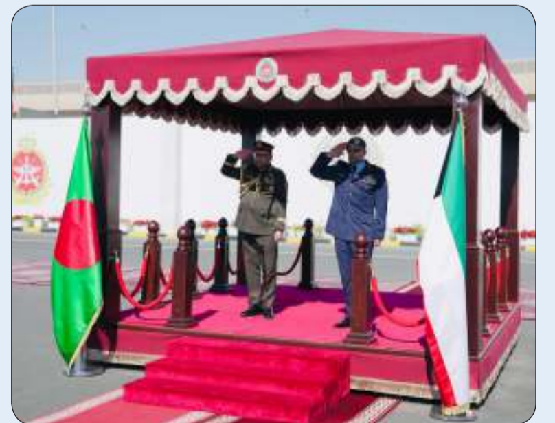
■ نائب رئيس الأركان مستقبلا رئيس الأركان البنغلاديشي