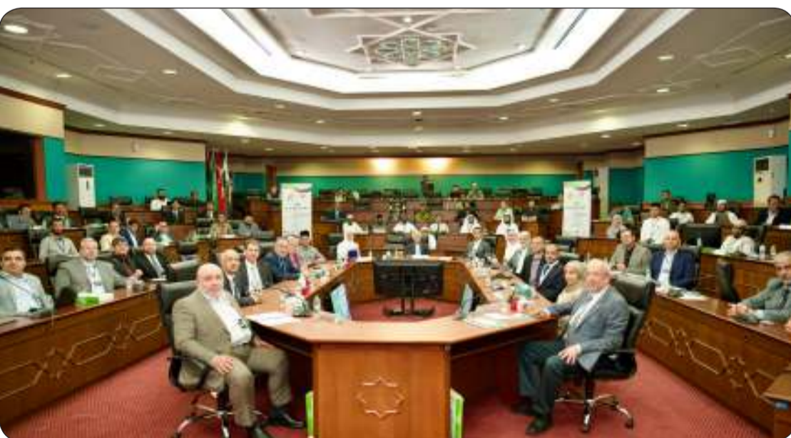
■ صورة جماعية للباحثين والمشاركين والحضور في ندوة الأوقاف الرقمية

وبين أهمية توسيع آفاق العمل الوقفي ليشمل الأصول الرقمية وتحفيز الأفراد والمؤسسات على تحويل جزء من ممتلكاتهم الرقمية إلى "أوقاف مستدامة تعبر الحدود الجغرافية وتصل بفوائدها إلى شرائح واسعة من المجتمعات حول العالم". ولفت إلى أن هذه المبادرة تتماشى مع رؤية الكويت في دعم التنمية المستدامة مشيرا إلى دورها في تعزيز الوقف كأداة مؤثرة في تحقيق التكافل الاجتماعي وتسهم في خلق مستقبل أكثر استدامة وعدالة رقمية للجميع. وأشاد الصالح بالجهود المبذولة من قبل الأمانة العامة للأوقاف والتعاون المثمر مع الهيئة الخيرية الإسلامية العالمية الكويتية لمثل هذه المبادرات التي تخدم العمل الوقفي.