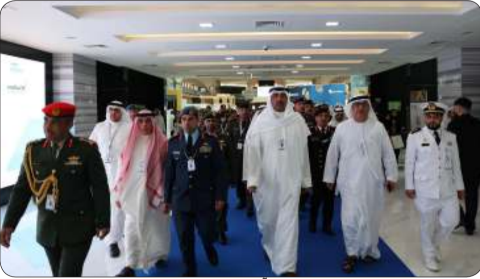
■ وزير الدفاع زار معرضي أيدكس و نافدكس 2025 في الإمارات

عاد وزير الدفاع الشيخ عبدالله علي عبدالله الصباح إلى أرض الوطن بعد حضوره افتتاح معرض الدفاع الدولي "أيدكس" ومعرض الدفاع البحري "نافدكس" لعام 2025 في العاصمة الإماراتية أبوظبي. وذكرت وزارة الدفاع في بيان صحفي أن الوزير الشيخ عبدالله العلي التقى خلال زيارته ولي عهد إمارة دبي نائب رئيس مجلس الوزراء وزير الدفاع الإماراتي الشيخ حمدان بن محمد بن راشد آل مكتوم. يذكر أن وزير الدفاع كان قد توجه أمس الأول إلى تونس للمشاركة في الدورة الـ 42 لمجلس وزراء الداخلية العرب وذلك نيابة عن رئيس مجلس الوزراء بالإناة ووزير الداخلية الشيخ فهد اليوسف.