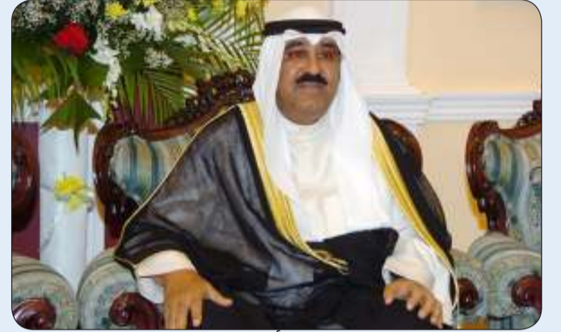
■ سمو أمير البلاد

يتفضل سمو أمير البلاد الشيخ مشعل الأحمد القائد الأعلى للقوات المسلحة فيشمل برعايته وحضوره حفل تخرج الدفعة السابعة والأربعين من الطلبة الضباط بكلية الشرطة وذلك في تمام الساعة العاشرة من صباح اليوم الأربعاء 20 شعبان 1446 هـ الموافق 19 فبراير 2025 ميلادية بميدان أكاديمية سعد العبدالله للعلوم الأمنية. من جانب آخر، بعث صاحب السمو