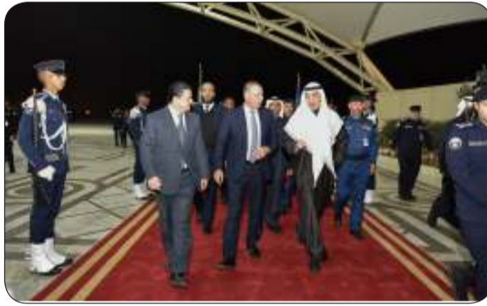
النائب الأول مستقبلا وزير الداخلية الأردني

العميد فواز الرومي إذ قام خلال جولته بالتعرف على آلية عمل إدارة "الجنسية" ووثائق السفر" واستمع إلى شرح عن مراحل تطور جواز السفر الكويتي منذ نشأته حتى إصدار الجواز الإلكتروني. وأوضح أن الوزير الفراية أطلع على آلية تقديم طلبات تجديد جواز السفر عبر الموقع الرسمي للوزارة وطريقة استلام الطلب بعد الانتهاء من التجديد بالإضافة إلى أجهزة تسليم واستلام الجوازات وآلية إضافة مولود جديد واستخراج الشهادات عن طريق التطبيق الحكومي الموحد للخدمات الإلكترونية "سهل". وبين أن الوزير الأردني أطلع أثناء الجولة كذلك على طريقة استخراج وثيقة السفر المؤقتة وآلية استخراج وثيقة الجنسية الكويتية بالإضافة إلى عرض مرئي تضمن آخر التطورات والخدمات الجديدة التي تقدمها الإدارة.