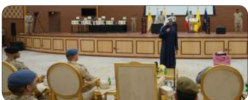
الشيخ عبدالله السالم يلقي كلمته

أمامهم العديد من الفرص لخدمة الوطن في مختلف المجالات. وبلغ عدد المقترعين 459 مقترعا قبل منهم 150 مرشحا واختير 30 آخرون في قائمة الاحتياط موزعين على التخصصات العلمية والأدبية وفق احتياجات القوات المسلحة. حضر إجراءات القرعة