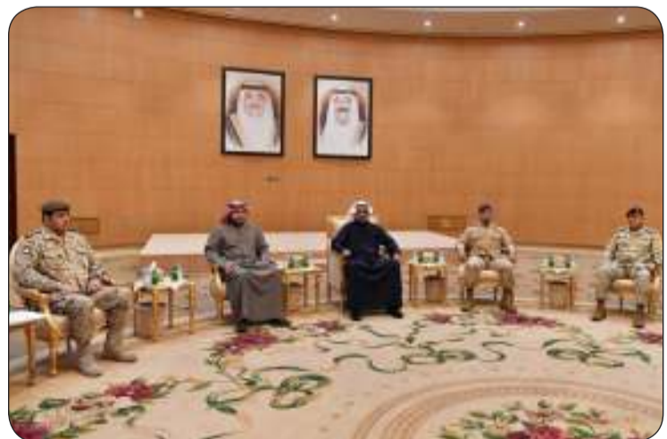
وزير الدفاع يشهد إجراء قرعة المتقدمين لدورة الطلبة الضباط للدفعة 24