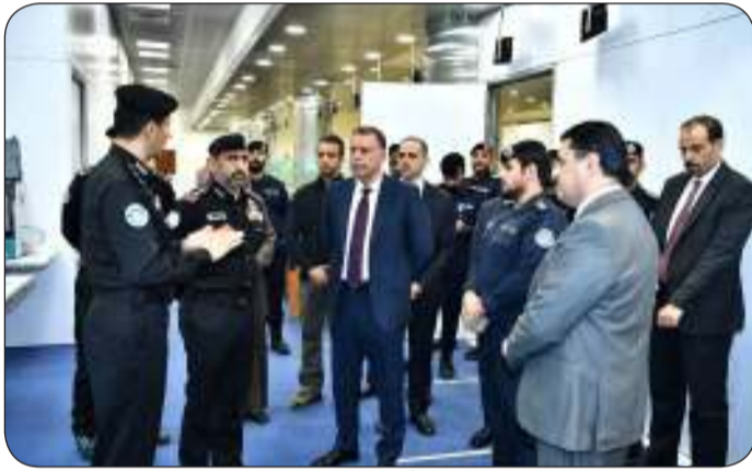
من جولة وزير الداخلية الأردني في إدارة الجنسية الكويتية