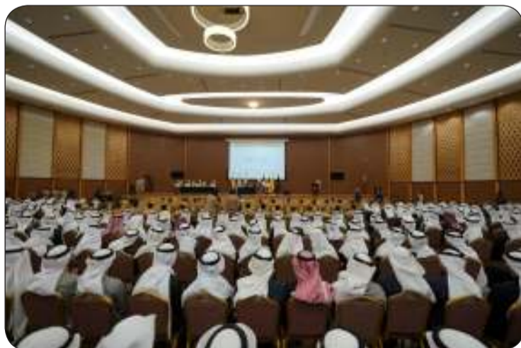
جانب من حضور القرعة