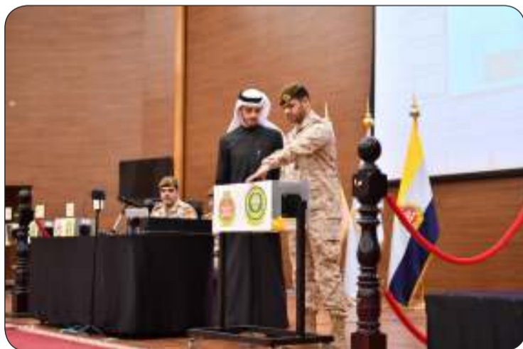
جانب من إجراء القرعة