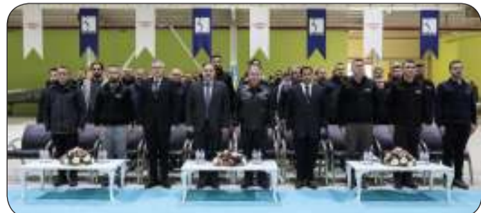
جانب من الحفل