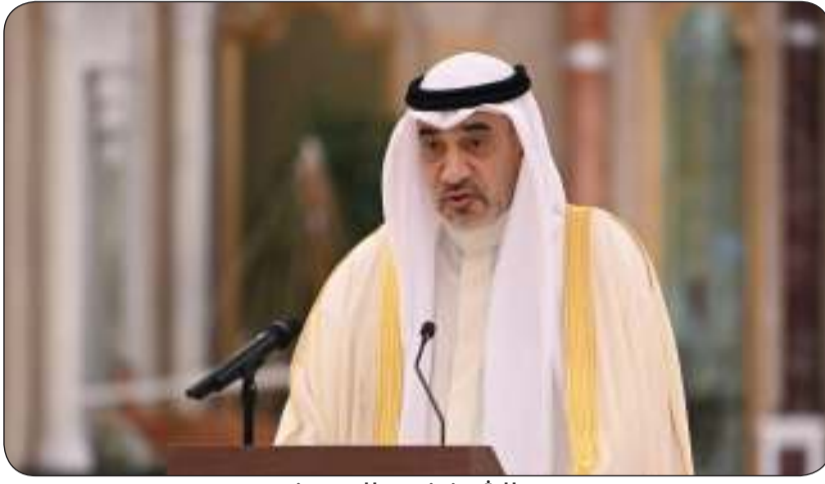
الشيخ فهد اليوسف

ومن المقرر أن تساهم مخرجات المنتدى وإعلان الكويت في إيلاغ المنتدى السياسي الرفيع المستوى المعنى بالتنمية المستدامة لعام 2025 في نيويورك والمنتدى العالمي للحد من مخاطر الكوارث لعام 2025 المقرر عقده في الفترة من الثاني إلى السادس من يونيو المقبل في جنيف بسويسرا.