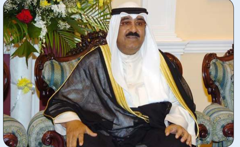
سمو أمير البلاد

بعث سمو أمير البلاد الشيخ مشعل الأحمد برفقة تهنئة إلى سيسيل لا غرينادا الحاكمة العامة في غرينادا الصديقة عبر فيها سموه عن خالص تهنأته بمناسبة ذكرى الاستقلال لبلادها، متمنيا سموه لها موفور