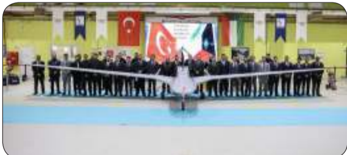
تخريج الدفعة الثانية من الطيارين والرماة لمنظومة مسيرات بيرقدار

لشراء منظومة مسيرات "بيرقدار" التي هي 2 التركية بهدف تعزيز قدرات الجيش الكويتي بتنفيذ مهام متعددة لدعم العمليات العسكرية والأمنية.