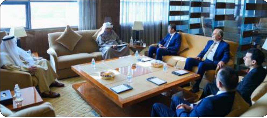
سمو الشيخ أحمد عبدالله مستقبلاً الرئيس الأول لمحكمة النقض المغربي

استقبل سمو الشيخ أحمد عبدالله رئيس مجلس الوزراء وبحضور رئيس المجلس الأعلى للقضاء المستشار الدكتور عادل بورسلي في قصر بيان أمس الرئيس الأول لمحكمة النقض الرئيس المنتخب للمجلس الأعلى للسلطة القضائية بالملكة المغربية الشقيقة المستشار محمد عبدالنابوي الوفد المرافق له وذلك بمناسبة زيارته للبلاد.