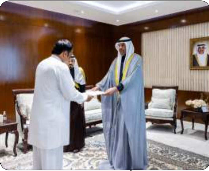
ويتسلم نسخة من أوراق اعتماد سفير سريلانكا لدى البلاد