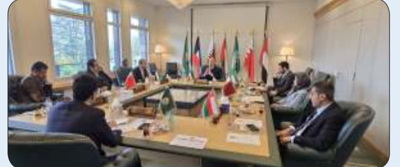
السفير ناصر الهين مترئسا الاجتماع الأول لسفراء دول مجلس التعاون

جنيف - "كونا": أكد المندوب الدائم لدولة الكويت لدى الأمم المتحدة والمنظمات الدولية الأخرى في جنيف السفير ناصر الهين أمس الخميس أهمية استمرار في نهج التعاون المشترك لتعزيز السلام والأمن الدولي. جاء ذلك في تصريح للسفير الهين لـ "كونا" عقب ترؤسه الاجتماع الأول لسفراء دول مجلس التعاون الخليجي لعام 2025 الذي عقد في مقر بعثة مجلس التعاون برئاسة دولة الكويت لمناقشة مخرجات القمة الخليجية الأخيرة. وأوضح الهين أن الاجتماع جاء في إطار تنسيق ومناقشة أولويات العمل الخليجي المشترك على مستوى المنظمات الدولية في جنيف من أجل حماية الأسس القانونية والاتفاقات الدولية ذات الصلة فضلا عن