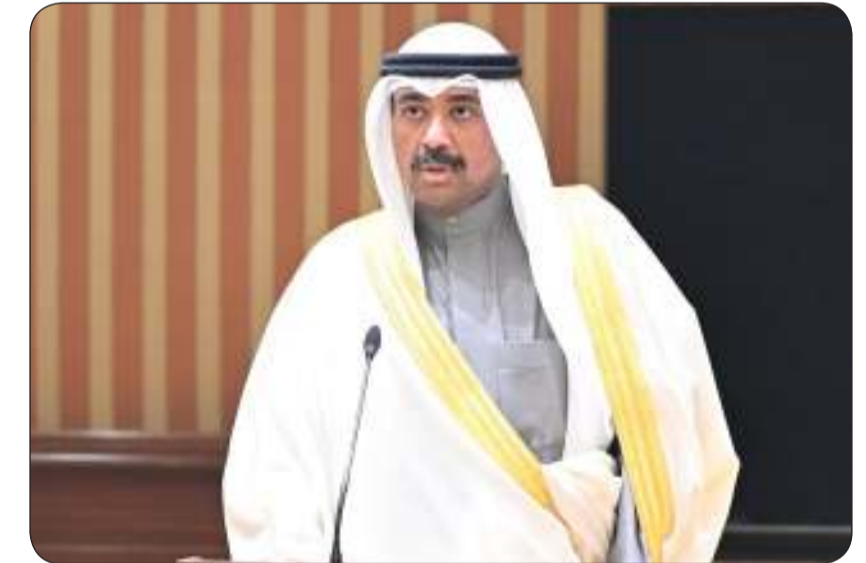
الشيخ عبدالله العلي يؤدي اليمين الدستورية

سموه رئيس مجلس الوزراء أقام عشاء عمل على شرف الرئيس التنفيذي لشركة «بلاك روك»