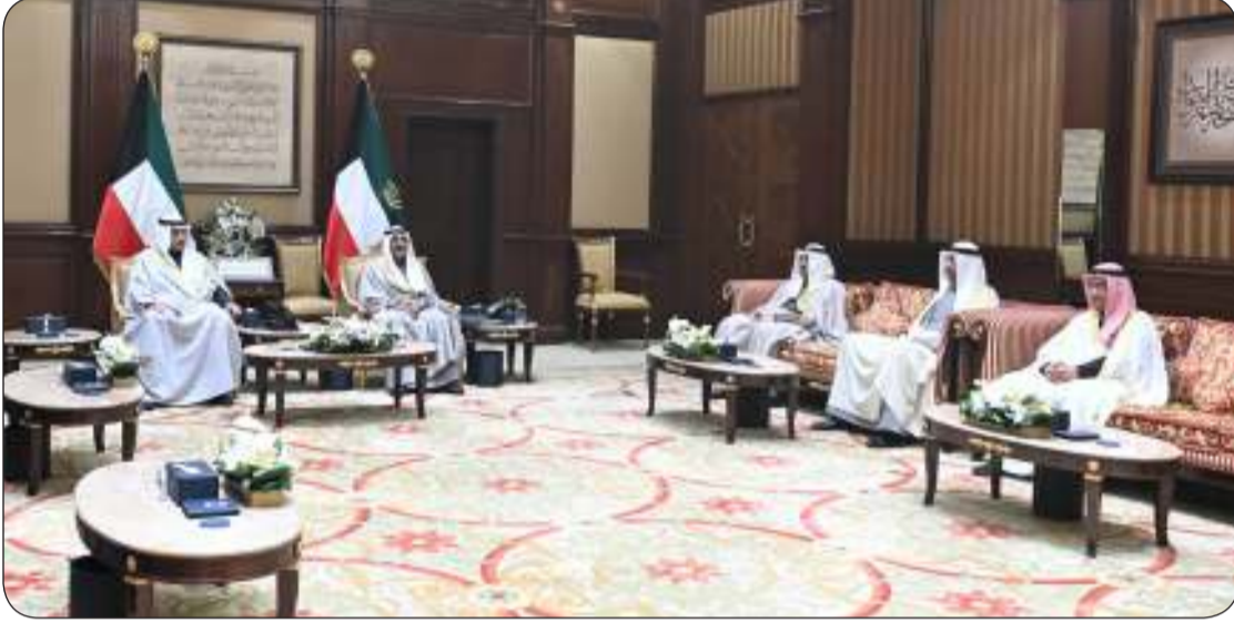
سموه مستقبلاً بحضور ولي العهد رئيس الوزراء ووزير الدفاع الجديد