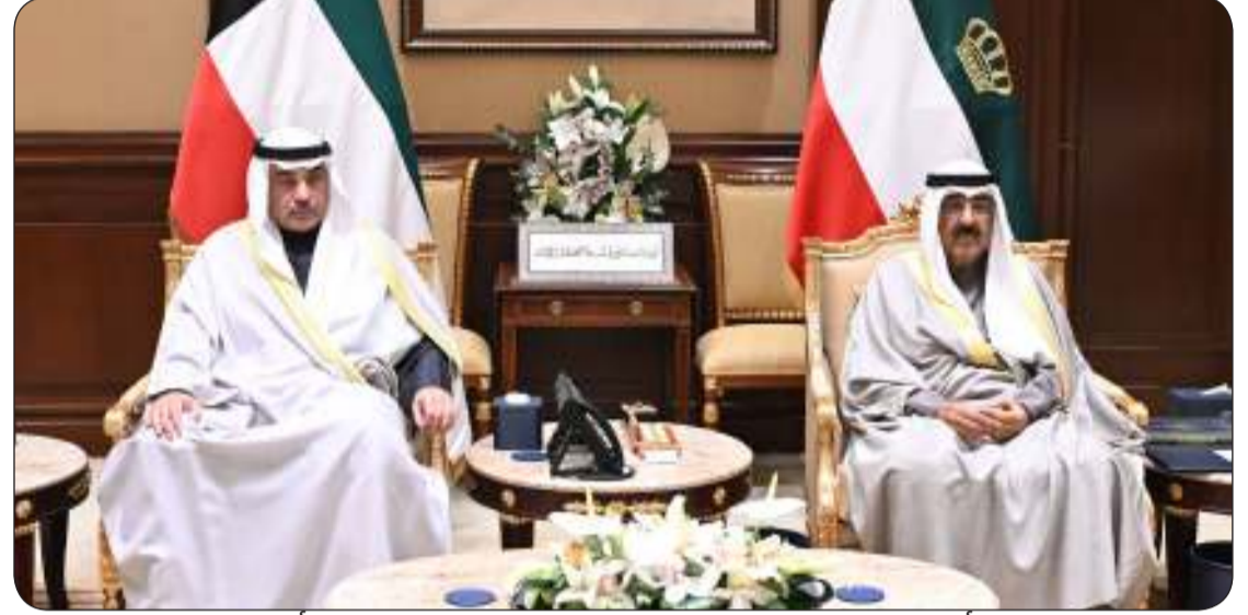
سمو أمير البلاد وإلى جانبه سمو ولي العهد في مراسم أداء القسم

لدى بورصة نيويورك. وشغل منصب رئيس الإدارة العامة للطيران المدني. وتولى منصب أمين سر وحدة التحريات المالية الكويتية. كما أنه حاز عضوية وحدة التحريات المالية الكويتية ورئاسة قسم مكافحة عمليات غسل الأموال وتمويل الإرهاب إضافة إلى كونه مراقباً مصرفياً. وفي عام 2022 تم تعيينه وزيراً للدفاع بحكومة سمو الشيخ أحمد نواف الأحمد الصباح رئيس مجلس الوزراء خلال الفترة من 16 أكتوبر 2022 حتى 9 أبريل 2023.