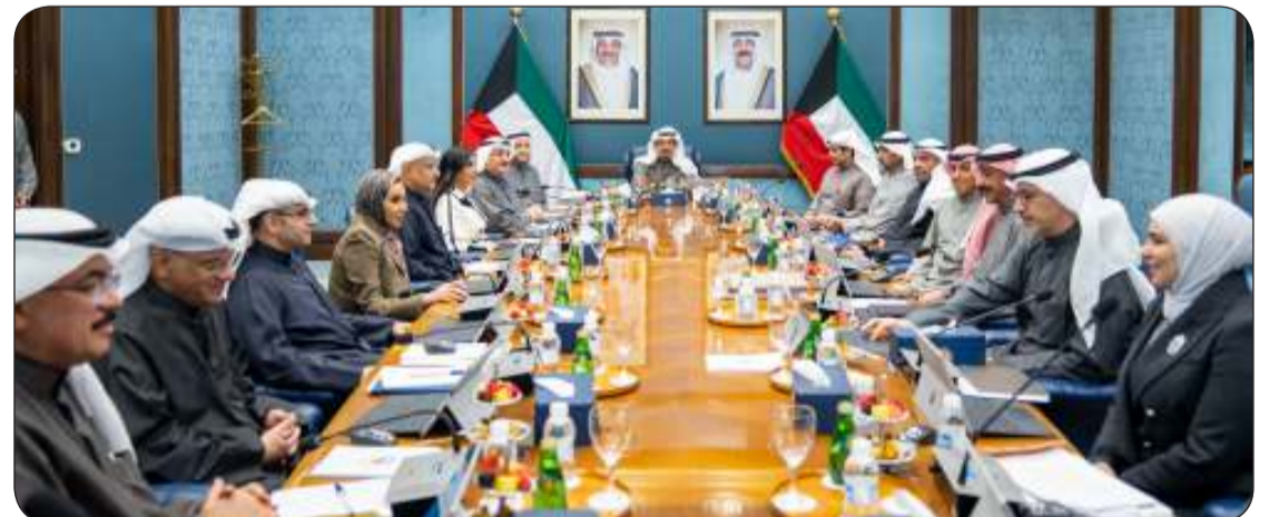
مجلس الوزراء في اجتماعه الأسبوعي

الحكومة حريصة على تطوير البيئة الاقتصادية في إطار تحقيق الأهداف التنموية الطموحة للبلاد أهمية تواجد الشركات العالمية الكبرى في دولة الكويت مما يسهم في نقل خبراتها وخلق فرص عمل للشباب ترسيخ أفكار الانفتاح الاقتصادي وتنويع الفرص الاستثمارية الواعدة وصولاً إلى التنمية الشاملة والمستدامة