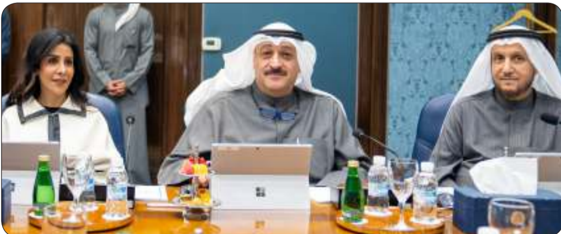
جانب آخر من الاجتماع