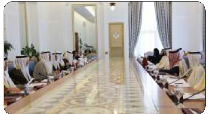
جانب من الاجتماع بين الطرفين

من جانبه، أكد سفير دولة الكويت لدى قطر خالد المطيري أمس الاثنين أهمية اجتماع أعمال اللجنة العليا المشتركة مع دولة قطر في دورتها السادسة بالدوحة مشيراً إلى وجود عدد من مذكرات التفاهم التي تم التوقيع عليها لتعزيز التعاون المشترك. وقال السفير المطيري في تصريح لـ "كونا" إن أعمال اللجنة المشتركة القطرية - القطرية عقدت برئاسة وزير الخارجية القطري عبد الله الجحيا ومن الجانب القطري رئيس مجلس الوزراء وزير الخارجية الشيخ محمد بن عبد الرحمن. وأكد أهمية اللجنة العليا المشتركة في تعزيز العلاقات الثنائية وزيادة مستوى التنسيق المتبادل بشأن القضايا الثنائية والعربية والإقليمية ما يعكس مستوى التطور في العلاقات الأخوية بين البلدين الشقيقين. وأضاف أن أعمال اللجنة الثانية في مختلف المجالات إلى مناقشة آخر المستجدات على الساحتين الإقليمية والدولية. وأقام نائب وزير الخارجية مادية غداء على شرف رئيس وفد سلوفينيا والوفد المرافق له.