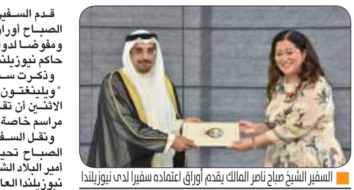
السفير الشيخ صباح ناصر المالك يقدم أوراق اعتماده سفيراً لدى نيوزيلندا

بدوام التقدم والازدهار لنيوزيلندا وشعبها الصديق. كما التقى السفير الشيخ صباح ناصر المالك الصباح كلمة بهذه المناسبة أشاد فيها بالعلاقات الثنائية بين الكويت ونيوزيلندا مؤكداً أهمية تطوير الشراكة والصداقة المميزة التي تجمع البلدين الصديقين. من جانبها أعربت الحاكم العام لنيوزيلندا في كلمة ترحيبية ألقتهما عن اعترافها بعمق العلاقات الكويتية - النيوزيلندية وتمنياتها بالتوفيق والنجاح لسفير دولة الكويت في مهام منصبه لما فيه مصلحة البلدين والشعبين الصديقين.