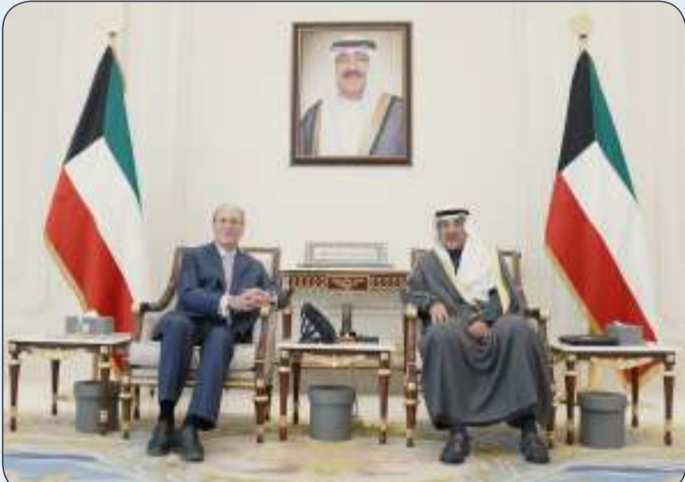
ولي العهد استقبل رئيس مجلس الإدارة والرئيس التنفيذي لشركة بلاك روك

استقبل سمو ولي العهد الشيخ صباح الخالد بقصر بيان صباح أمس سمو ولي العهد الشيخ أحمد عبدالله رئيس مجلس الوزراء. من جانب آخر، استقبل سمو ولي العهد الشيخ صباح الخالد رئيس مجلس الإدارة والرئيس التنفيذي لشركة بلاك روك لاري فينك وذلك بمناسبة زيارته للبلاد.