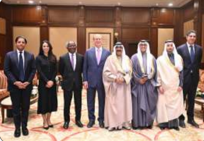
لقطة جماعية لسموه مع الرئيس التنفيذي والحضور