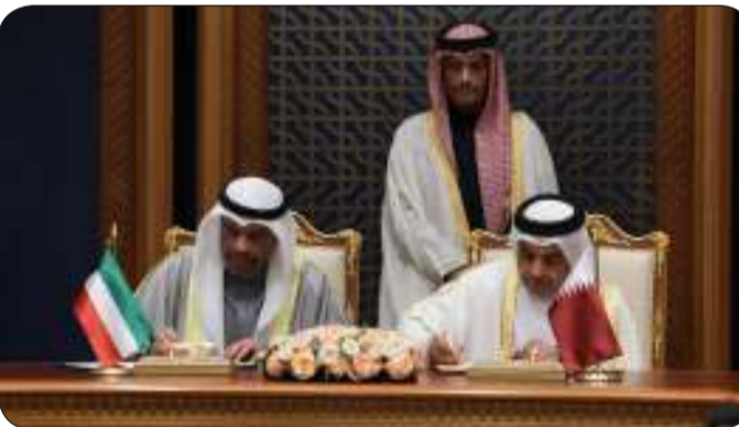
من توقيع الاتفاقيات بين الطرفين