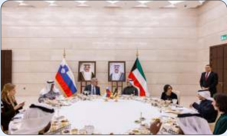
من الاجتماع بين الطرفين

عقدت أمس الاثنين الجولة الأولى من المشاورات السياسية بين وزارتي خارجية دولة الكويت وجمهورية سلوفينيا حيث ترأس الجانب الكويتي نائب وزير الخارجية السفير الشيخ جراح الجابر في حين ترأس الجانب السلوفيني وزير الدولة بوزارة الخارجية والشؤون الأوروبية ماركو ستوشين. وتم خلال المشاورات بحث الموضوعات المطروحة على جدول الأعمال وسبل توطيد وتنمية العلاقات الثنائية في مختلف المجالات بالإضافة إلى مناقشة آخر المستجدات على الساحتين الإقليمية والدولية. وأقام نائب وزير الخارجية مادية غداء على شرف رئيس وفد سلوفينيا والوفد المرافق له.