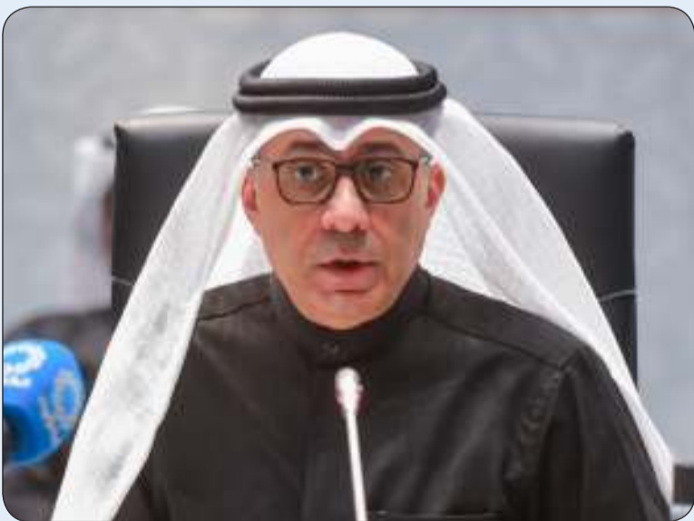
مساعد وزير الخارجية لشؤون الوطن العربي السفير أحمد البكر

قال مساعد وزير الخارجية لشؤون الوطن العربي السفير أحمد البكر أمس الاثنين إن دول مجلس التعاون الخليجي أحرزت تقدماً كبيراً في مجال تعزيز حقوق الإنسان مؤكداً أهمية استمرار التنسيق والتعاون لتعزيز الصورة المشرفة لدول المجلس في المحافل الإقليمية والدولية. وجاء ذلك في كلمة للسفير البكر خلال ترؤسه أعمال الاجتماع الـ 18 لرؤساء الأجهزة الحكومية المعنية بحقوق الإنسان في دول المجلس. وقال البكر إن دول مجلس التعاون الخليجي تستضيفه دولة الكويت. وأضاف البكر أن الاجتماع يناقش عدداً من الموضوعات المهمة من بينها التنسيق لأعمال الدورة العادية الـ 55 للجنة العربية المقرر عقدها اليوم الثلاثاء وجدول أعمال الدورة الـ 58 لمجلس حقوق الإنسان إضافة إلى تبادل التجارب وأفضل الممارسات لتعزيز حقوق الإنسان في دول المجلس.