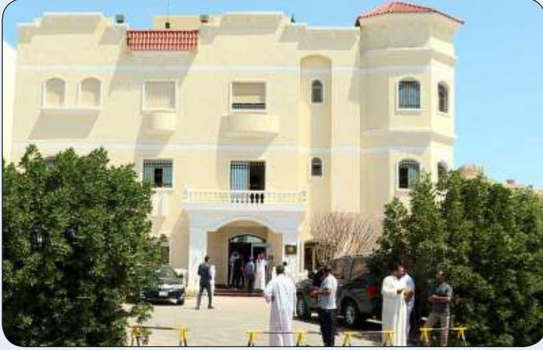
القنصلية المصرية في الكويت

أعلنت القنصلية المصرية في الكويت لجاليتها، انه مع اقتراب مجيء لجنة من وزارة الداخلية المصرية لاستخراج وتجديد بطاقات الرقم القومي، وطلبت مصلحة الاحوال المدنية، بيانات إضافية عن الراغبين في انجاز