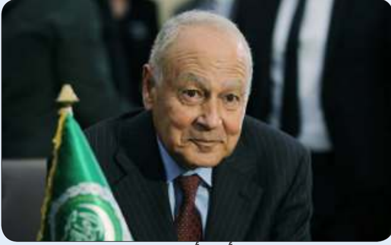
أحمد أبو الغيث

والإقليمية والدولية في ظل الظروف الصعبة التي تمر بها المنطقة وخصوصا ما يتعلق بدول عربية. ومن المنتظر ان يلقي الأمين العام لجامعة الدول العربية أحمد أبو الغيث محاضرة في المعهد سعود الناصر الدبلوماسي.