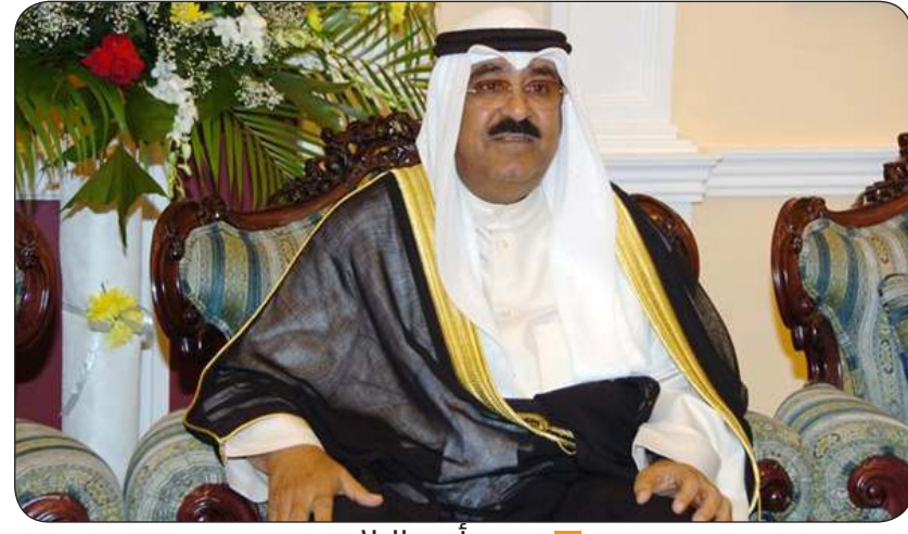
سمو أمير البلاد

يتفضل سمو أمير البلاد الشيخ مشعل الأحمد فهد الصباح برعايته وحضوره مراسم رفع العلم بقصر بيان وذلك في تمام الساعة العاشرة من صباح اليوم الأحد.