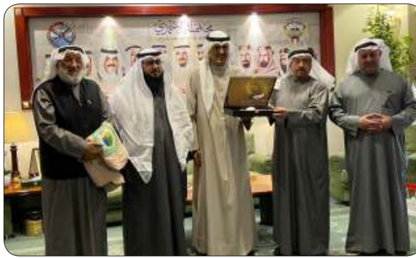
محافظ الأحمدى يكرم المزييني

أن الجمعية تقدم تقنية «كفاءة المياه» حلاً للتغلب على تحديات نقص المياه مستقبلاً، والجمعية تطرح حلولاً مبتكرة ومبدعة لاستدامة المياه.