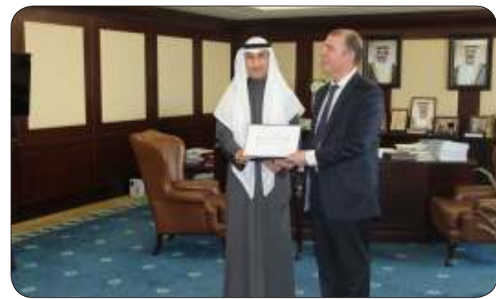
رئيس الفتوى والتشريع ومستشار مجلس الدولة الفرنسي يتبادلان شهادات التقدير