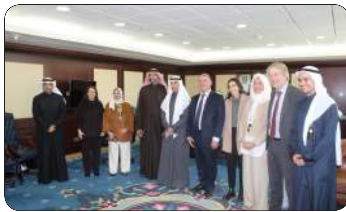
صورة جماعية للمشاركين في البرنامج التدريبي