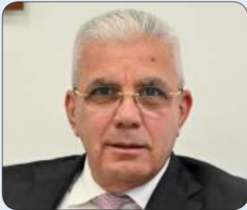
السفير رامي طهوب