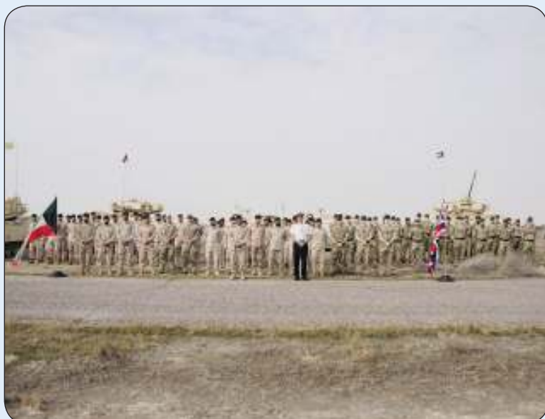
انطلاق فعاليات تمرين محارب الصحراء 8 المشترك بين الجانبين الكويتي والبريطاني

وتعزيز سبل التعاون العسكري بين الجانبين. وأضافت أن التمرين يهدف إلى توفير كافة الإمكانيات وتسخير جميع القدرات لتحقيق أقصى درجات الاستفادة من التدريبات والتمازج المشتركة ورفع مستوى الجاهزية القتالية من العمل المشترك وتوحيد المفاهيم العسكرية