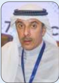
السفير حمد المشعان

أكد مساعد وزير الخارجية للتنمية والتعاون الدولي السفير حمد المشعان حرص القيادة السياسية الحكيمة في البلاد على بذل جهات الدولة والمعنيين لكل الجهود لخروج دولة الكويت من مرحلة المتابعة المعززة للتقييم حيث تمر حاليا بعملية التقييم المتبادل من مجموعة العمل المالي «فاتف».