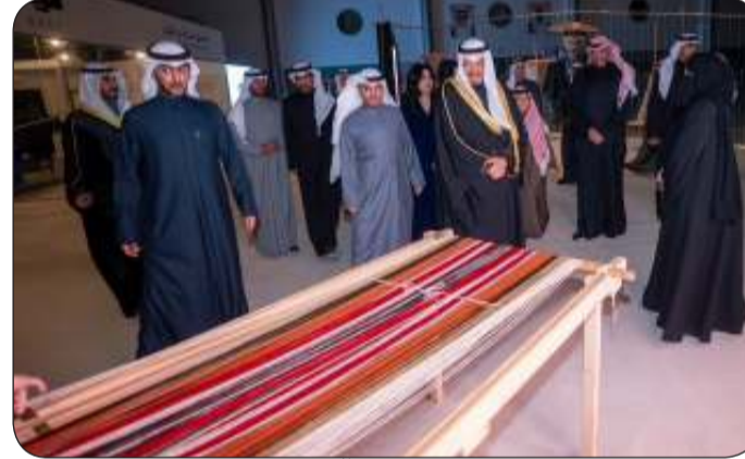
سمو ه يطلع على آلية حياكة الغزل