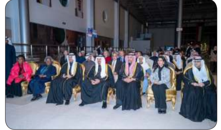
سمو رئيس مجلس الوزراء رعى وحضر حفل افتتاح مركز صوف لصناعة الغزل

ورئيس مجلس إدارة نادي سلوى الصباح الرياضي الشبيخة نعيمة الأحمد الجابر الصباح وعدد من الشيوخ وممثلي السلك الدبلوماسي وكبار المسؤولين في الدولة وديوان رئيس مجلس الوزراء. وأطلع سموه خلال الحفل على آلية حياكة الغزل وكيفية تطويرها عبر استخدام الموارد الطبيعية وتوفير الخيوط الصوفية اللازمة للإنتاج الحرقي بالإضافة إلى استخدام تقنيات مستدامة للمياه والطاقة وأنظمة متطورة ومواد صديقة للبيئة.