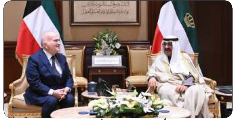
سمو أمير البلاد مستقبلا الأمير الحسن بن طلال

استقبل سمو أمير البلاد الشيخ مشعل الأحمد بقصر بيان صباح أمس صاحب السمو الملكي الأمير الحسن بن طلال وذلك بمناسبة زيارته للبلاد. حضر اللقاء كبار المسؤولين بالدولة. من جانب آخر، بعث سمو أمير البلاد الشيخ مشعل الأحمد ببرقية تعزية إلى الرئيس رجب طيب أردوغان رئيس الجمهورية التركية الصديقة عبر فيها سموه عن خالص تعازيه وصادق مواساته بضحايا الحريق الذي اندلع في منتجع سياحي بمدينة بولو التركية وأسفر عن سقوط العشرات من الضحايا والمصابين راجيا سموه المولى جل وعلا أن يتغمد الضحايا بواسع رحمته ومغفرته وأن يمن على المصابين بسرعة الشفاء والعافية. وبعث سمو ولي العهد الشيخ صباح الخالد، وسمو الشيخ أحمد عبدالله رئيس مجلس الوزراء ببرقيتي تعزية مماثلتين.