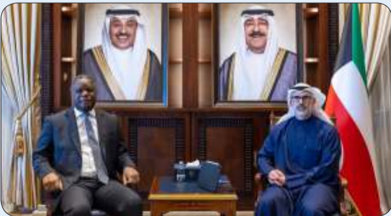
مستقبلا ستانك سامكانج

استقبل نائب وزير الخارجية السفير الشيخ جراح الجابر أمس الثلاثاء نائب رئيس البنك الدولي لشؤون الشرق الأوسط وشمال أفريقيا أوسمان ديون. وقالت وزارة الخارجية في بيان لها إنه تم خلال اللقاء بحث سبل التعاون والتسيق بين الجانبين لاسيما دور برنامج الاغذية العالمي في منطقة الشرق الأوسط.