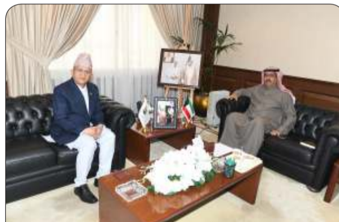
ومستقبلا سفير النيبال

سفير فوق العادة ومفوض جمهورية النيبال لدى دولة الكويت السفير غانا شيام لامسال. وتزايد من التوافق بين دولة الكويت وجمهورية النيبال الصديقة.