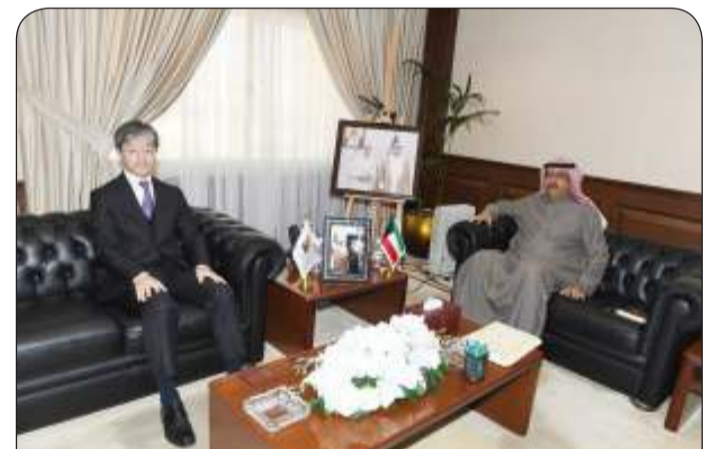
محافظ حولي مستقبلا سفير اليابان

سفير فوق العادة ومفوض جمهورية النيبال لدى دولة الكويت السفير غانا شيام لامسال. وتزايد من التوافق بين دولة الكويت وجمهورية النيبال الصديقة.