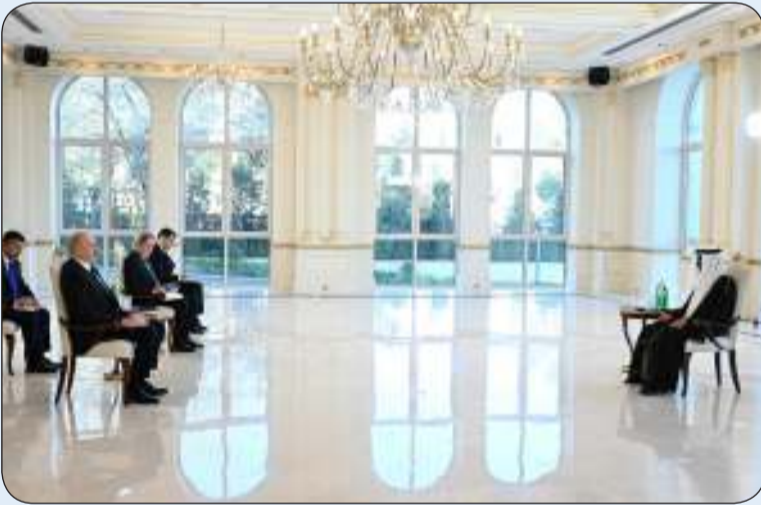
جانب من الاستقبال

وأبدى السفير المطيري خلال اللقاء رغبة دولة الكويت الصادقة في تطوير العلاقات الثنائية بين البلدين الصديقين وتنميتها وتحقيق رؤى القيادتين ونقلها إلى أعلى مستوى في العلاقات الثنائية في المجالات والأصعدة كافة وإلى مستويات أرحب وكذلك في المجالات ذات الاهتمام المشترك تجاه القضايا