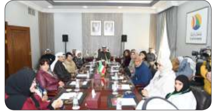
محافظ حولي علي الأصغر يلتقي وفد منظمة الصحة العالمية الزائر للبلاد

تقديم شرح مرئي عن منطقة الشعب وعدد من المناطق بمحافظة حولي ومناقشة كل التصورات والاشتراطات المطلوبة لتحويل مناطق محافظة حولي إلى صحية متكاملة. وتأتي هذه الزيارة لتقييم المدن الصحية في الكويت والإطلاع على أنشطة اللجان التنسيقية في المناطق للتأكد من أن الخطط والأهداف المعروضة قائمة على أرض الواقع.