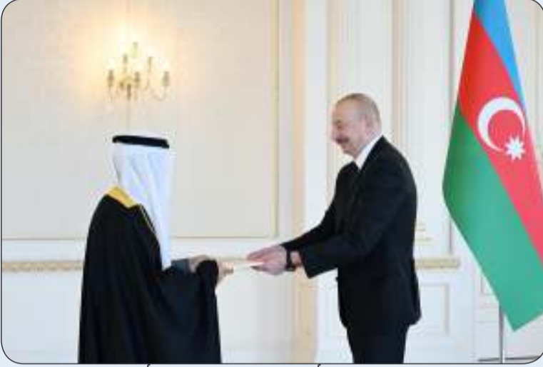
سفيرنا محمد المطيري يقدم أوراق اعتماده إلى رئيس أذربيجان إلهام علييف

أنقرة - "كونا": قدم سفير دولة الكويت في باكو محمد المطيري أمس الأول أوراق اعتماده سفيراً فوق العادة ومفوضاً لدى جمهورية أذربيجان الصديقة إلى رئيس أذربيجان إلهام علييف.