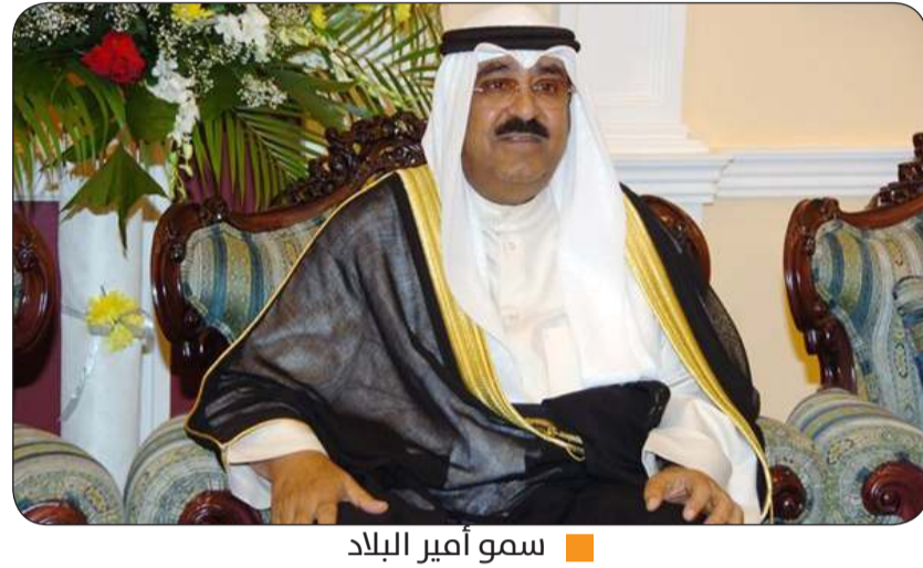
سمو أمير البلاد

الشقيقة وشعبها الكريم المزيد من التقدم والازدهار. في ظل قيادته الحكيمة. ويعت سمو ولي العهد، الشيخ صباح الخالد، وسمو الشيخ أحمد عبدالله رئيس مجلس الوزراء ببرقيتي تهنئة مماثلتين.