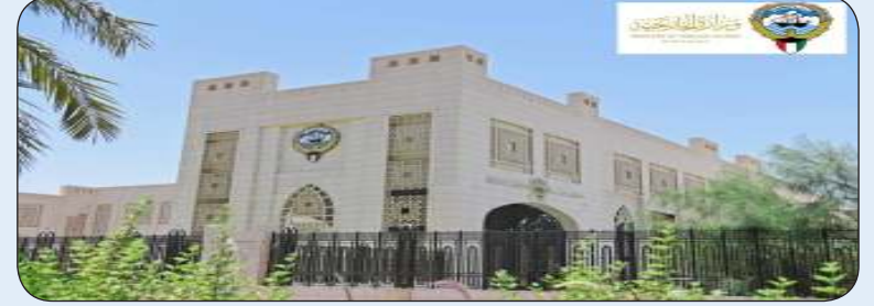
■ وزارة الخارجية

أعربت وزارة الخارجية عن تعاطف دولة الكويت وتضامنها مع حكومة وشعب جمهورية الصين الشعبية إثر الزلازل الذي ضرب منطقة التبت في جبال الهيمالايا جنوب غربي البلاد وتسبب في مقتل وإصابة العديد من الأشخاص