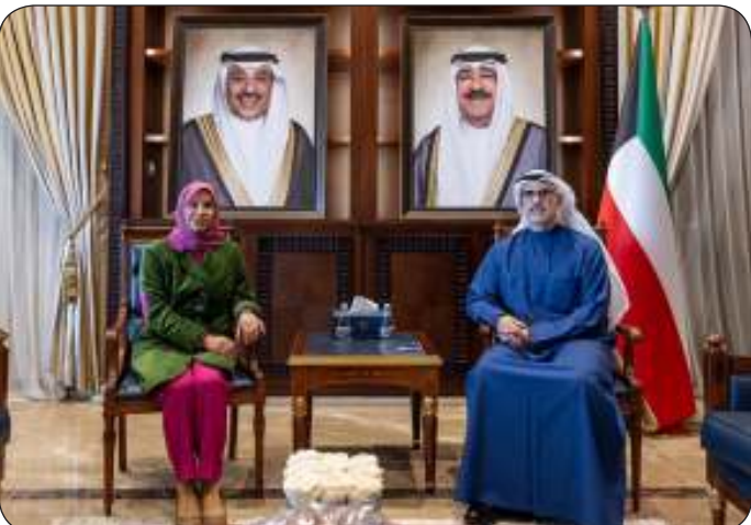
■ نائب وزير الخارجية مستقبلا رحاب بورسلي