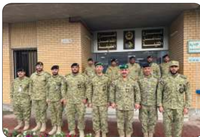
■ وكيل الحرس الوطني يتفقد كتائب تأمين المنشآت النفطية

أهمية دور الحرس الوطني في تأمين المنشآت والمرافق الحيوية في البلاد. كما تفقد الفريق الرفاعي مديرية الخدمات الفنية بمعسكر التحرير للوقوف على سير العمل والتعرف على احتياجات الوحدات المختلفة.