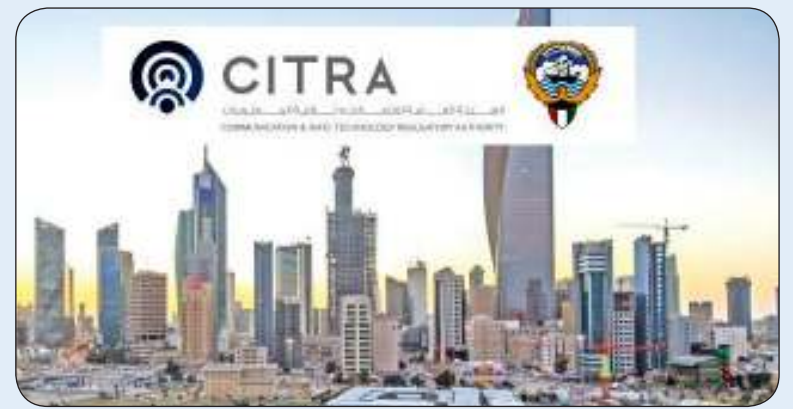
■ هيئة الاتصالات وتقنية المعلومات

أعلنت الهيئة العامة للاتصالات وتقنية المعلومات عن إطلاق البوابة الدولية الجديدة للربط والعبور الدولي للكويت «مسار العراق» وذلك بالشراكة مع شركة «كيمز زاجل» للاتصالات.