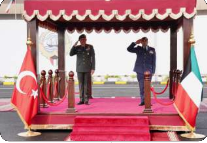
■ نائب رئيس الأركان مستقبلا غوراك