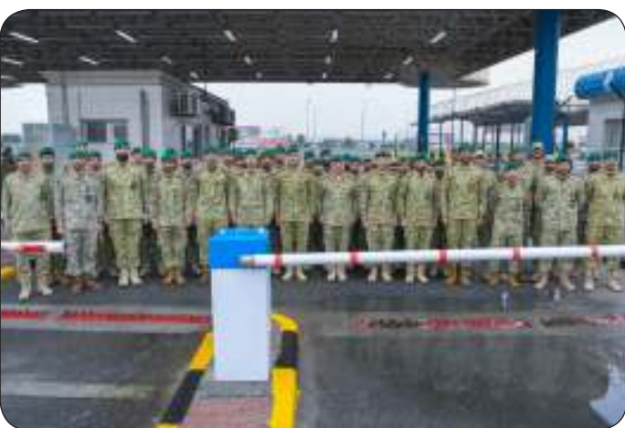
■ وفي لقطة جماعية مع عدد من الضباط والأفراد