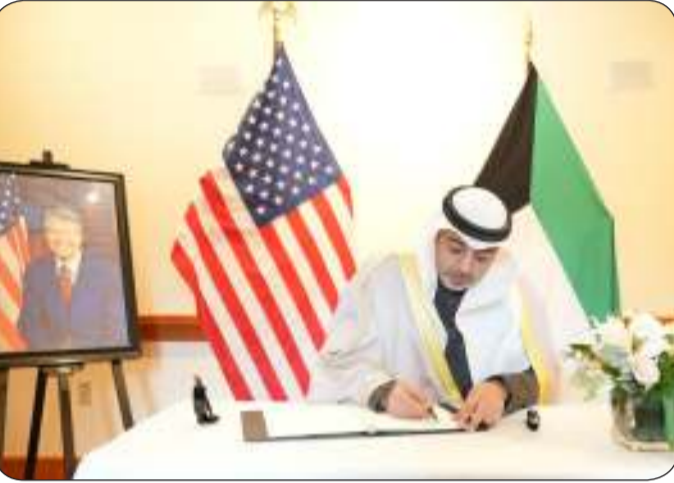
■ ويدون كلمة في سجل العزاء