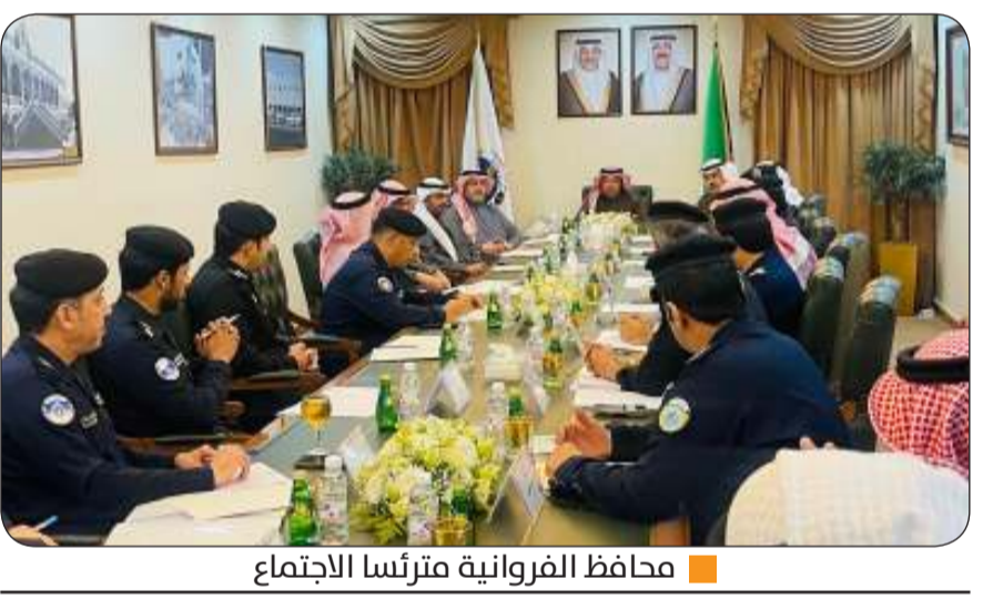
■ محافظ الفروانية مترئسا الاجتماع

ترأس محافظ الفروانية الشيخ عذبي العذبي، صباح أمس الثلاثاء، اجتماع المحافظين الذي عقد في ديوان عام محافظة العاصمة. حضر الاجتماع محافظ العاصمة الشيخ عبدالله العلي، ومحافظ حولي علي الأصغر، ومحافظ مبارك الكبير الشيخ صباح البدر، ومحافظ الجهراء حمد الحبشي، ومحافظ الأحمدى الشيخ حمود الجابر، وعدد من قيادات وزارة الداخلية. في البداية رحب محافظ العاصمة الشيخ عبدالله العلي في الحضور، وجرى خلال الاجتماع استعراض الاستعدادات الخاصة في احتفالات الأعياد الوطنية، وأهمية تفعيل كافة الجوانب التي تساهم في إبراز الفرحة والبهجة في عموم البلاد. كما تناول المحافظون مناقشة التنسيق بين محافظات البلاد وتضاضر كافة الجهات الحكومية، في سبيل الاحتفال بالأعياد الوطنية بأبهى وأجمل صورة مشرفة.