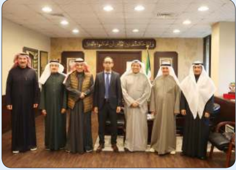
■ جانب من الاستقبال

بحث رئيس المجلس الأعلى للقضاء ورئيس محكمة التمييز المستشار الدكتور عادل بورسلي أمس الثلاثاء مع رئيس قطب القضاء الجنائي بالمجلس الأعلى للسلطة القضائية بالمملكة المغربية حكيم الوردى سبل التعاون المشترك. وذكرت وزارة العدل في بيان صحفي أن الجانبين استعرضا كافة الأمور القضائية والقانونية المشتركة وسبل تطوير أنظمة التقاضي وذلك من خلال استخدام التقنيات والوسائل الإلكترونية الحديثة والتحول الرقمي في كافة مجالات التقاضي. وأضاف البيان أنه تم أيضا خلال اللقاء استعراض إمكانية تسهيل إجراءات التقاضي ورفع صفح