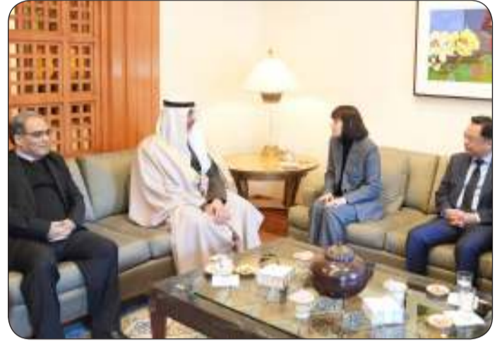
■ وزير الديوان الأميري يقدم واجب العزاء بالسفارة الأمريكية

قام وزير شؤون الديوان الأميري الشيخ محمد عبدالله أمس بزيارة إلى سفارة الولايات المتحدة الأمريكية لدى دولة الكويت حيث نقل تعازي سمو أمير البلاد الشيخ مشعل الأحمد، وسمو ولي العهد