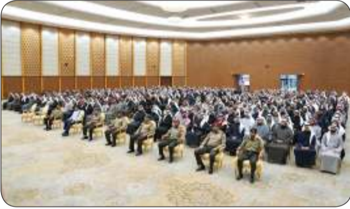
جانب من اللقاء التنويري