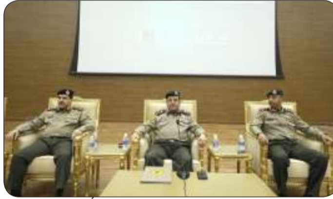
رئيس هيئة الخدمة الوطنية العسكرية اللواء الركن أحمد الشفا متحدثا

في إعداد جيل قادر على تحمل المسؤولية الوطنية وحث المجندين على الالتزام بالإجراءات المحددة وأن هذه الدعوة تمثل فرصة للمساهمة الفاعلة في تعزيز أمن الوطن واستقراره وترسيخ قيم الولاء والانتماء.