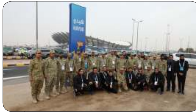
عدد من رجال الحرس الوطني المشاركين في التأمين

وانضباط وجاهزية مؤسسة الحرس الوطني في دعم الجهات المعنية بتنظيم بطولة كأس الخليج ونجاحها.