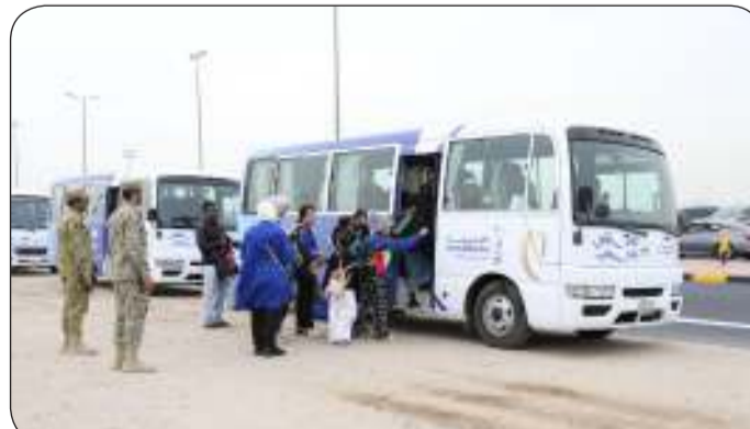
تأمين وتنظيم بطولة كأس الخليج