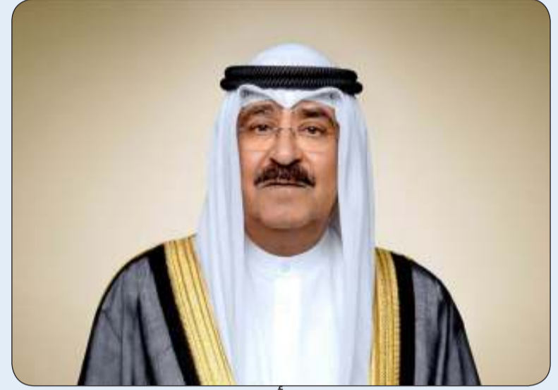
سمو أمير البلاد

الأسبق جيمي كارتر راجيا سموه لأسرته وذويه جميل الصبر. وبعث سمو ولي العهد الشيخ صباح الخالد، وسمو الشيخ أحمد عبدالله رئيس مجلس الوزراء ببرقيات تعزية مماثلتين.