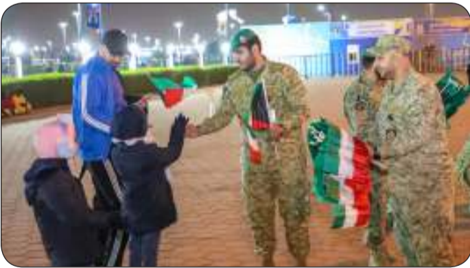
توزيع الاعلام على المشجعين