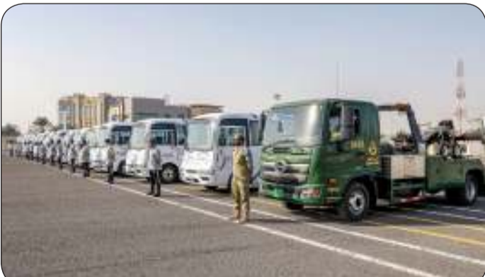
استعداد رجال الحرس الوطني

يجسد رجال الحرس الوطني مثالا يحتذى بتقديم أروع صور التفاني والانضباط خلال مشاركتهم في تأمين بطولة