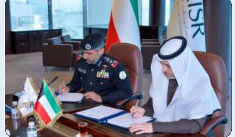
خلال توقيع مذكرة التفاهم

وقع معهد الكويت للأبحاث العلمية والإدارة العامة لخفر السواحل أمس الاثنين مذكرة تفاهم لتطوير التعاون في مجال حماية البيئة البحرية من التلوث.