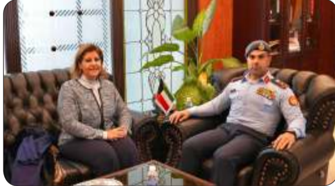
■ الجابر مستقبلا الصباح