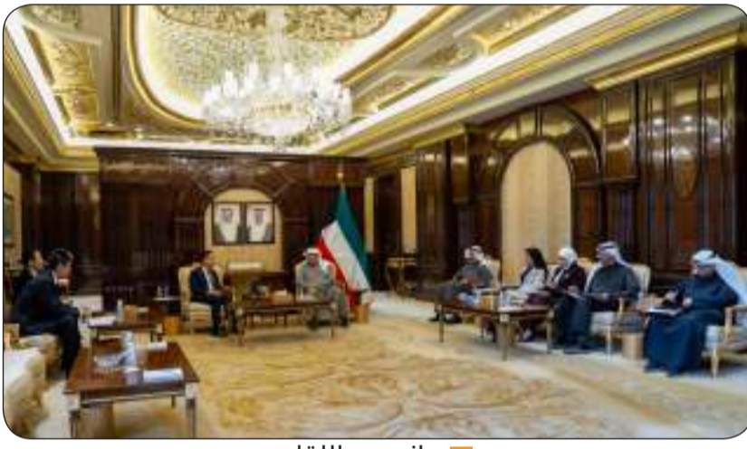
■ جانب من اللقاء

الصحي والتعاون في مجال المناطق الحرة والمناطق الاقتصادية. حضر المقابلة رئيس ديوان رئيس مجلس الوزراء عبدالعزيز الدخيل ووزير الأشغال العامة الدكتور نورة المشعان ووزير الكهرباء والماء محمود بوشهري ووزير الدولة لشؤون البلدية وزير الدولة لشؤون الإسكان عبداللطيف المشاري ووزير المالية ووزير الدولة للشؤون الاقتصادية والاستثمار نورة الفصام ومساعد وزير الخارجية لشؤون آسيا السفير سمح حيات.