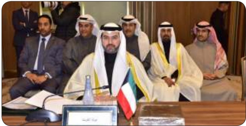
■ الشيخ حمود المبارك مترئسا وفد الكويت في الاجتماع

أكد ان التطورات التكنولوجية وتسارع النمو في صناعة النقل الجوي العالمية تحتم علينا توحيد الصف والعمل بروح الفريق لمواجهة التكتلات العالمية سواء على مستوى الحكومات او شركات الطيران ومقدمي الخدمات بها. ودعا في هذا السياق جميع اعضاء المنظمة العربية للطيران المدني إلى تعزيز التعاون والتكامل لتوطيد الحضور العربي في المحافل العربية الاعضاء في المنظمة. وأضاف الشيخ حمود الصباح ان تطوير قطاع الطيران المدني في منظومته امر لا بد منه ما يؤدي إلى تعزيز عمل المطارات عبر أجهزة وبرامج تحافظ على انسيابية الحركة. ولفت في هذا الصدد الى أهمية ضمان راحة المسافر وتسهيل اجراءاته دون الاخلال بأمن وسلامة المسافرين والحفاظ على المنظومة الأمنية.