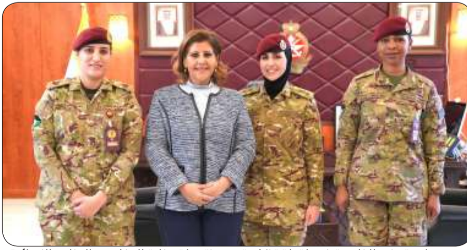
■ مساعدة وزير الخارجية في لقطة تذكارية مع منسبات وزارة الدفاع من العناصر النسائية

بحث نائب رئيس الأركان العامة للجيش الكويتي اللواء الركن طيار صباح الجابر بمكتبه مع مساعد وزير الخارجية لشؤون حقوق الإنسان السفيرة الشيخة جواهر الصباح أهم المواضيع الثنائية لاسيما المتعلقة بدور العنصر النسائي الفعال بوزارة الدفاع بشقيها العسكري والمدني. وذكرت رئاسة الأركان العامة للجيش الكويتي في بيان صحفي أمس الأربعاء أن الجانبين بحثا أيضا سبل تعزيز دور العنصر النسائي من خلال توفير بيئة داعمة ومحفزة وتمكينها من الوصول إلى مختلف الفرص الوظيفية التي تسهم في تعزيز كفاءة القوات المسلحة.