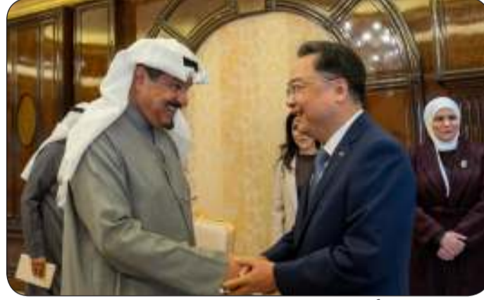
■ سمو رئيس مجلس الوزراء مرحبا بالسفير الصيني

الصحي والتعاون في مجال المناطق الحرة والمناطق الاقتصادية. حضر المقابلة رئيس ديوان رئيس مجلس الوزراء عبدالعزيز الدخيل ووزير الأشغال العامة الدكتور نورة المشعان ووزير الكهرباء والماء محمود بوشهري ووزير الدولة لشؤون البلدية وزير الدولة لشؤون الإسكان عبداللطيف المشاري ووزير المالية ووزير الدولة للشؤون الاقتصادية والاستثمار نورة الفصام ومساعد وزير الخارجية لشؤون آسيا السفير سمح حيات.