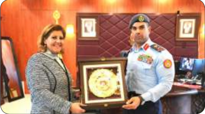
■ ويقدم درعا تذكارية لها