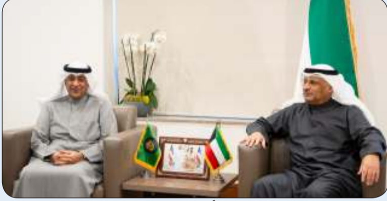
العمر مستقبلا الأمين العام لمجلس التعاون

استقبل وزير الدولة لشؤون الاتصالات عمر العمر الأمين العام لمجلس التعاون لدول الخليج العربية جاسم البديوي حيث بحثا سبل تعزيز التعاون المشترك لدعم التحول الرقمي وتطوير البنية التحتية الرقمية بما يخدم مصالح شعوب المنطقة الخليجية وعلى نحو يحقق أهداف التنمية المستدامة. وقال العمر لـ "كونا" أمس الاثنين إن اللقاء شهد استعراض التطورات الإقليمية والدولية في مجال الاتصالات والتكنولوجيا مشيدا بالعلاقات المتميزة التي تجمع دولة الكويت ودول مجلس التعاون الخليجي. من جانبه أعرب البديوي في تصريح مماثل عن شكره وتقديره لحفاوة الاستقبال مشيدا بدور دولة الكويت في دعم العمل الخليجي المشترك وخصوصا في مجالات التحول الرقمي وتقنيات المستقبل. وتأتي هذه الزيارة في إطار الجهود المستمرة لتوثيق العلاقات بين دول المجلس وتعزيز التكامل في مختلف المجالات الحيوية بما يحقق طموحات الشعوب الخليجية في التطور والازدهار.