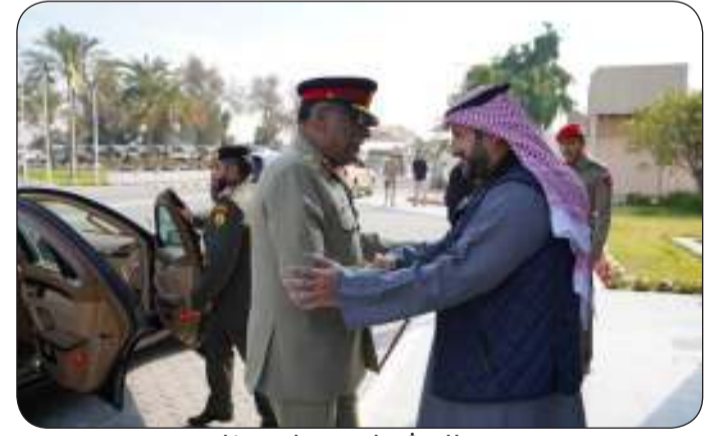
المشعل مرحبا بمرزا

مرزا قام بزيارة إلى كلية "مبارك العبدالله" للقيادة والأركان المشتركة حيث استمع خلالها إلى إيجاز شامل عن دور الكلية في إعداد وتأهيل القيادات العسكرية وبرامج الكلية الأكاديمية والتدريبية التي تهدف إلى تطوير المهارات القيادية وتعزيز الكفاءة العملية للضباط. وسبل تعزيزها وتطويرها بين البلدين الصديقين. جاء ذلك في بيان صحفي صادر عن رئاسة الأركان العامة عقب استقبال اللواء صباح جابر الأحمد للفريق مرزا والوفد المرافق له بمناسبة زيارته الرسمية للبلاد حيث أقيمت للضيف مراسم استقبال رسمية. وذكر البيان أن الفريق