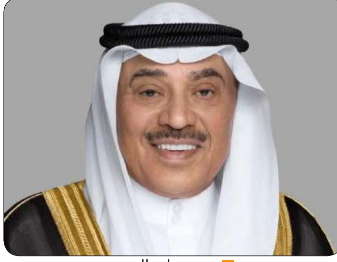
سمو ولي العهد