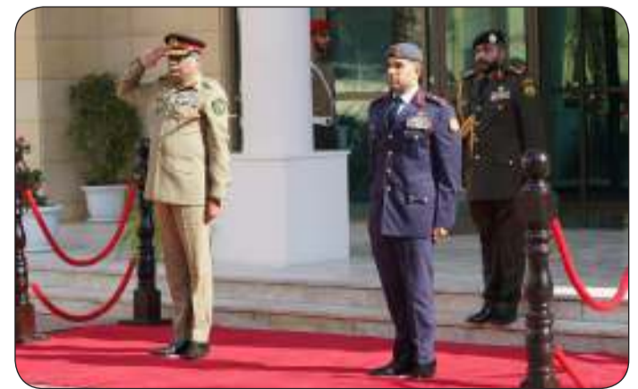
نائب رئيس الأركان مستقبلا مرزا