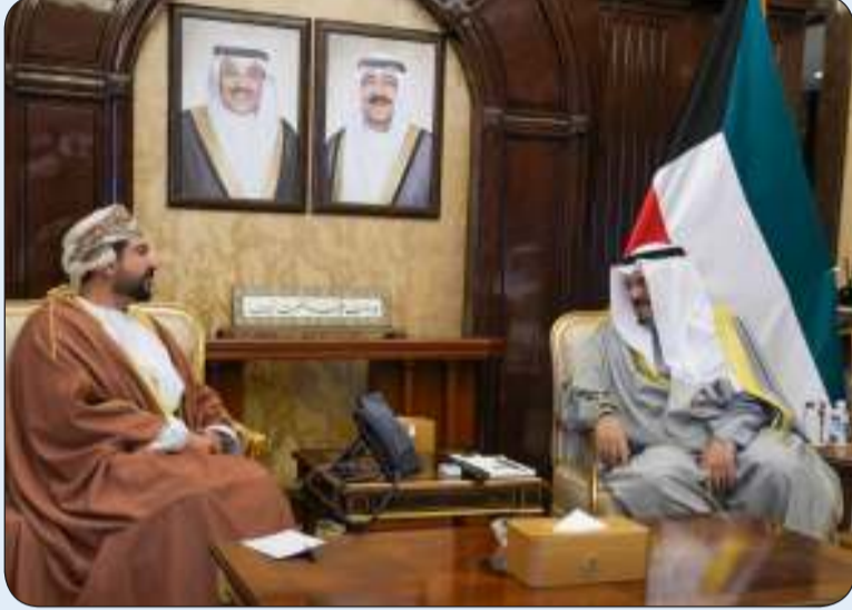
سمو رئيس مجلس الوزراء مستقبلا وزير التجارة العماني

استقبل سمو الشيخ أحمد العبدالله رئيس مجلس الوزراء وبحضور وزير التجارة والصناعة خليفة العجيل في قصر بيان أمس وزير التجارة والصناعة وترويج الاستثمار في سلطنة عمان الشقيقة قيس بن محمد اليوسف والوفد المرافق له وذلك بمناسبة زيارته إلى البلاد لحضور المنتدى والمعرض الاقتصادي الكويتي - العماني.