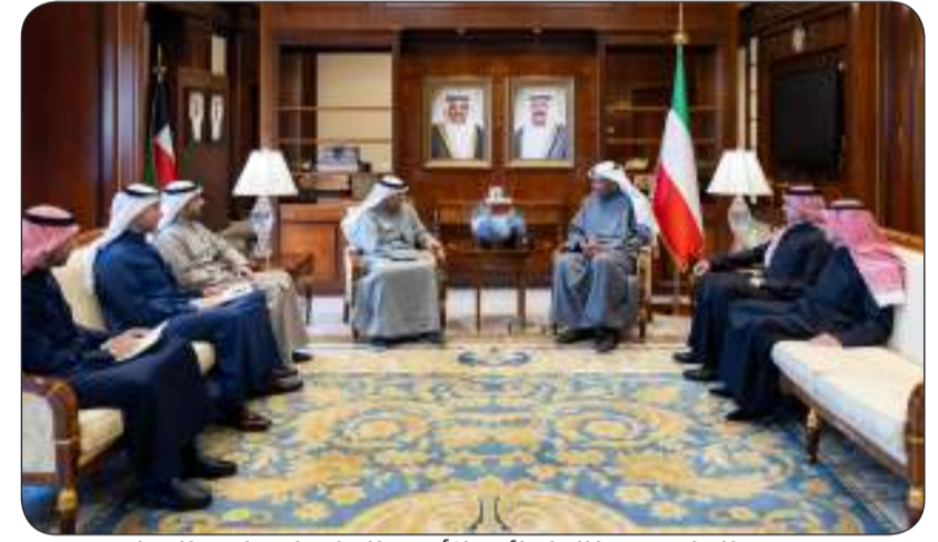
وزير الخارجية خلال لقائه بالأمين العام لمجلس التعاون

التقى وزير الخارجية عبدالله اليحيا بالأمين العام لمجلس التعاون لدول الخليج العربية جاسم البديوي صباح أمس الاثنين في ديوان عام وزارة الخارجية. وقالت "الخارجية" في بيان صحفي إنه تمت خلال اللقاء مناقشة أطر تعزيز الجهود الداعمة لمسيرة العمل الخليجي المشترك نحو مزيد من التضامن والترابط واستعراض الاستحقاقات المقبلة في إطار المنظومة الخليجية وبحث آخر المستجدات على الساحتين الإقليمية والدولية. من جانب آخر أجرى وزير الخارجية عبدالله اليحيا بالأمين العام لمجلس التعاون لدول الخليج العربية جاسم البديوي صباح أمس الاثنين في ديوان عام وزارة الخارجية. وقالت "الخارجية" في بيان صحفي إنه تمت خلال اللقاء مناقشة أطر تعزيز الجهود الداعمة لمسيرة العمل الخليجي المشترك نحو مزيد من التضامن والترابط واستعراض الاستحقاقات المقبلة في إطار المنظومة الخليجية وبحث آخر المستجدات على الساحتين الإقليمية والدولية.