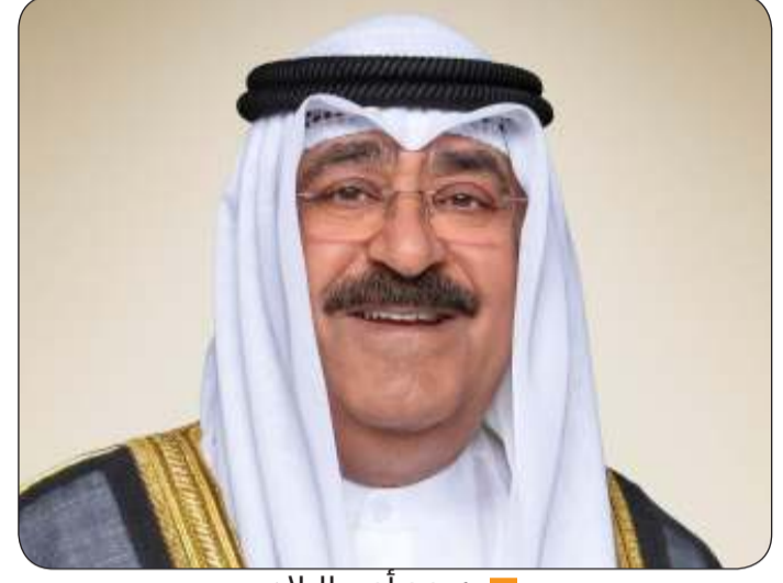
سمو أمير البلاد

استقبل سمو أمير البلاد الشيخ مشعل الأحمد بقصر بيان صباح أمس سمو الشيخ أحمد العبدالله رئيس مجلس الوزراء. كما استقبل سمو ولي العهد الشيخ صباح خالد سمو الشيخ الوزراء.