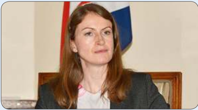
السفيرة البريطانية بليندا لويس

قالت السفيرة البريطانية لدى البلاد بليندا لويس إن عام 2024 كان عاما مميزا لكل من المملكة المتحدة والكويت، حيث شاركت حكومتنا البلدين في احتفالات مشتركة للاحتفال بمرور قرن ورابع من العلاقات الدبلوماسية الرسمية. وأضافت لويس، في تصريح صحفي، أنه في حين أن التعاون في مجالات مثل التجارة والاستثمار والدفاع والأمن، كان بمثابة الأساس لعلاقتنا الخاصة منذ فترة طويلة، فإن ما يربطنا حقا هو الروابط المميزة بين شعبيينا، لذلك، فقد كان أول إعلان رئيسي لنا هذا العام هو طرح نظام التصاريح الإلكترونية للسفر "ETA" في فبراير للمواطنين الكويتيين، مما جعل القيام برحلات قصيرة إلى المملكة المتحدة أسهل وأكثر مرونة من أي وقت مضى. وتابعت: يسعدني أن أبلغكم بأنه كان هناك إقبال قوي للغاية حتى الآن، مع إصدار 47142 تصريحاً إلكترونياً للسفر للكويتيين في الفترة الممتدة من يوليو إلى سبتمبر، ليصل الإجمالي إلى 95381 منذ فتح الطلبات في فبراير. وأضافت: بالنيابة عن الحكومة البريطانية، أود أن أتمنى لكل من يسافر إلى المملكة المتحدة لقضاء عطلة عيد الميلاد ورأس السنة الجديدة وما بعدهما رحلة آمنة وممتعة.