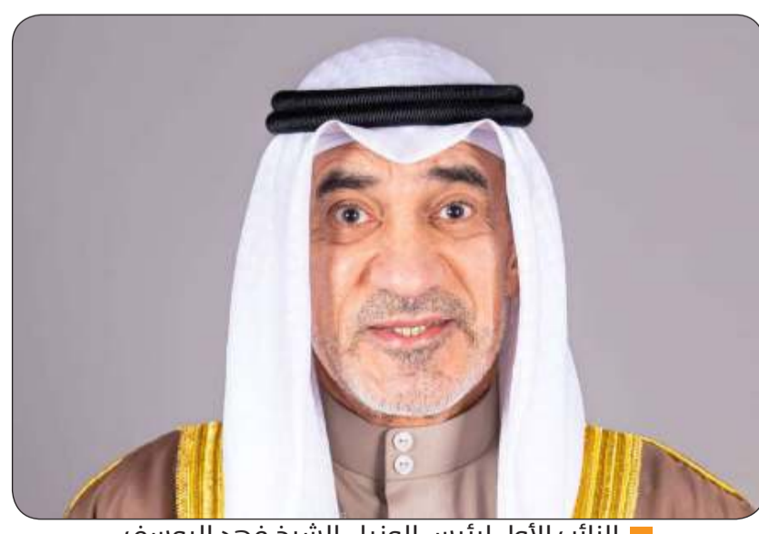
النائب الأول لرئيس الوزراء الشيخ فهد اليوسف

وأضافت أن الشيخ فهد اليوسف عبر في البرقية عن الاعتزاز بعمق العلاقات التاريخية والروابط الأخوية المتينة بين بلدينا الشقيقين "سائلاً الله سبحانه وتعالى أن يديم عليكم موفور الصحة والعافية وأن يديم على دولة قطر الشقيقة نعمة الأمن والاستقرار والازدهار في ظل قيادتها الحكيم والرشيده".