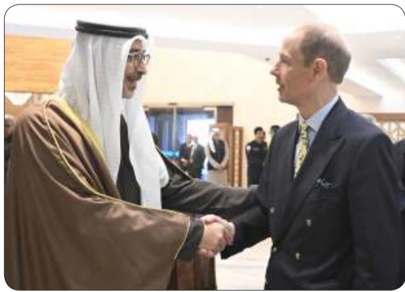
وزير شؤون الديوان الأميري مودعا الأمير إدوارد دوق إنديره

بعث سمو أمير البلاد الشيخ مشعل الأحمد ببرقية تهنئة إلى أخيه صاحب السمو الشيخ تميم بن حمد آل ثاني أمير دولة قطر الشقيقة عبر فيها سموه عن خالص تهانئه بمناسبة ذكرى اليوم الوطني لتولي مؤسس دولة قطر الشقيقة الشيخ جاسم بن محمد بن ثاني آل ثاني الحكم في البلاد. مشيداً سموه بالعلاقات الأخوية الوطيدة والتاريخية