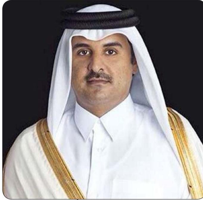
سمو الشيخ تميم بن حمد أمير دولة قطر