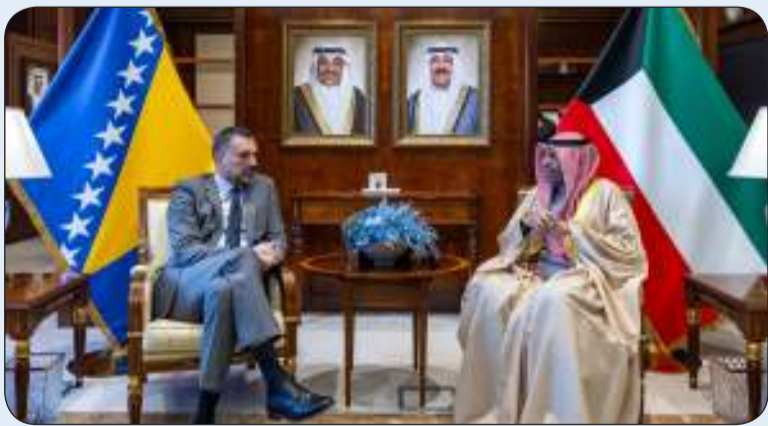
اليحيى مستقبلاً وزير الخارجية البوسني

التقى وزير الخارجية عبدالله اليحيى أمس الأربعاء بوزير خارجية البوسنة والهرسك المدين كوناكوفيتش بمناسبة زيارته الرسمية والوفد المرافق إلى دولة الكويت. وتم خلال اللقاء استعراض العلاقات الوثيقة التي تربط البلدين الصديقين وأطر تعزيزها وتنميتها في مختلف المجالات. كما تم بحث التطورات الراهنة على الصعيدين الإقليمي والدولي والمواضع محل الاهتمام المشترك.