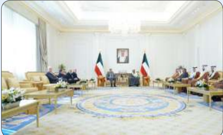
سمو ولي العهد مستقبلاً وزير خارجية البوسنة والوفد المرافق له

استقبل سمو ولي العهد الشيخ صباح الخالد بقصر بيان صباح أمس وزير خارجية البوسنة والهرسك الصديقة المدين كوناكوفيتش والوفد المرافق وذلك بمناسبة زيارته الرسمية للبلاد. حضر اللقاء وزير الخارجية عبدالله