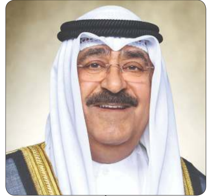
سمو أمير البلاد