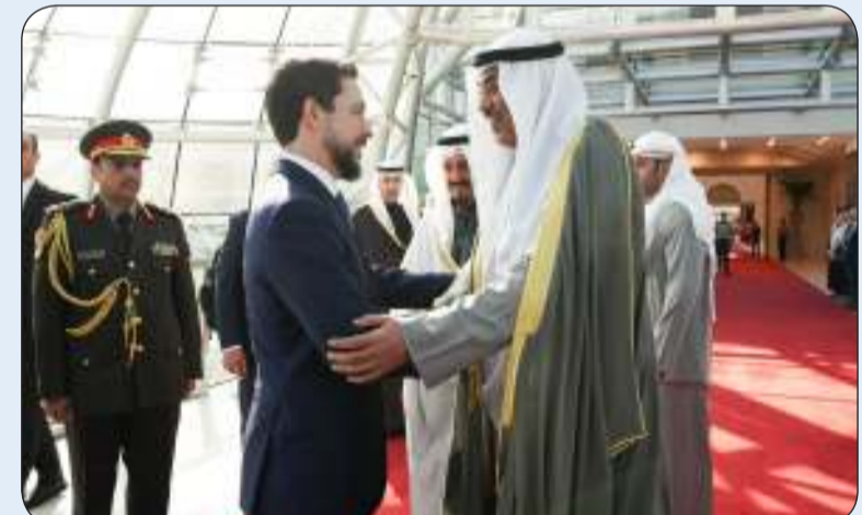
سمو ولي العهد مودعاً ولي العهد الأردني الأمير الحسين بعد زيارة رسمية للبلاد

غادر البلاد ظهر أمس صاحب السمو الملكي الأمير الحسين بن عبدالله الثاني ولي العهد في المملكة الأردنية الهاشمية الشقيقة والوفد الرسمي المرافق لسموه وذلك بعد زيارة رسمية للبلاد. وكان في وداع سموه على أرض المطار سمو ولي العهد الشيخ صباح