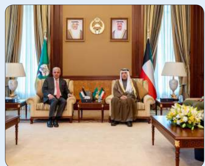
الشيخ مبارك الحمود يؤكد الحرص على العلاقات المتميزة بين الكويت وفلسطين

أكد رئيس الحرس الوطني الشيخ مبارك الحمود أمس الاثنين الحرص على العلاقات المتميزة التي تجمع دولة الكويت ودولة فلسطين الشقيقة. وذكر الحرس الوطني في بيان صحفي أن ذلك جاء خلال استقبال الشيخ مبارك الحمود في ديوانه بالرئاسة العامة للحرس الوطني