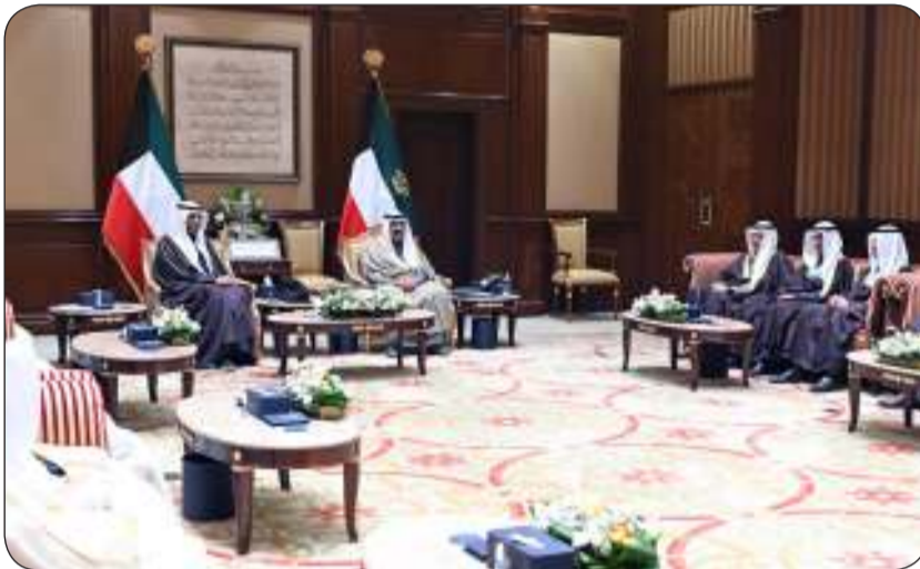
جانب من الاستقبال

بولندا علي ثنيان حمادة سفيراً لدولة الكويت لدى جمهورية بنغلاديش الشعبية مطلق عبدالله الخويصر سفيراً لدولة الكويت لدى منغوليا خالد عبدالرحيم الزعابي قنصلاً عاماً لدولة الكويت لدى دولة الامارات العربية المتحدة في اماره دبي والامارات الشمالية الشيخ صباح الناصر سفيراً لدولة الكويت لدى نيوزيلندا يوسف عبدالله التنيب قنصلاً عاماً لدولة الكويت لدى المملكة العربية السعودية في مدينة جدة حيث أدوا اليمين الدستورية أمام سموه بمناسبة تسلمهم مناصبهم الجديدة. حضر مراسم أداء القسم كبار المسؤولين بالدولة.