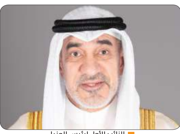
النائب الأول لرئيس الوزراء

بمناسبة الاحتفال بالعيد الوطني الـ "53" لمملكة البحرين الشقيقة وعن اعتزازه بععم العلاقات التاريخية والروابط الأخوية المتينة بين البلدين الشقيقين. وسأل الله سبحانه وتعالى أن يديم على وزير الداخلية البحريني موفور الصحة والعافية وأن يديم على مملكة البحرين الشقيقة نعمة الأمن والاستقرار والازدهار في ظل قيادتها الحكيمة والرشيده.