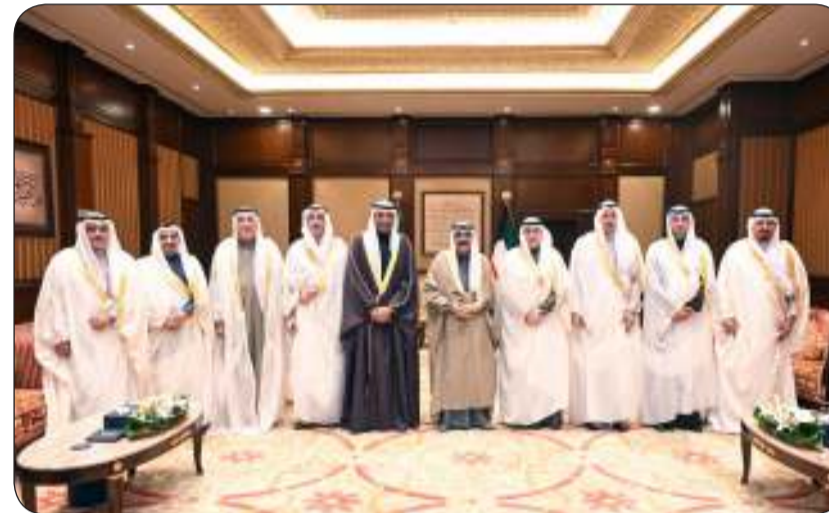
سمو الأمير مستقبلاً وزير الخارجية حيث قدم لسموه رؤساء البعثات الدبلوماسية والقنصلية الجدد

مجلس الوزراء ببرقيته تهنئة مماثلتين. من جهة أخرى استقبل صاحب السمو بقصر بيان صباح أمس وزير الخارجية عبدالله اليحيا