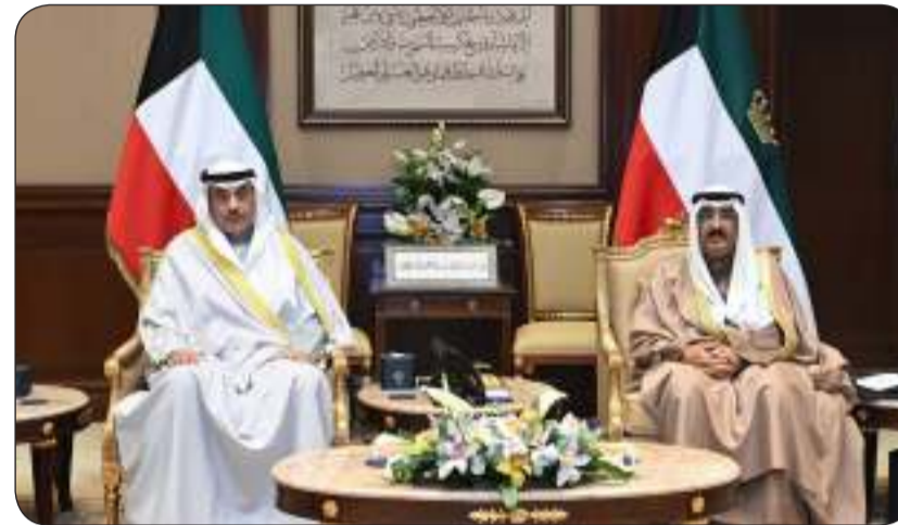
سمو الأمير مستقبلا سمو ولي العهد

استقبل سمو أمير البلاد الشيخ مشعل الأحمد بقصر بيان صباح أمس سمو ولي العهد الشيخ صباح الخالد.