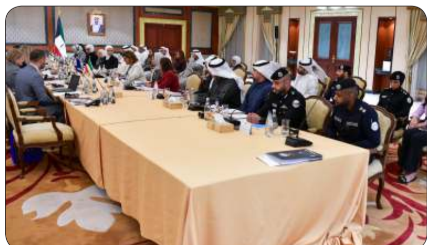
جانب من الحوار غير الرسمي بشأن حقوق الإنسان بين الكويت والاتحاد الأوروبي