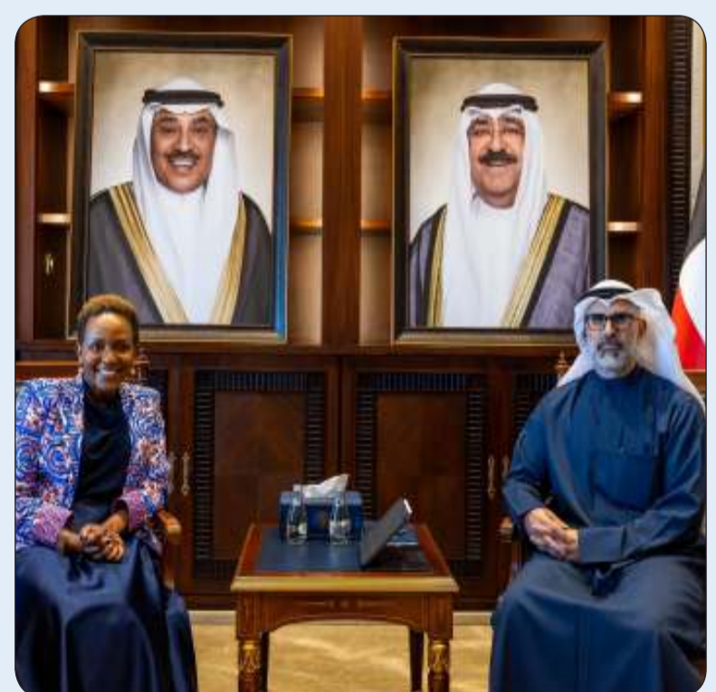
نائب وزير الخارجية مستقبلا جويس مسويا

استقبل نائب وزير الخارجية السفير الشيخ جراح الجابر مساعدة الأمين العام للأمم المتحدة للشؤون الإنسانية ونائبة منسق الإغاثة في حالات الطوارئ جويس مسويا بمناسبة زيارتها للبلاد للمشاركة في حدث إطلاق للمحة العامة للعمل الإنساني العالمي لعام 2025 والذي تستضيفه دولة الكويت. وقالت وزيرة الخارجية في بيان لها إن نائب الوزير أكد