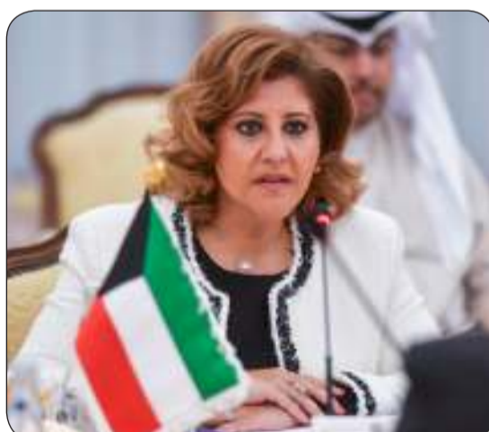
السفيرة الشيخة جواهر الصباح ترأس الجانب الكويتي

وحرية التعبير والتجمع وسيادة القانون. ويتضمن الحوار تبادل وجهات النظر حول وهيات واليات حقوق الإنسان والاستعراض الدوري الشامل على المعاهدات الدولية والإجراءات الخاصة. وترأس الجانب الكويتي مساعد وزير الخارجية لشؤون حقوق الإنسان السفيرة الشيخة جواهر إبراهيم دعيج الصباح فيما ترأس الجانب الأوروبي رئيسة شعبة شبه الجزيرة العربية والعراق بالخارج الأوربية للعمل الخارجي بالاتحاد الأوروبي آنا ماريانا باجاجيو تاكوبولو.