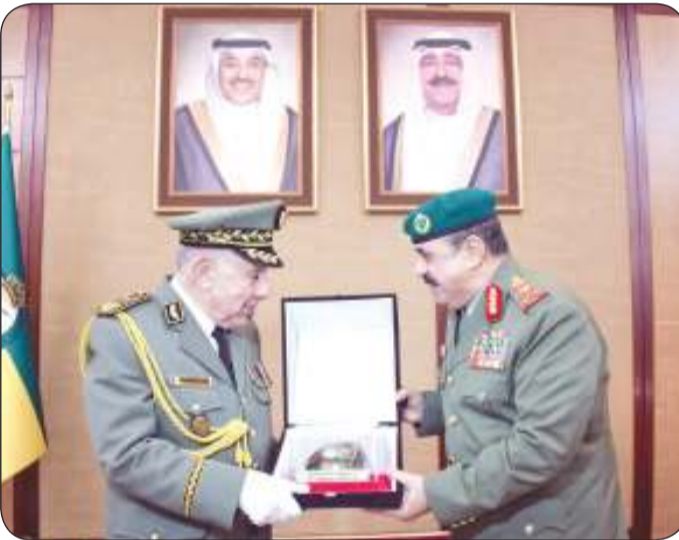
وكيل الحرس الوطني يقدم درعا تذكارية لشنقريحة