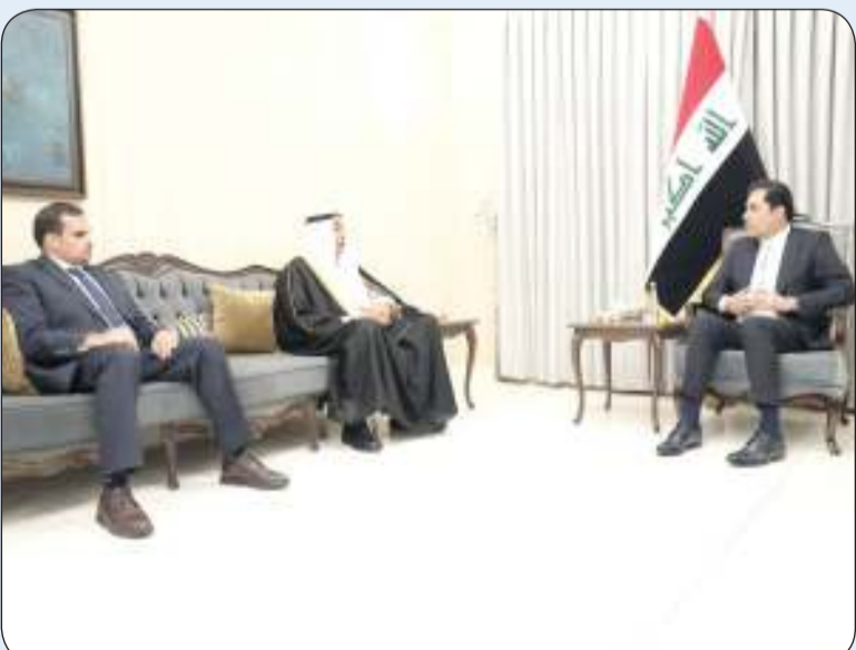
السفير الكويتي يلتقي نائب رئيس البرلمان العراقي

بغداد - «كونا»: بحث السفير الكويتي لدى العراق طارق الفرج مع النائب الأول لرئيس مجلس النواب العراقي محسن المنذلاوي سبل تعزيز العلاقات الثنائية بين البلدين. وقال الفرج لـ «كونا» أمس الأول الثلاثاء إنهما ناقشا أثناء اللقاء مجمل العلاقات الثنائية وسبل