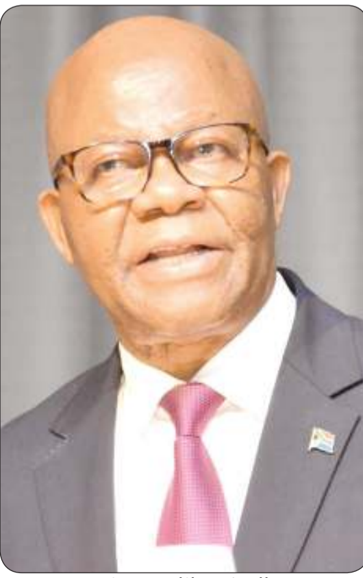
السفير مانليسي جنجي

بغداد - «كونا»: بحث السفير الكويتي لدى العراق طارق الفرج مع النائب الأول لرئيس مجلس النواب العراقي محسن المنذلاوي سبل تعزيز العلاقات الثنائية بين البلدين. وقال الفرج لـ «كونا» أمس الأول الثلاثاء إنهما ناقشا أثناء اللقاء مجمل العلاقات الثنائية وسبل