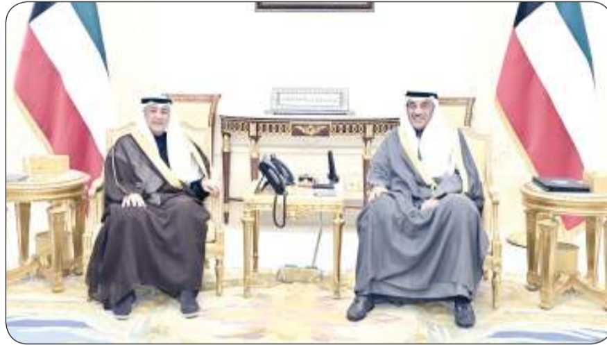
سمو ولي العهد مستقبلا الأمين العام لمجلس التعاون لدول الخليج العربية

استقبل سمو ولي العهد الشيخ صباح الخالد في قصر بيان صباح أمس، الأمين العام لمجلس التعاون لدول الخليج العربية جاسم البديوي. واطلع سموه من البديوي على أهم المواضيع المطروحة على جدول أعمال الدورة الخامسة والأربعين للمجلس الأعلى لمجلس التعاون لدول الخليج العربية والتي ستعقد بدولة الكويت بتاريخ 1 ديسمبر. من جانب آخر، استقبل سموه عمدة الحي المالي لمدينة لندن الدرمان كنج وذلك بمناسبة زيارته للبلاد. حضر اللقاء وزيرة المالية ووزيرة الدولة للشؤون الاقتصادية والاستثمار نورة سليمان الفصام ومدير مكتب سمو ولي العهد الفريق متقاعد جمال محمد الذباب ووكيل الشؤون الخارجية بديوان سمو ولي العهد مازن عيسى العيسى وسفيرة المملكة المتحدة لدى دولة الكويت بليندا لويس.