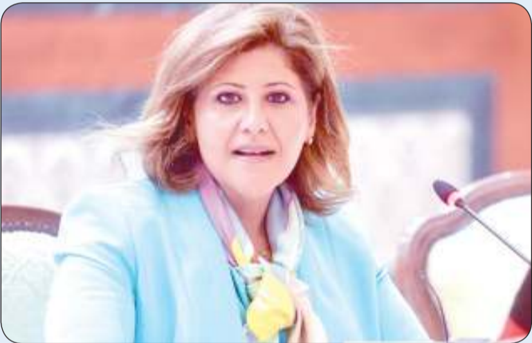
الشيخة جواهر الصباح

وقالت إن انعقاد هذا المؤتمر الوزاري يأتي في توقيت دقيق للغاية نظراً لما تمر به المنطقة العربية من أزمات ونزاعات متلاحقة تلقي بظلالها على جميع الفئات لا سيما الضعيفة والمستضعفة منها كالمراة والأطفال مؤكدة أنه «بات من الواجب واللازم اتخاذ كل ما يلزم استشعاراً بمعاناتهم». وأعربت عن قلق دولة الكويت البالغ إزاء ما يتعرض له الأشقاء في فلسطين ولبنان والسودان ومن اتساع دائرة الاقتتال والعنف وما تخلفه الصراعات من تداعيات مدمرة على الحالة الإنسانية وتزايد في أعداد الشهداء من المدنيين الأبرياء.