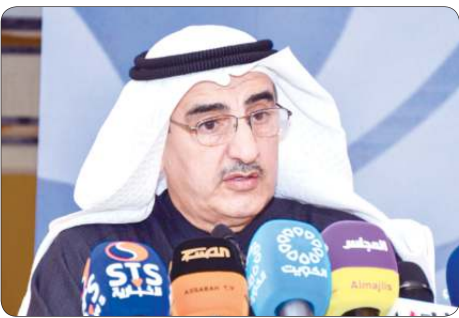
رئيس الهيئة العامة لمكافحة الفساد نزاهة

إجراءات تبادل المعلومات والتحديات بين سلطات إنفاذ قوانين مكافحة الفساد بغرض منع جرائمه وكشفها والتحقيق فيها وملاحقة مرتكبيها واسترداد الموجودات المسروقة بالإضافة إلى تعزيز تبادل المساعدة التقنية والتدريب وتبادل الخبرات بين الدول الأعضاء بغية تحسين فاعلية تبادلها للمعلومات والتحديات بهذا الشأن.