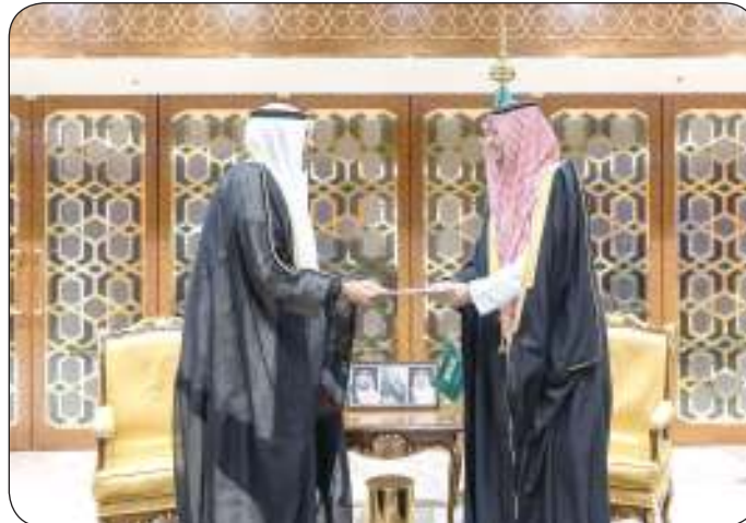
الأمير تركي بن محمد يتسلم الرسالة من مبعوث صاحب السمو

إن الوزير يحيى تمنى للسفير الجديد التوفيق في مهام عمله وللعلاقات الثنائية الوثيقة التي تجمع البلدين الصديقين المزيد من التقدم والازدهار. وتسلم اليحيا نسخة من أوراق اعتماد سفير جمهورية السلفادور لدى دولة الكويت خوان كارلوس ستابن بويلا.