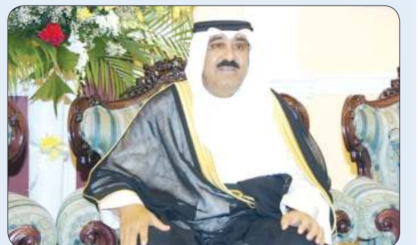
سمو أمير البلاد

إلى ياماندو أورسي - الرئيس المنتخب في جمهورية الأوروغواي الشرقية الصديقة عبر فيها سموه عن خالص تهنئه بمناسبة فوزه بالانتخابات الرئاسية في جمهورية الأوروغواي الشرقية والصديقة، متمنياً سموه له كل التوفيق والسداد وموفور الصحة والعافية ولجمهورية الأوروغواي الرقي والازدهار.