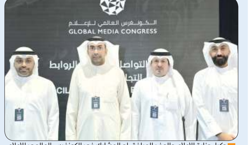
وكيل وزارة الإعلام والوفد المرافق له المشارك في الكونغرس العالمي للإعلام

أبو ظبي - «كونا»: أكد وكيل وزارة الإعلام الدكتور ناصر محيسن أمس الثلاثاء أهمية مشاركة دولة الكويت في أعمال «الكونغرس العالمي للإعلام» في دورته الثالثة الذي انطلق في أبو ظبي لبحث التطور التكنولوجي الإعلامي وتبادل الخبرات.