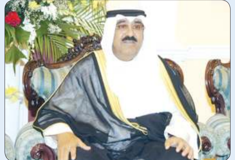
سمو أمير البلاد

بعث سمو أمير البلاد الشيخ مشعل الأحمد ببرقية تهنئة إلى صاحب السمو الأمير ألبرت الثاني - أمير إمارة موناكو الصديقة عبر فيها سموه عن خالص تهانيه بمناسبة العيد الوطني لبلاده، متمنيا سموه له موفور الصحة والعافية