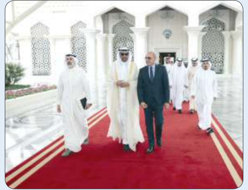
اليحيا مغادراً إلى تونس

غادر وزير الخارجية عبد الله اليحيا البلاد متوجهاً إلى الجمهورية التونسية لترؤس وفد دولة الكويت المشارك في أعمال الدورة الرابعة للجنة المشتركة الكويتية - التونسية.