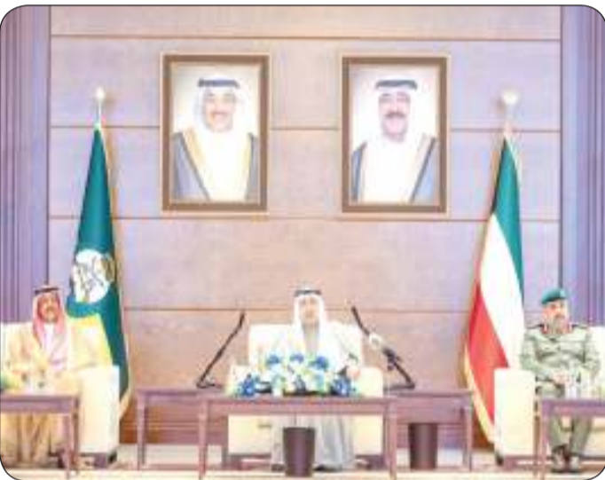
رئيس الحرس يلقي كلمته متوسلاً النواف والرفاعي

التقدير لسمو ولي العهد على دعمه ومساندته وثقته الغالية التي نعتر ونفخر بها نجدد العهد والميثاق لصاحب السمو وولي العهد بأن نكون على مستوى الثقة والمسؤولية وبذل الغالي والنفيس من أجل إعلاء مكانة الحرس فيصل النواف: رجال الحرس سيواصلون عطاءهم لما فيه مصلحة الكويت الرفاعي: سنظل جنوداً أوفياء للوطن الغالي وسنكمل مسيرة الازدهار والتطور