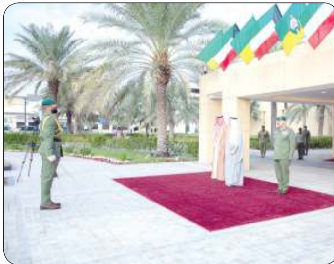
جانب من مراسم استقبال رئيس الحرس الوطني الجديد الشيخ مبارك الحمود

فيصل الصباح رئيس الحرس الوطني على ثقة القيادة الحكيمة في شخصه الكريم مؤكداً أنه امتداد لمسيرة المغفور له بإذن الله تعالى سمو الشيخ سالم العلي الصباح.