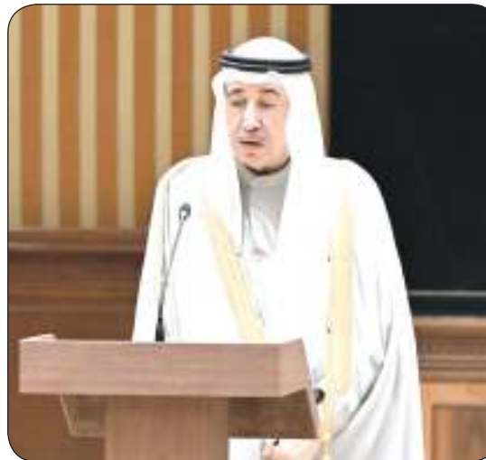
الشيخ مبارك الحمود يؤدي اليمين الدستورية