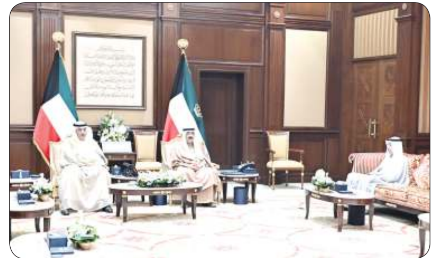
سمو أمير البلاد مستقبلاً بحضور سمو ولي العهد رئيس الحرس الوطني الجديد

وبعث سمو ولي العهد الشيخ صباح الخالد، وسمو الشيخ أحمد عبدالله رئيس مجلس الوزراء ببرقيته تهنئة مفاظلتين.