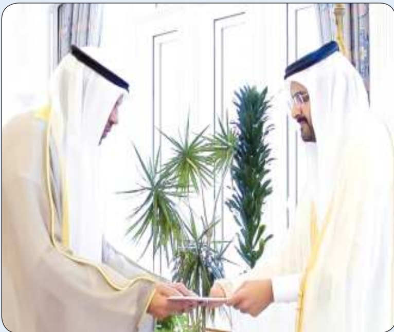
مبعوث الأمير يسلم الرسالة إلى نائب أمير قطر

بن حمد آل ثاني وزير الخارجية أمس الاثنين في الدوحة. والتقى مبعوث الأمير برئيس مجلس الوزراء وزير خارجية دولة قطر الشقيقة الشيخ محمد بن عبدالرحمن بن جاسم آل ثاني في إطار الزيارة الرسمية التي يجريها إلى العاصمة الدوحة. وتم خلال اللقاء استعراض الأواصر الوثيقة والعلاقات الأخوية المتينة التي تربط البلدين الشقيقين وسبل تعزيزها وتنميتها في مختلف المجالات ومناقشة أبرز التطورات على الساحتين الإقليمية والدولية والقضايا محل الاهتمام المشترك.