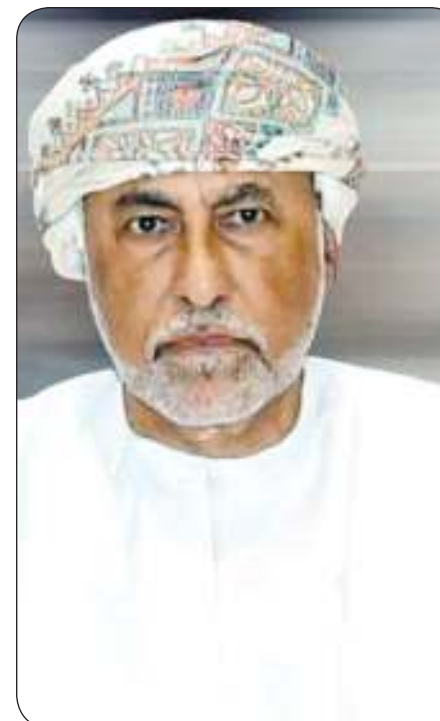
شهاب بن طارق آل سعيد