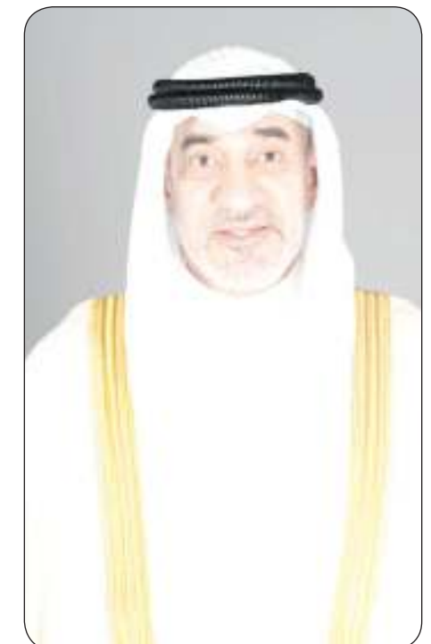
الشيخ فهد اليوسف

بيان صحفي صادر عن وزارة الدفاع عن اعترازه بعمق العلاقات التاريخية المتجذرة والروابط الأخوية المتينة ووحدة المصير المشترك الذي يجمع بين البلدين الشقيقين سائلا المولى عز وجل أن يعيد هذه المناسبة على السلطنة قيادة وحكومة وشعبا بالخير واليمن والبركات وعلى قواتها المسلحة بدوام التقدم والرفعة والازدهار في ظل القيادة الحكيمة للسلطان هيثم بن طارق بن تيمور آل سعيد سلطان عمان.