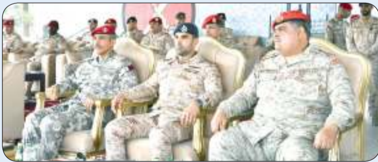
نائب رئيس الأركان خلال حضوره عرضاً عسكرياً لوحدات من قيادة الشرطة العسكرية

أشاد بما يقدمه منتسبو الشرطة العسكرية من جهود وما يقومون به من مهام واجبات مناهضة بهم متمنياً لهم دوام التفوق والجداد والعمل لما فيه خير لوطننا المعطاء في ظل القيادة الحكيمة لسمو أمير البلاد القائد الأعلى للقوات المسلحة وسمو ولي عهده حفظهم الله ورعاهم. ولفت البيان إلى أن برنامج الزيارة استهل بتقديم عرض خاص لقوات الشرطة العسكرية في كيفية التعامل مع عمليات مكافحة الشغب إضافة إلى عرض لبعض المهارات والفنون القتالية في أسلوب التعامل لحفظ أمن الشخصيات خلال تنقلها.