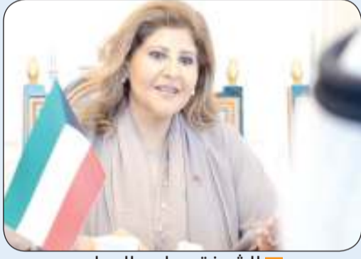
الشيخة جواهر الصباح

عمان - «كونا»: أكدت مساعداً وزير الخارجية لشؤون حقوق الإنسان الصباح أمس الأهمية تبادل الخبرات والمعلومات بين دولة الكويت ومملكة الأردن في المجالات كافة لا سيما في مجال دمج الأشخاص ذوي الإعاقة في المجتمع وتوفير فرص متكافئة لهم.