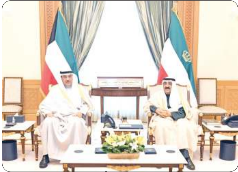
سمو أمير البلاد مستقبلاً سمو ولي العهد

كما أعرب سموه عن اعترازه بعمق أواسر العلاقات الأخوية والتاريخية التي تجمع دولة الكويت بالمملكة المغربية الشقيقة وبإنجازات التنمية البارزة التي حققها البلد الشقيق في كافة المجالات، متمنياً سموه له موفور التقدم والرفق والأزدهار في ظل قيادته الحكيمة. وبعث سمو ولي العهد