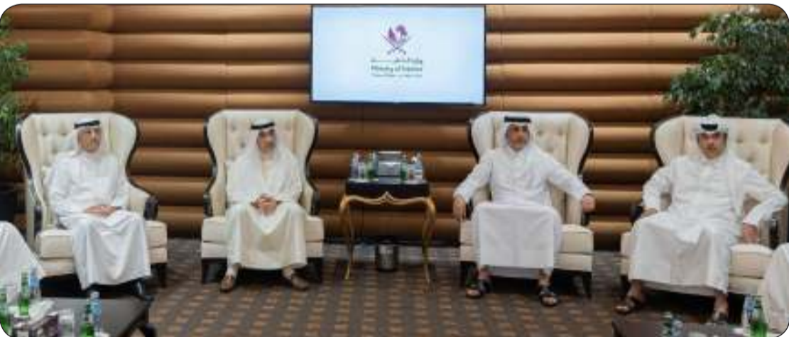
النائب الأول يزور مركز القيادة الوطني القطري في الدوحة