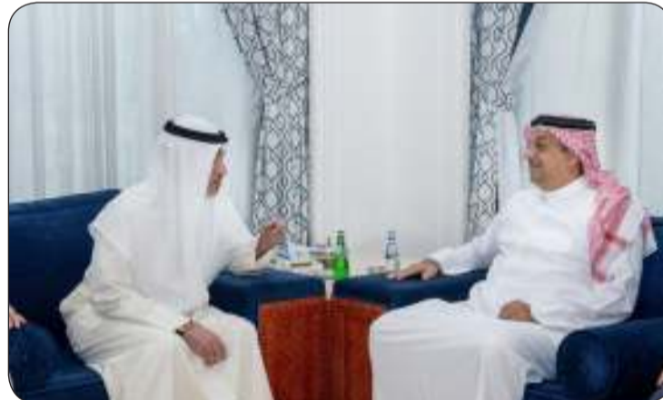
النائب الأول في زيارة لوزير الدولة لشؤون الدفاع القطري