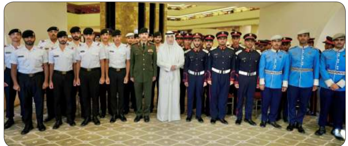
النائب الأول مع الطلبة الضباط الكويتيين الدارسين في الكليات العسكرية بقطر