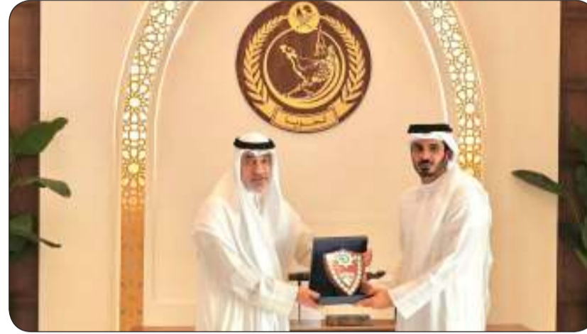
النائب الأول لقي ترحيبا وحفاوة كبيرين خلال زيارته لقطر

الدوحة - "كونا" : أشاد النائب الأول لرئيس مجلس الوزراء ووزير الدفاع ووزير الداخلية الشيخ فهد اليوسف أمس الثلاثاء بالمستوى العالي من الكفاءة والتجهيزات المتطورة في معسكر قوة الأمن الداخلي "لخويا" في دولة قطر مؤكدا أنها تعكس جاهزية واستعداد قوة الأمن الداخلي.