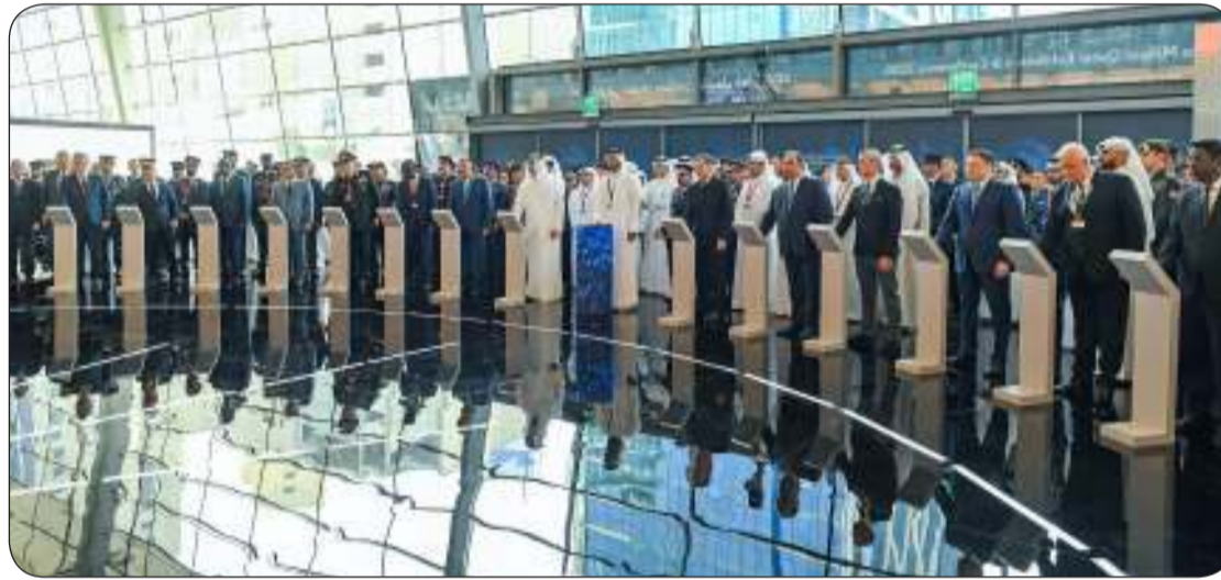
وزراء الداخلية المشاركون يتوسطهم اليوسف يطلقون سويا بداية المؤتمر

والتنسيق في المدن الذكية والأمن وتطوير علوم الطب الشرعي