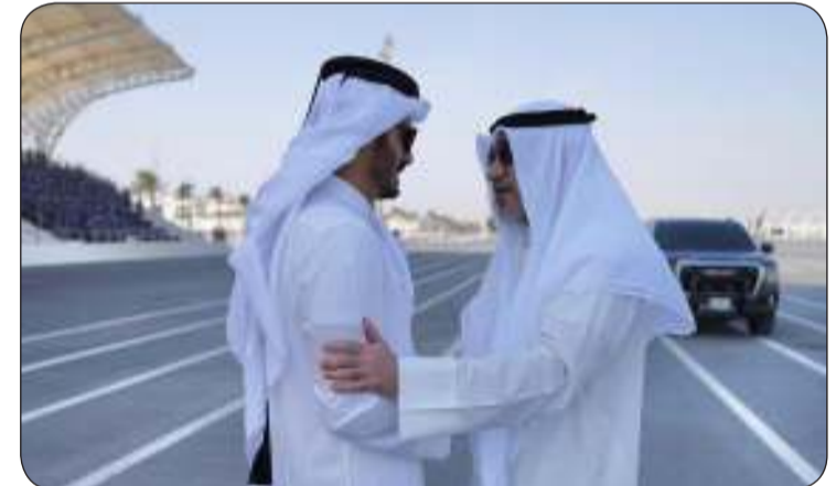
الشيخ فهد اليوسف يشكر الشيخ خليفة بن حمد آل ثاني على الحفاوة والترحيب