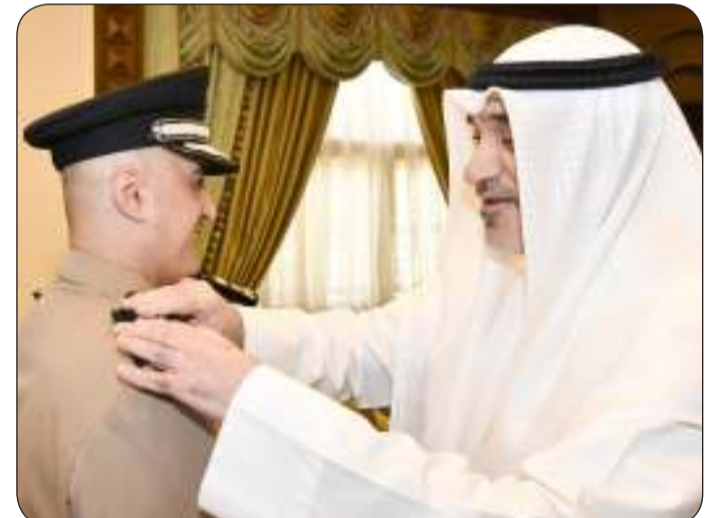
وزير الداخلية يقبل فيصل المكراد رتبة لواء حقوقي

التوفيق في مهامهما مؤكدا أهمية مضاعفة الجهود لتعزيز سيادة القانون والعمل على تطوير منظومة الإطفاء بما يخدم مصلحة الوطن والمواطنين.