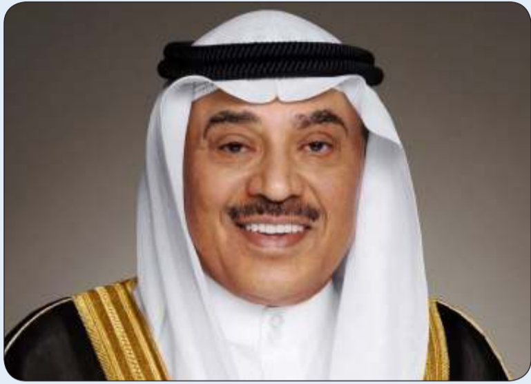
سمو ولي العهد

بحفظ الله وورعايته يغادر ممثل سمو أمير البلاد الشيخ مشعل الأحمد، سمو ولي العهد الشيخ صباح خالد والوفد الرسمي المرافق لسموه أرض الوطن اليوم الأربعاء، الموافق 2 أكتوبر 2024م، متوجها إلى دولة قطر الشقيقة وذلك لترؤس وفد دولة الكويت المشارك في القمة الثالثة لحوار التعاون الآسيوي والتي ستعقد في العاصمة القطرية الدوحة.. رافقت سموه السلامة في الحل والترحال.