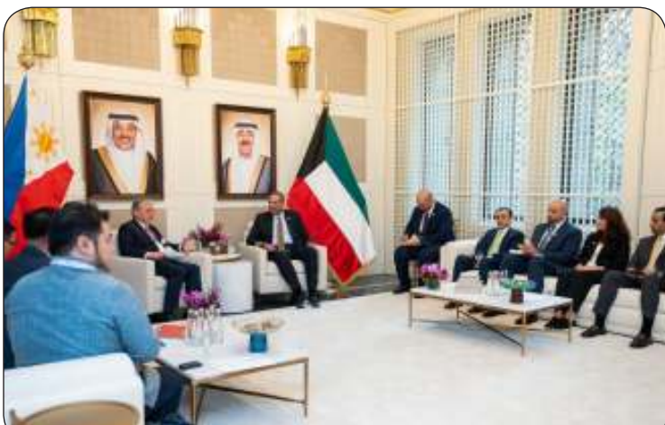
وزير الخارجية ملتقيا وزير خارجية الفلبين