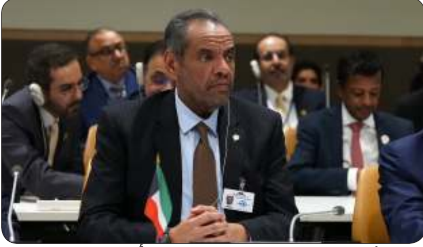
ومتريسا وفد الكويت في الاجتماع مع مجموعة أمريكا اللاتينية والكاريبية

الاستثمارات المتبادلة واتفق بين حكومة دولة الكويت وحكومة جمهورية سان مارينو لتجنب ازدواج الضريبي ومنع التهرب المالي فيما يتعلق بالضرائب على الدخل وعلى رأس المال ومنع التهرب والتجنب الضريبي. كما التقى اليحيا مع مساعدة وزير الخارجية الأمريكي لشؤون الشرق الأدنى باربرا ليف. وتناول اللقاء مجمل العلاقات الثنائية الوثيقة والتعاون الإستراتيجي والولايات المتحدة الأمريكية والصديقة وبحث التطورات الخطيرة في قطاع غزة والتباحث في سبل وقف الجرائم التي تقوم بها قوات الاحتلال الإسرائيلي بحق الأشقاء الفلسطينيين وما يسببه العدوان من كارثة إنسانية دامية. كما التقى اليحيا رئيس معهد السلام الدولي الأمير زيد بن رعد الحسين وذلك وقالت وزارة الخارجية في بيان إنه تم خلال اللقاء التباحث في عدد من القضايا التي تشهدها منطقة الشرق الأوسط وفي مقدمتها القضية الفلسطينية والتطورات الراهنة في قطاع غزة وتبادل الرؤى والأفكار حول أطر مواجهة التهديدات التي تحيط المنطقة ومناقشة التحركات الدولية في هذا الإطار. وأشارت إلى أنه تم أيضا بحث أطر تعزيز التعاون بين معهد سعود الناصر الصباح الدبلوماسي الكويتي ومعهد السلام الدولي في برامج تدريبية مشتركة وتبادل المعلومات والخبرات في إطار نشاطات المعهدين.