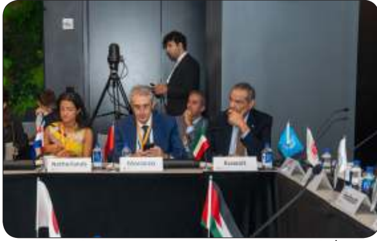
ومشاركا في الاجتماع الوزاري للمنتدى العالمي لمكافحة الإرهاب