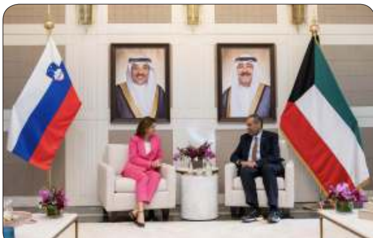
وزير الخارجية أثناء لقائه وزيرة خارجية سلوفينيا تانجا فاجون