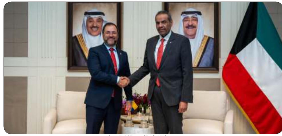
ولتقيا نظيره الفنلندي