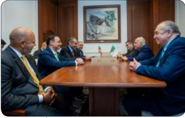
وزير الخارجية ملتقيا نظيره الجزائري