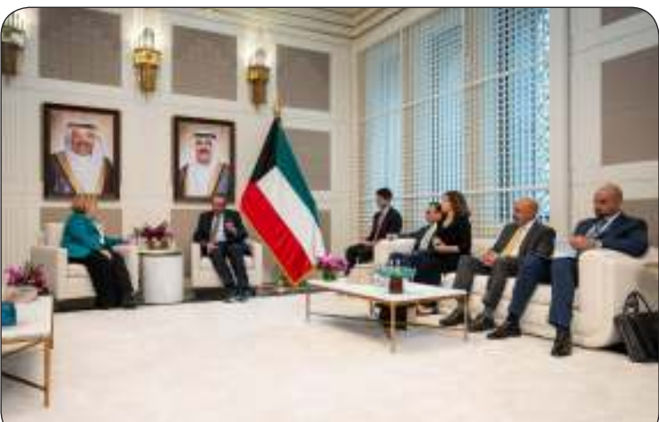
وزير الخارجية ملتقيا بمساعدة وزير الخارجية الأمريكي لشؤون الشرق الأدنى باربرا ليف