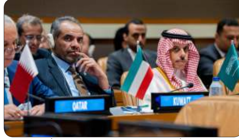
وزير الخارجية متريسا وفد الكويت في الاجتماع الوزاري المشترك مع الصين

شارك وزير الخارجية عبدالله اليحيا في الاجتماع الوزاري المشترك بين وزراء خارجية دول مجلس التعاون لدول الخليج العربية مع جمهورية الصين الشعبية برئاسة مستشار الدولة وزير الخارجية الصيني وانغ بي والذي عقد على هامش أعمال الدورة الـ 79 للجمعية العامة للأمم المتحدة في مدينة نيويورك.