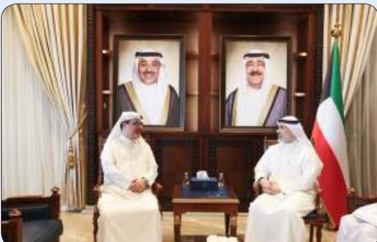
نائب وزير الخارجية مستقبلاً سفير البحرين لدى البلاد

استقبل نائب وزير الخارجية السفير الشيخ جراح الجابر أمس الأربعاء سفير مملكة البحرين لدى دولة الكويت صلاح المالكي حيث بحثا العلاقات الثنائية بين البلدين الشقيقين وسبل توطيدها في كافة المجالات بالإضافة إلى المستجدات على الساحتين الإقليمية والدولية.