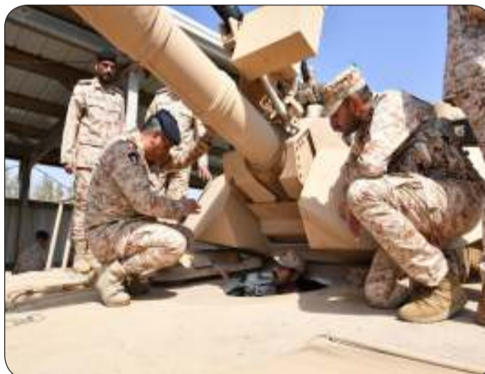
شرح مفصل عن أهم الواجبات الخاصة بلواء السور الآلي 26