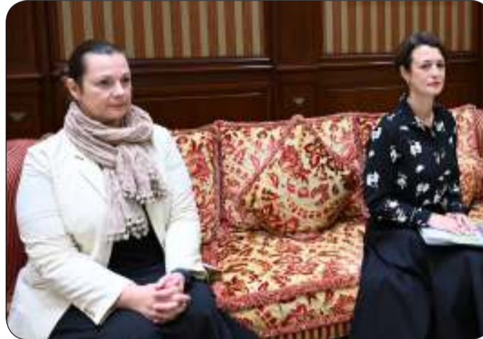
الوفد المرافق لرئيس المجلس الأوروبي