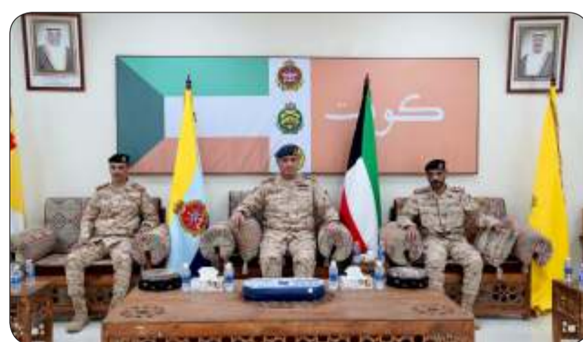
جانب من الزيارة

واستمع أثناء الزيارة إلى شرح عن طبيعة المهام والواجبات التي تقوم بها قيادة قوة صباح المشتركة مع بيان درجة جاهزية والاستعداد التي يتمتع بها منتسبوها وحجم التنسيق والتعاون العسكري القائم والمشارك بين وزارتي الدفاع والداخلية عبر قيامهما بتنفيذ العديد من المهام والتدريبات المشتركة.