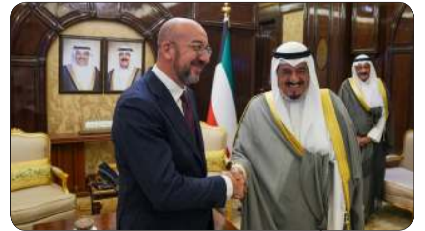
سمو الشيخ أحمد العبدالله ورئيس المجلس الأوروبي شارل ميشيل

استقبل سمو الشيخ أحمد العبدالله وزيراً في قصر بيان أمس رئيس المجلس الأوروبي شارل ميشيل والوفد المرافق له وذلك بمناسبة زيارته للبلاد. وجرى خلال اللقاء استعراض العلاقات الثنائية المتميزة بين دولة الكويت والاتحاد الأوروبي وسبل تعزيزها وتوسيع آفاق التعاون في مختلف المجالات التي تخدم مصالح الجانبين بالإضافة إلى تبادل وجهات النظر حول عدد من القضايا الإقليمية والدولية. حضر المقابلة رئيس ديوان رئيس مجلس الوزراء عبدالعزيز دخيل الدخيل ووزير الخارجية عبدالله علي الجحيا ومساعد وزير الخارجية لشؤون أوروبا السفير صادق محمد معرفي.