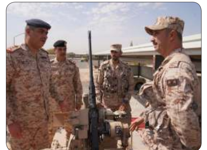
الفريق المزين خلال الجولة التفقدية

الخاصة بلواء السور الآلي/26 وطبيعة المهام التي يقوم بتنفيذها كما قام رئيس الأركان بجولة شملت عدة مرافق داخل اللواء.