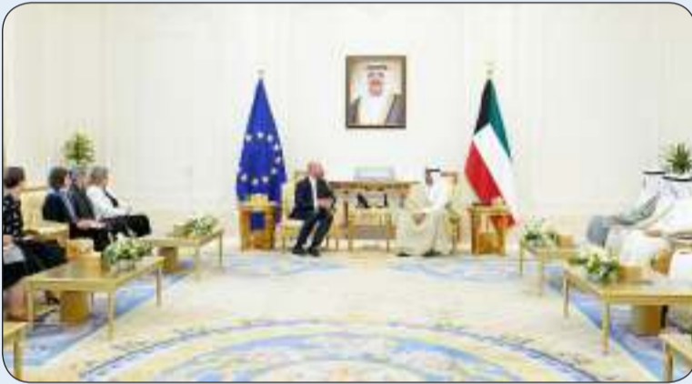
جانب من الاستقبال